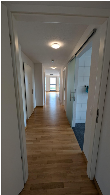
Diehle / Flur