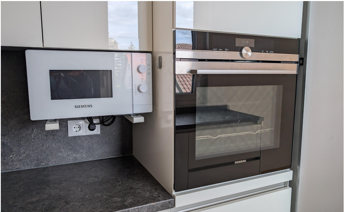
Ofen mit Dampfgerar