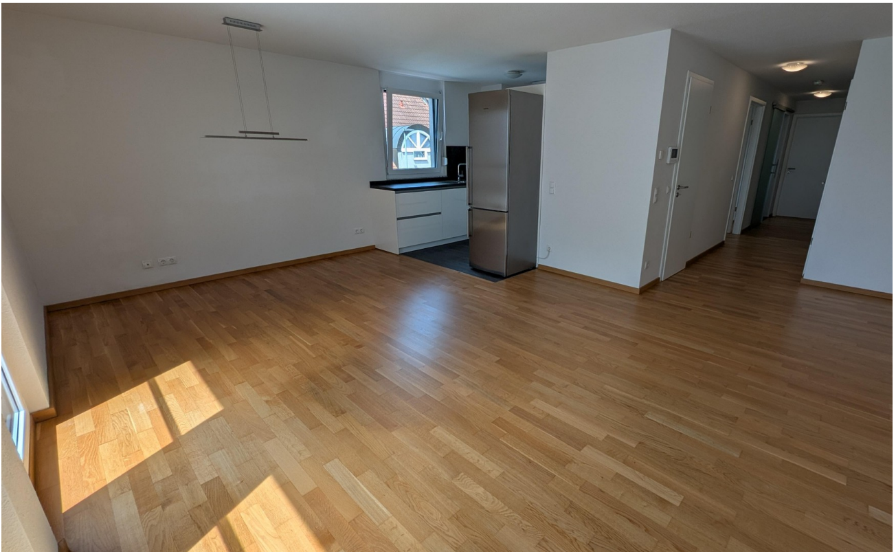
Wohnen & Küche