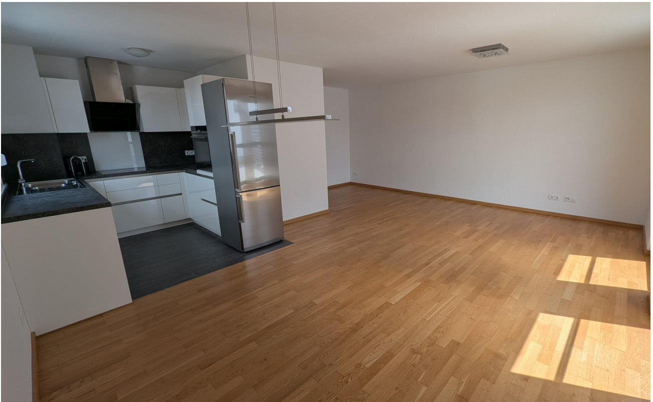
Wohnen & Küche