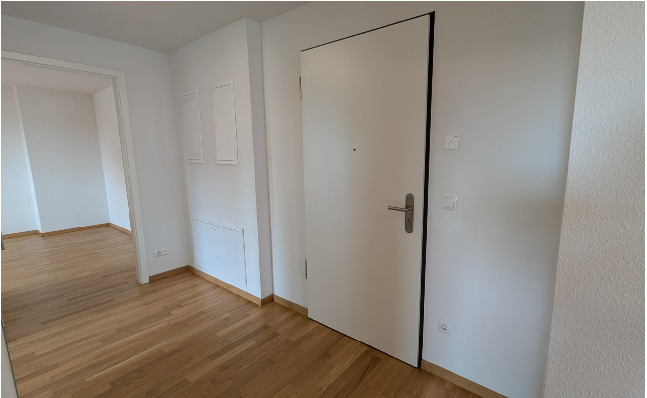
Diehle / Flur