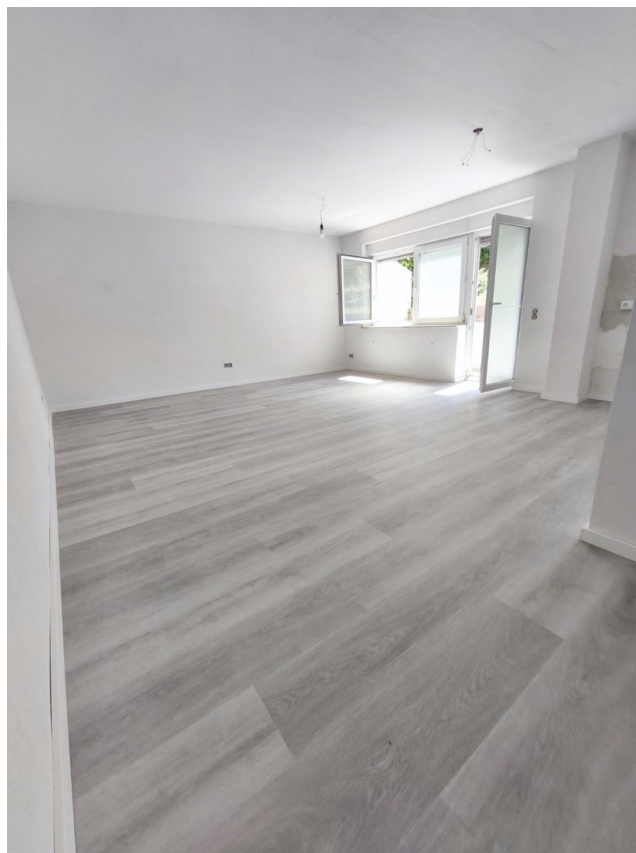
Helles großes WohnEsszimmer