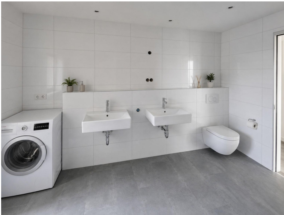
Großes Tageslichtbad - Animation