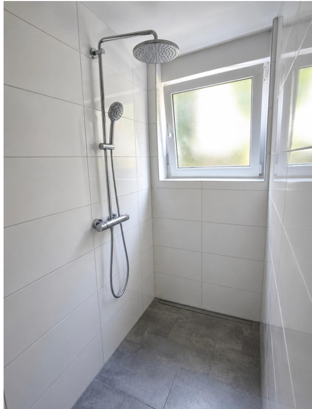
Dusche mit Tageslichtbad