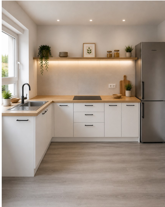
Wohnküche - Animation