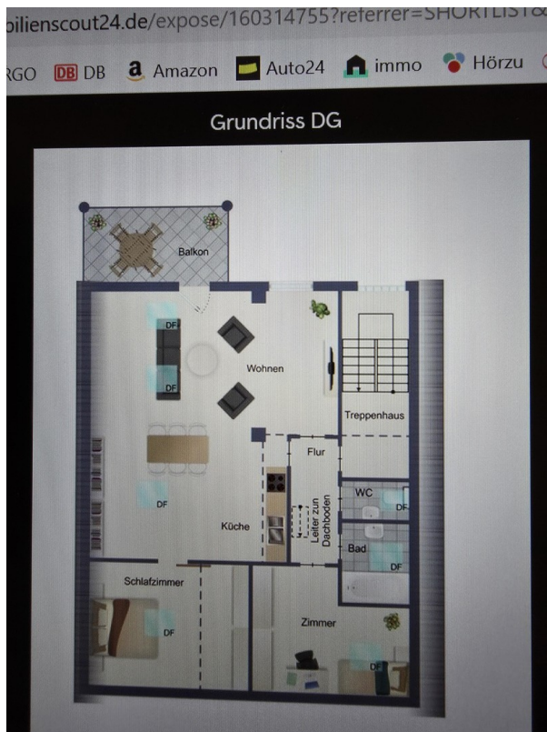
Grundriß DG 85 qm mit Balkon