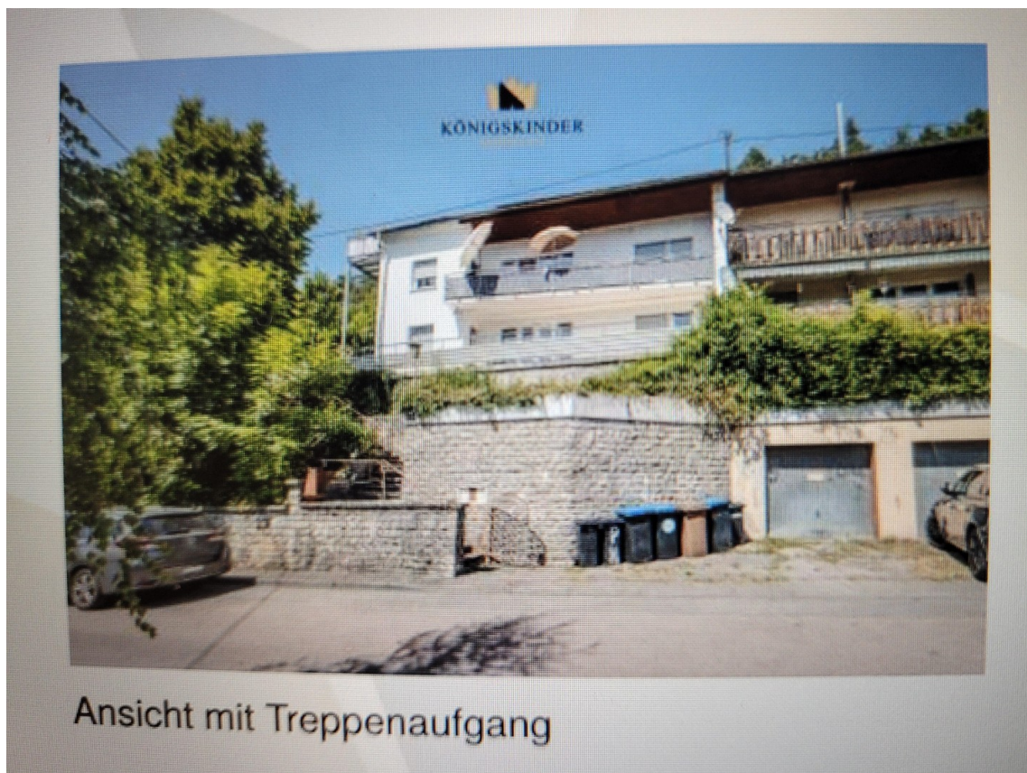
Ansicht 3 FH Südwestlage