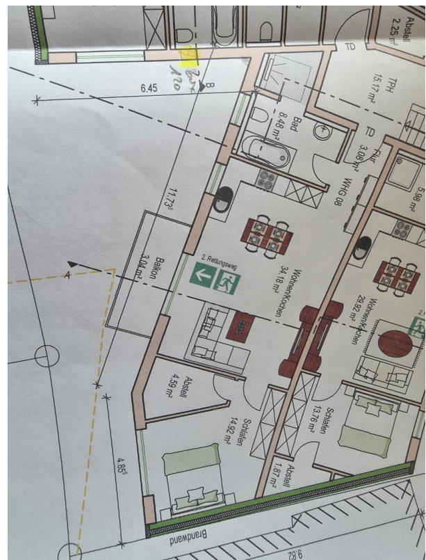
Grundriß OG 2,5 ZW mit 70qm