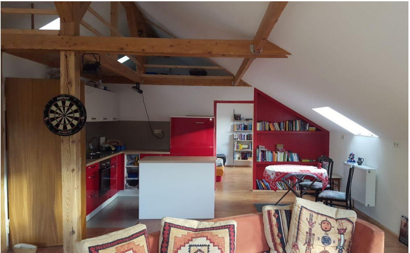
Küche mit Theke