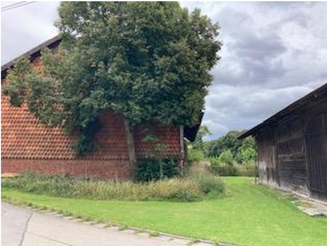
Westen - Fassade Altbestand