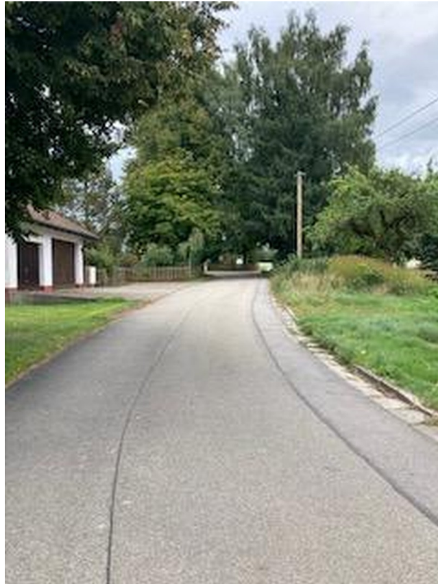
Norden - Anliegerstraße