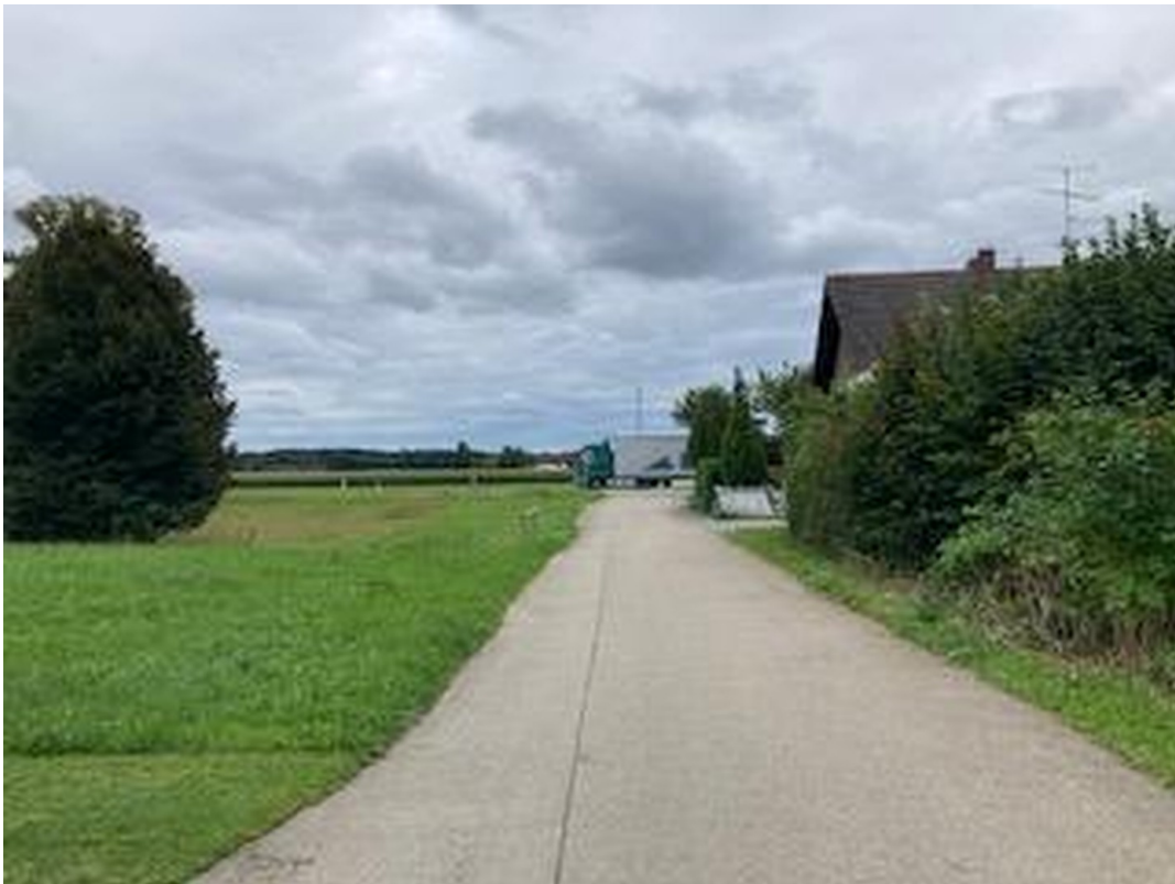
Süden - Anliegerstraße zur B12