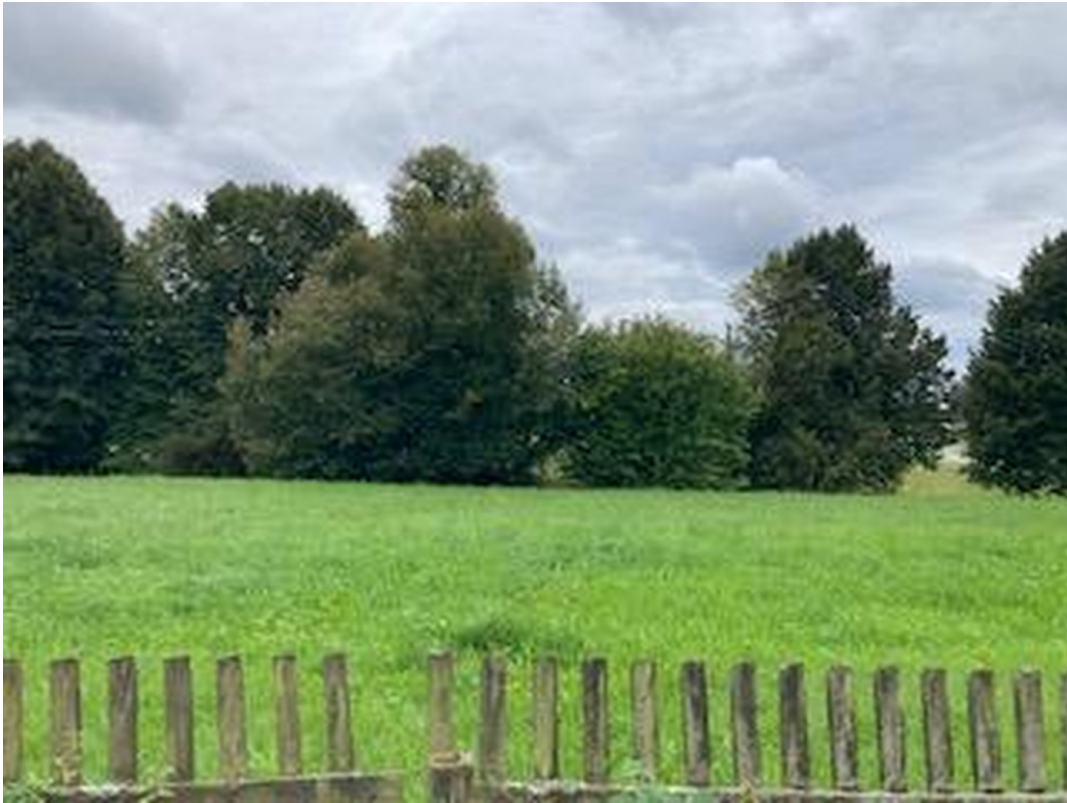
Süden - Wiese - Blick zur B12