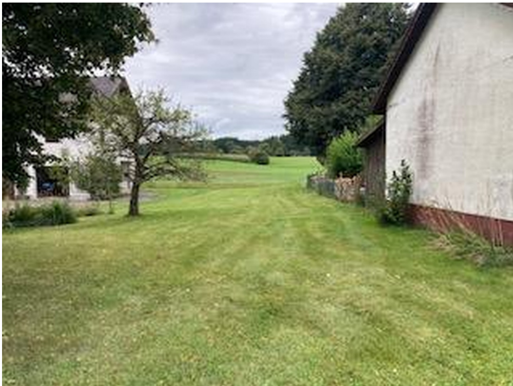
Norden - Blick auf Felder