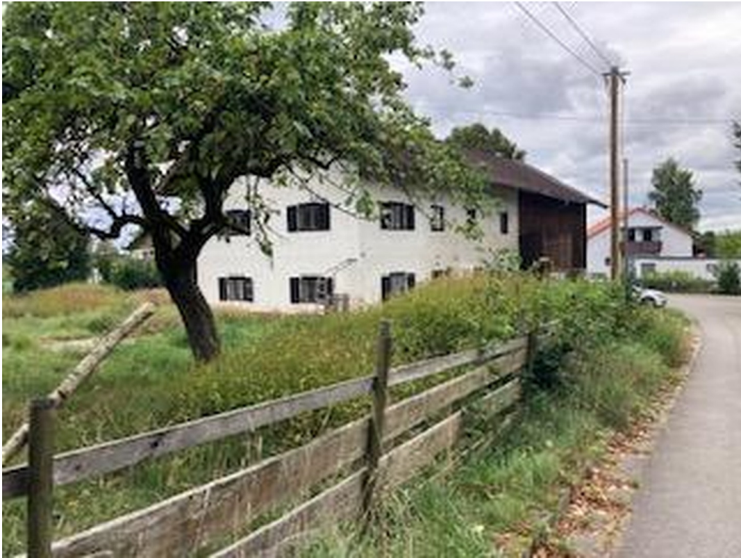
Osten - Bestehendes Gebäude