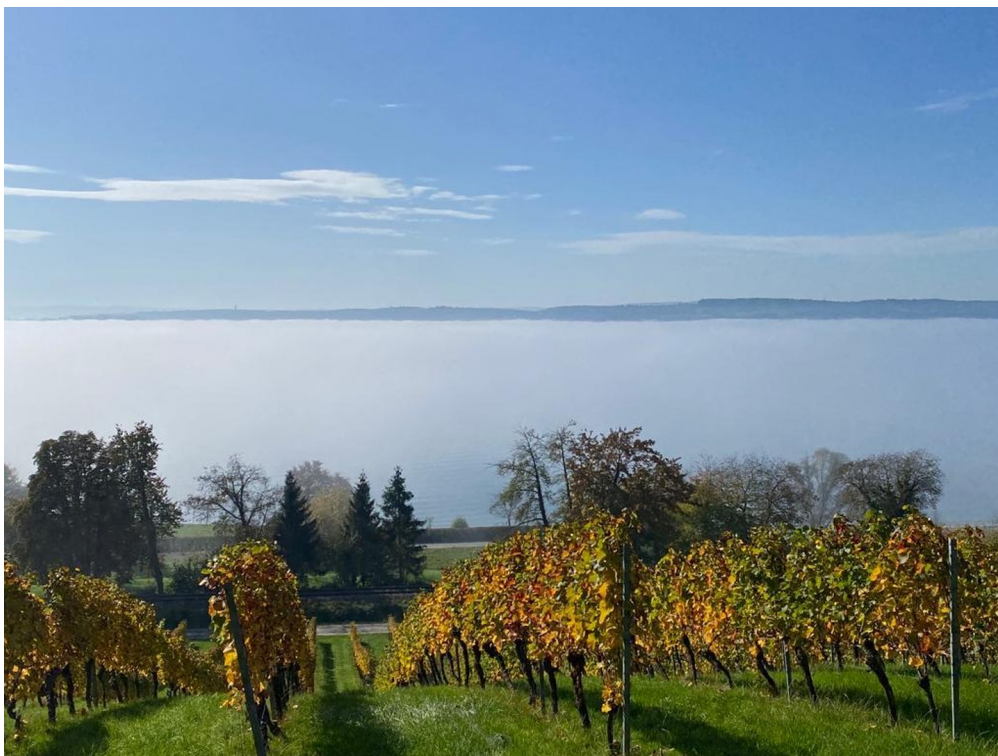
Herbststimmung am See