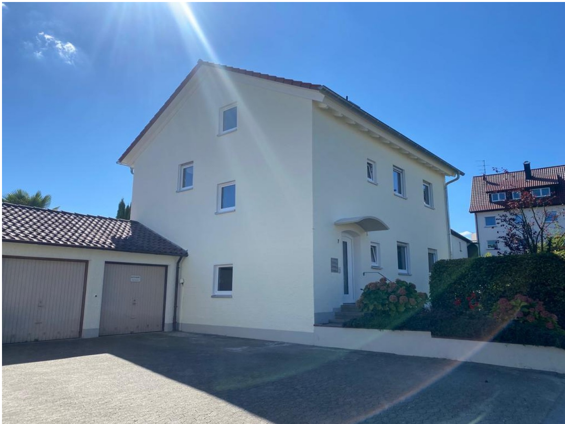
Wohnhaus Ansicht Eingang