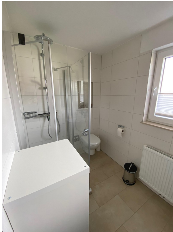
Badezimmer Duschkabine und WC