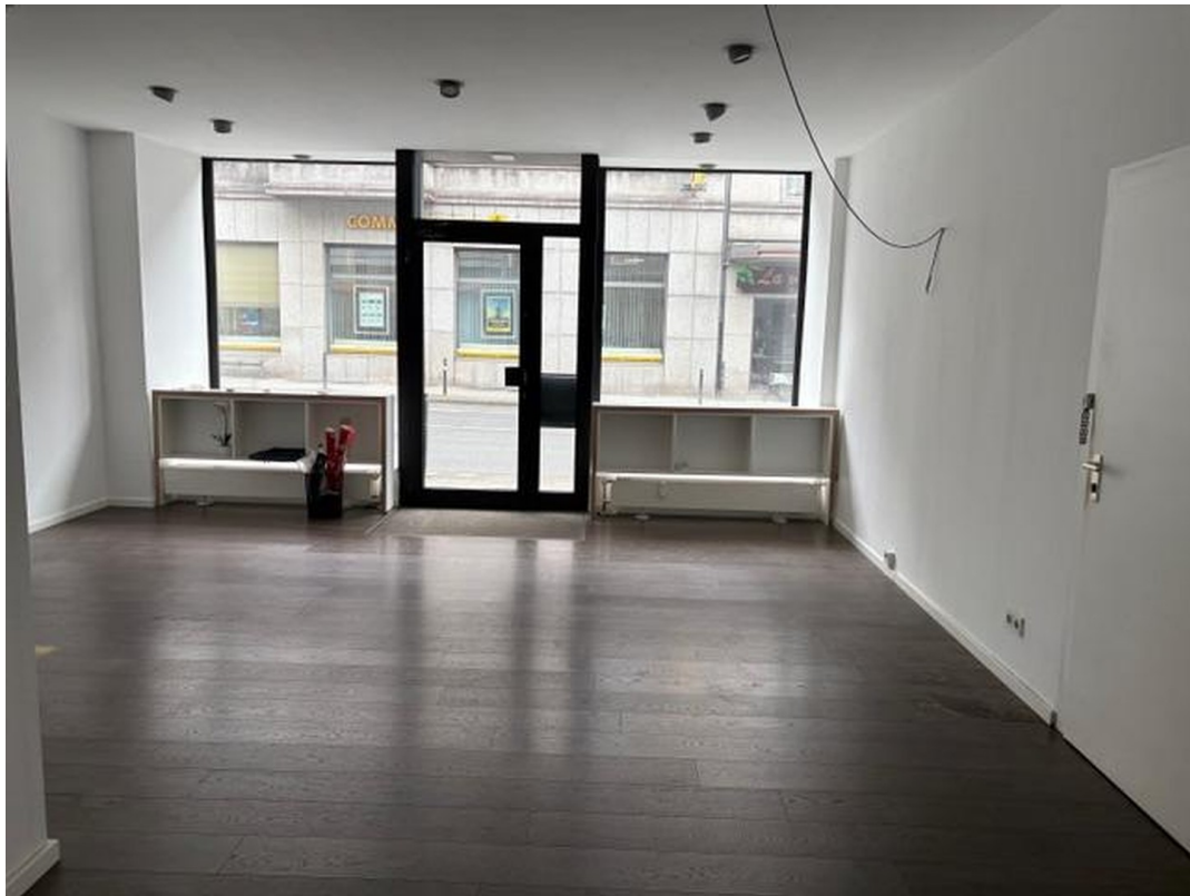
Ladenlokal Foto 2