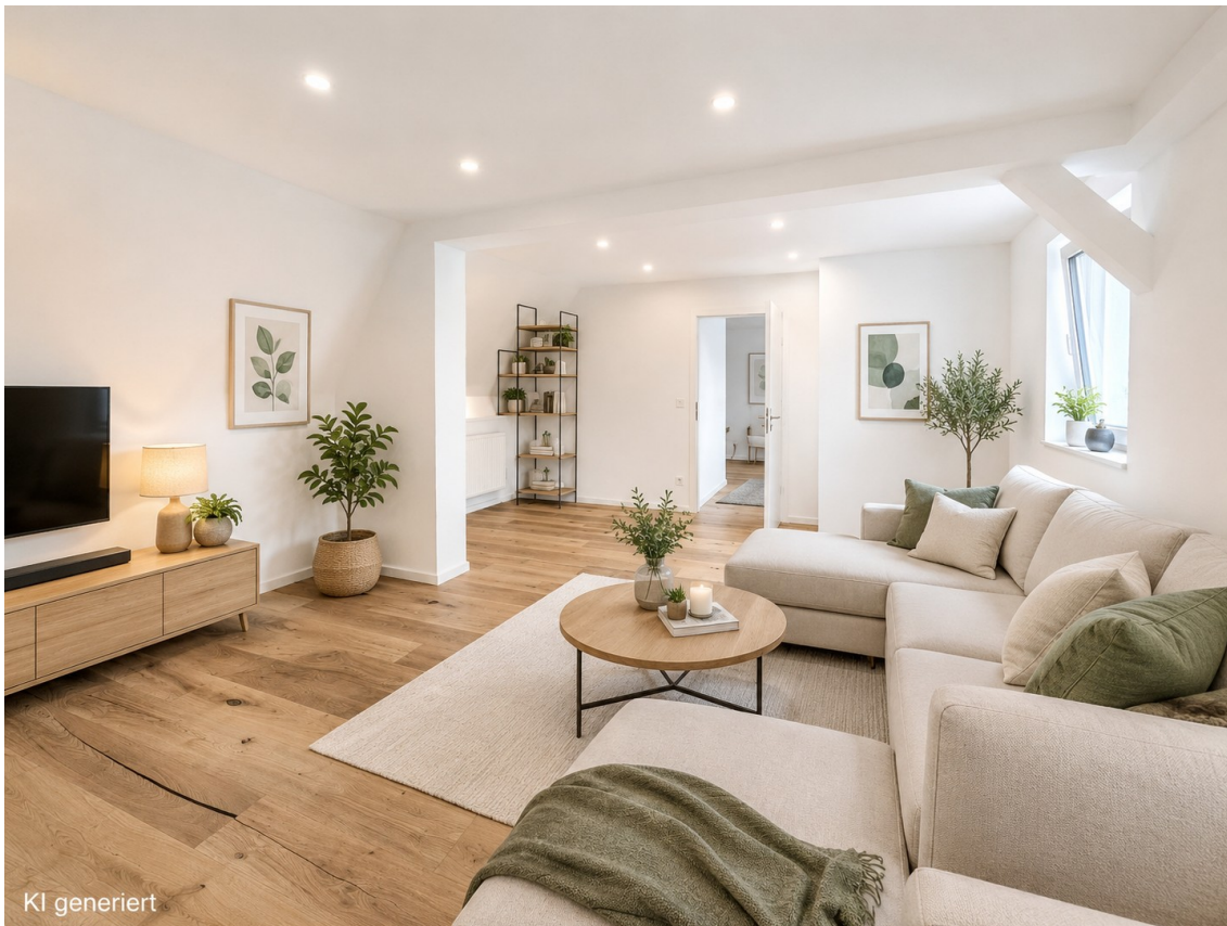
Wohnen KI generiert