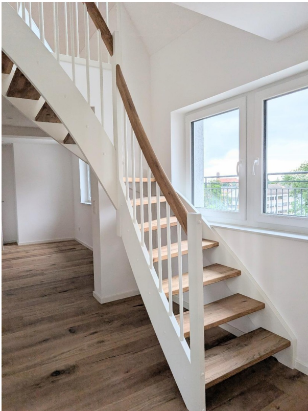
Treppe zur Ebene 2