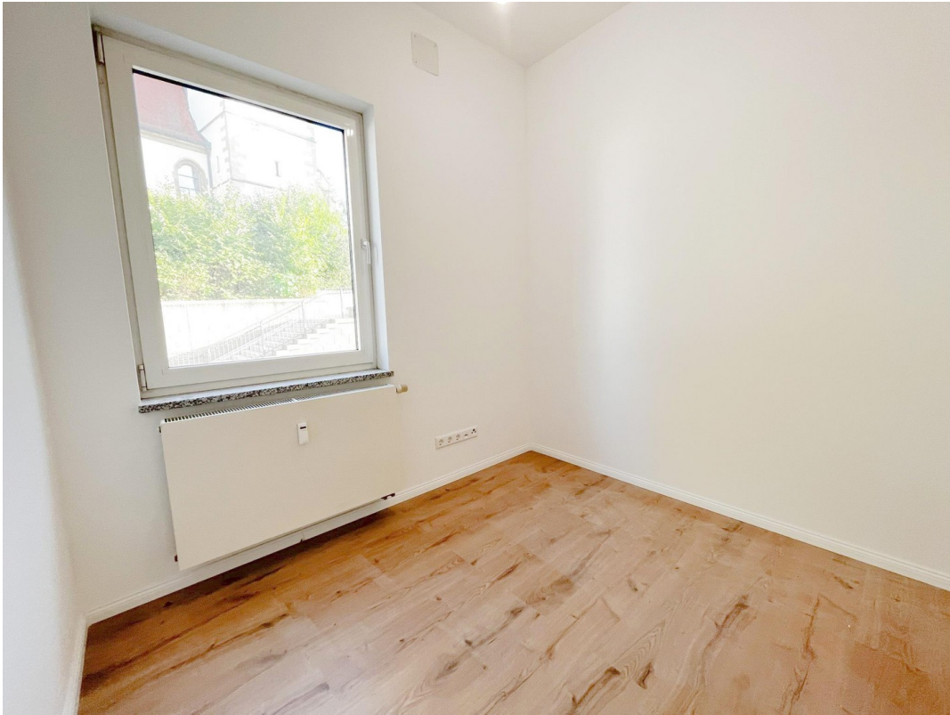
Helles Zimmer mit Fenster