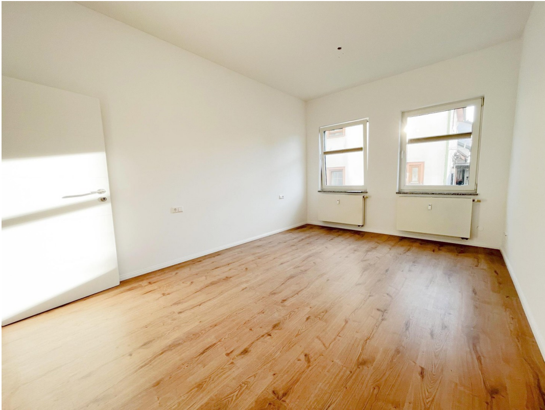
Helles Zimmer mit zwei Fenster