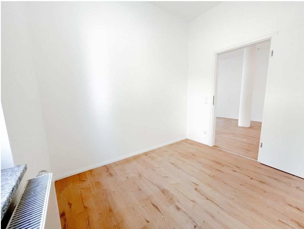
Zimmer mit Abstellraum-Nische