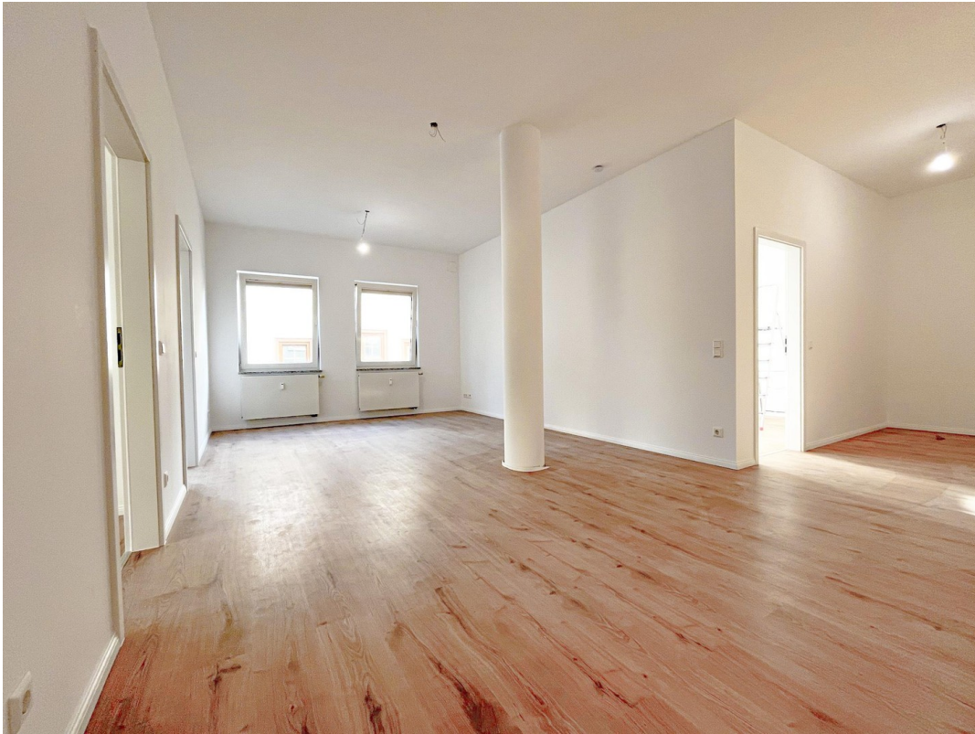
Wohn-/Essbereich, weitere Ansicht