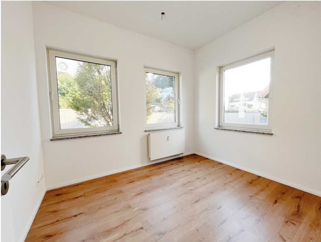
Zimmer mit Eckfenstern