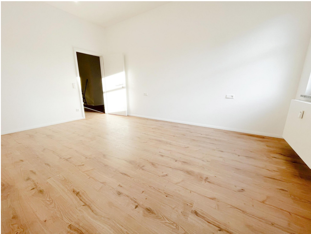
Zimmer - ideal als Schlaf- ode