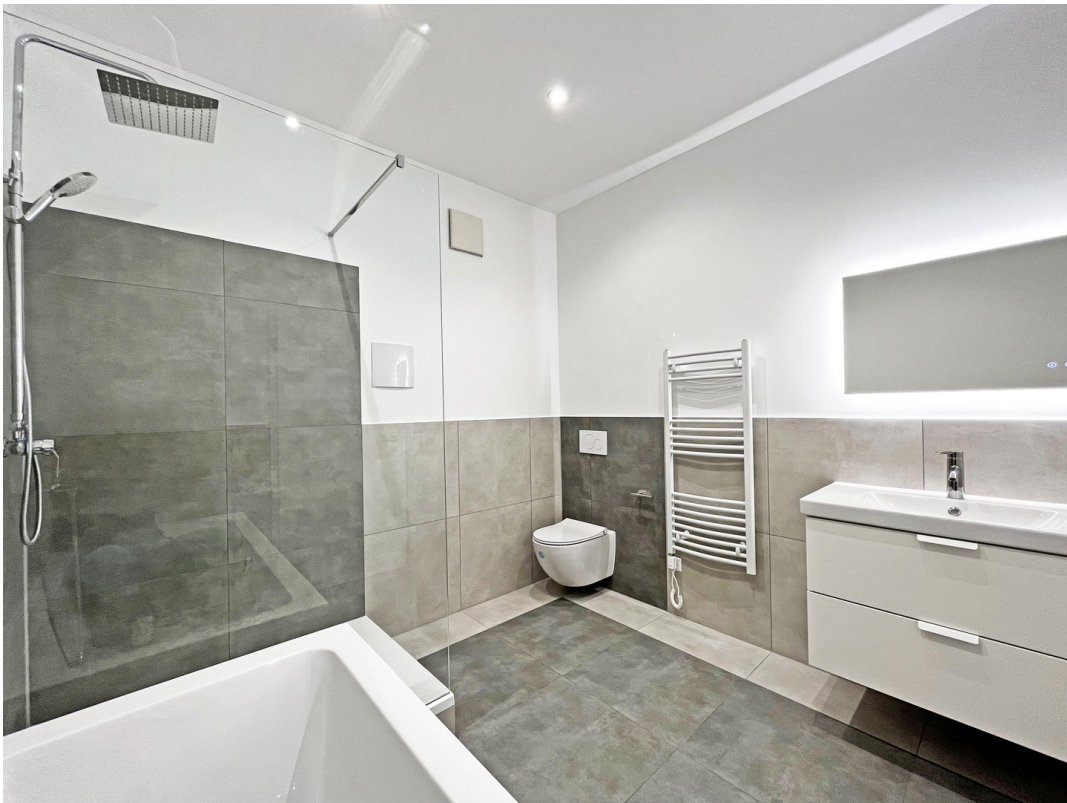
Hochwertiges Wellness-Bad mit