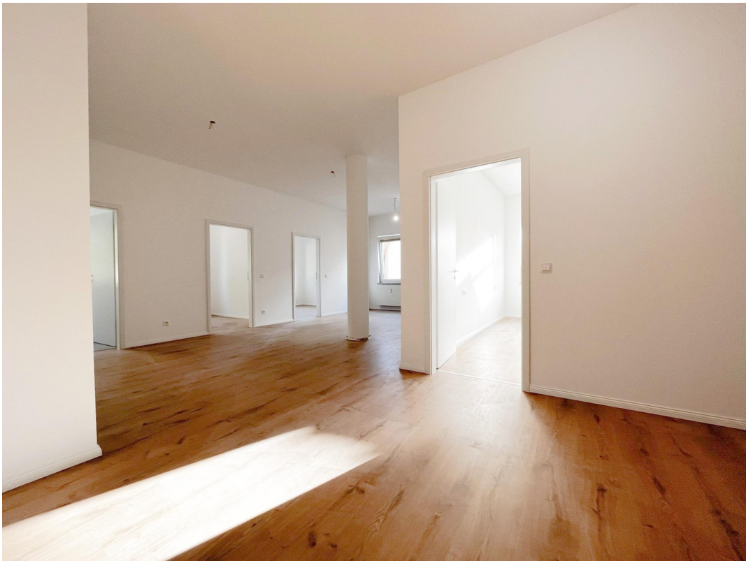
Wohnbereich mit Blick zur Diele