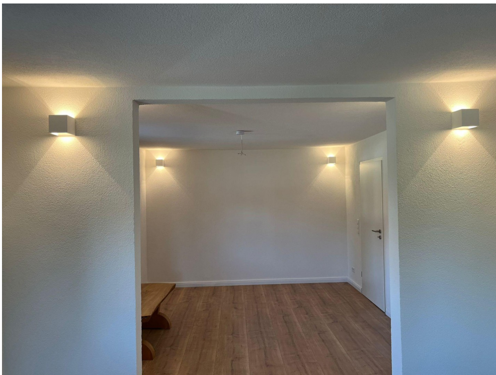
Wohn- / Esszimmer