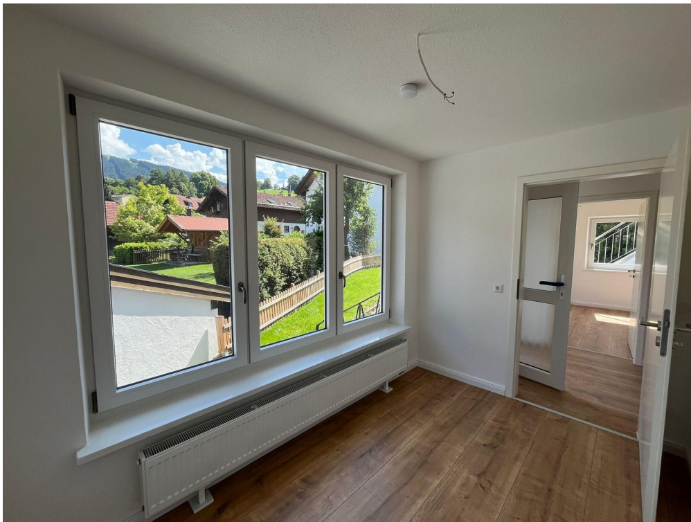
Kinderzimmer 2 oder Büro