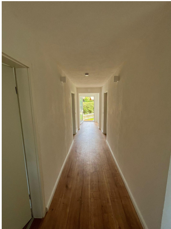
Flur Richtung Ausgang