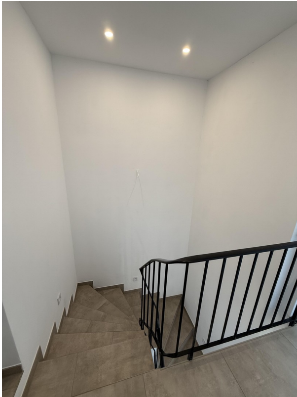
Treppenabgang 1. OG