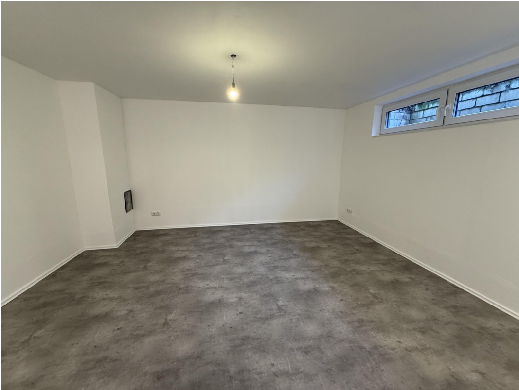
Arbeitszimmer / Hobbyraum