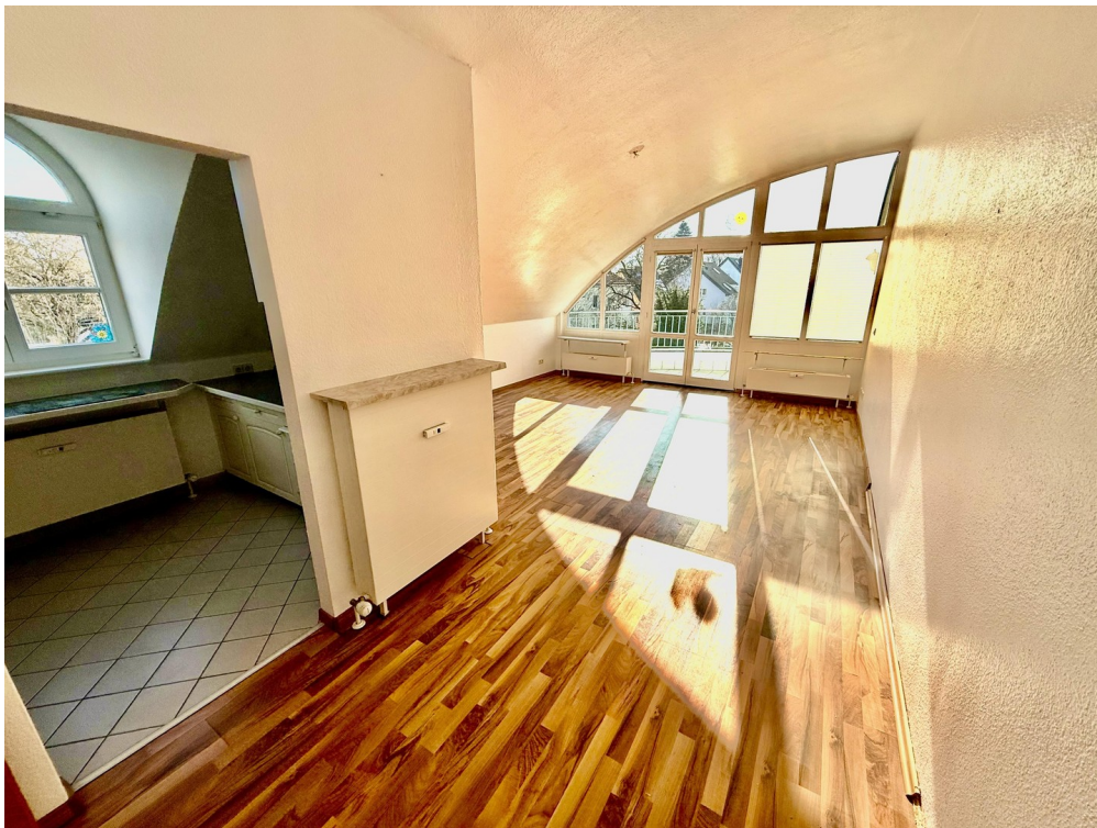
Wohnraum in einer Wohnung