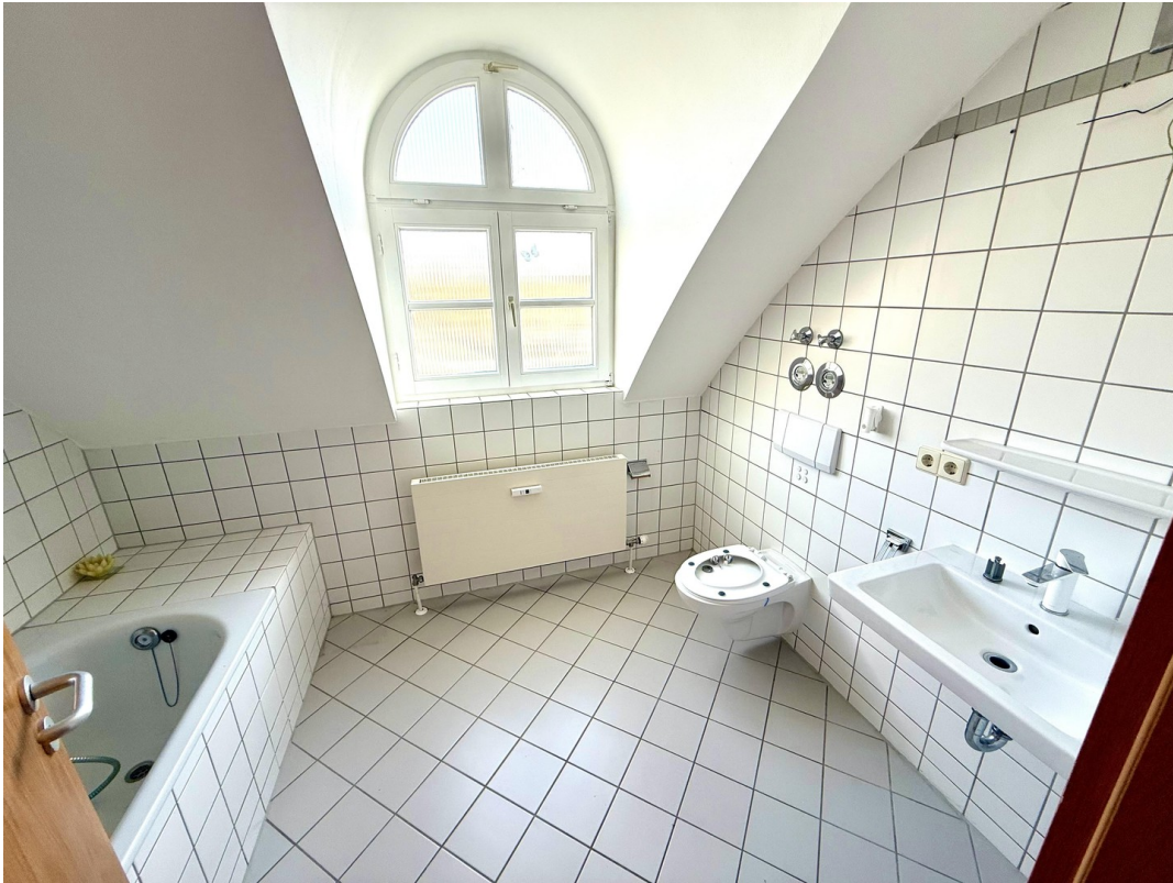
Bad in einer Wohnung