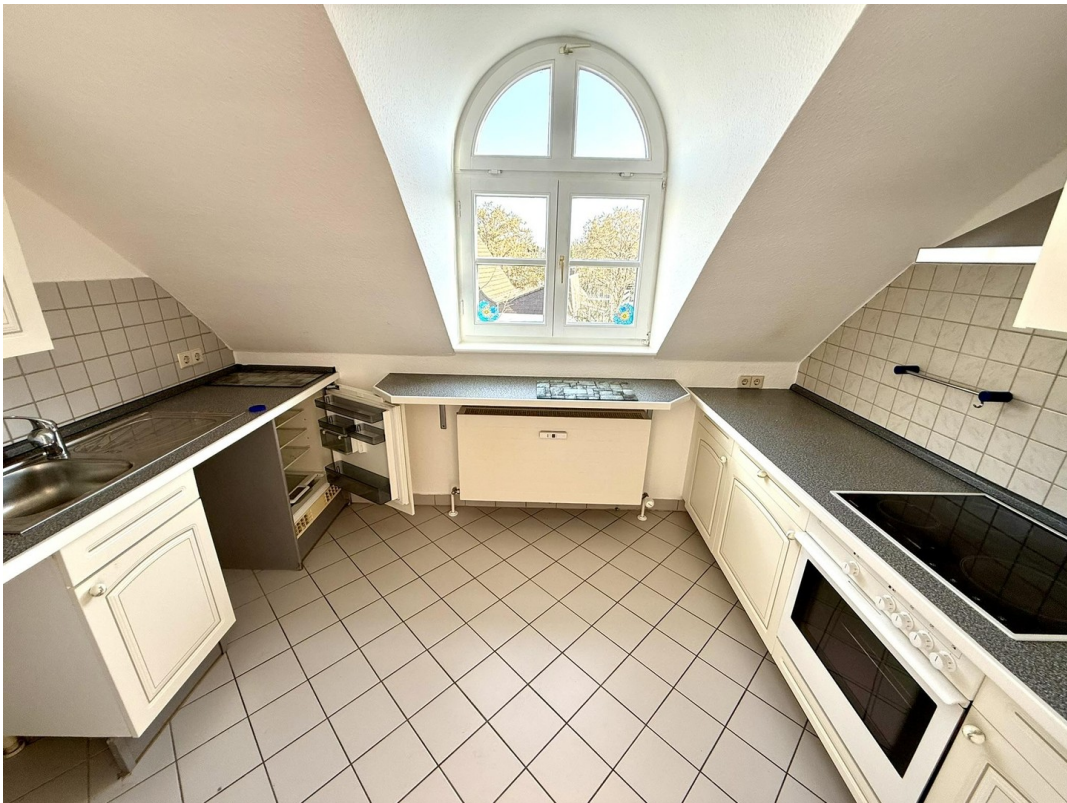
Küche in einer Wohnung