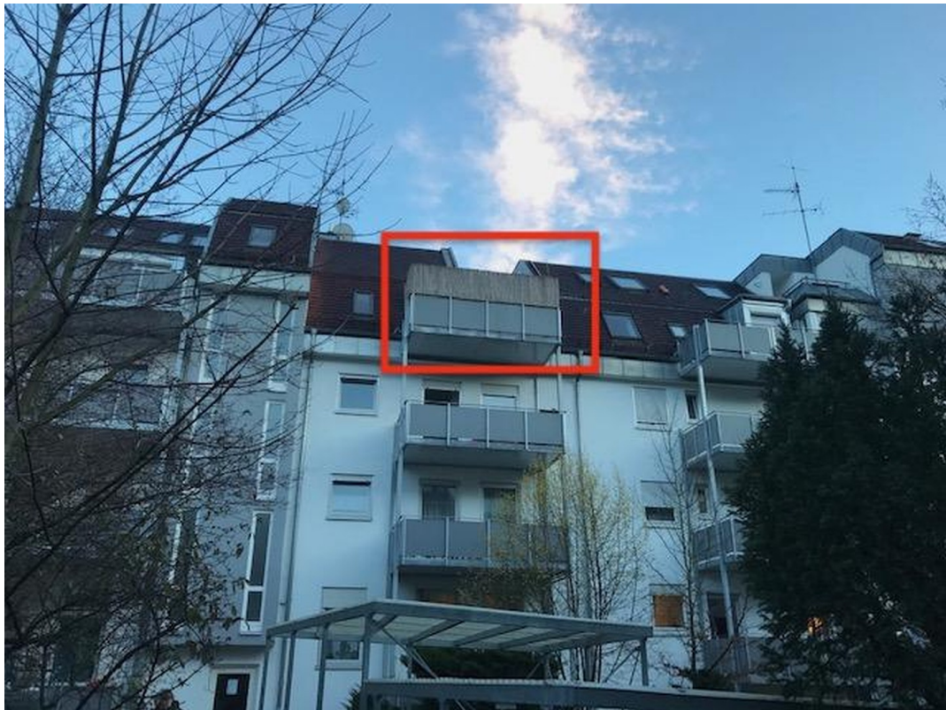
Haus Ansicht Innenhof