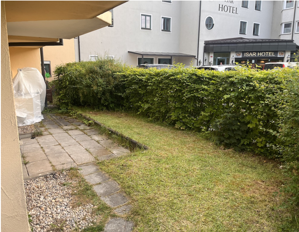
Die Terrasse (2/2)