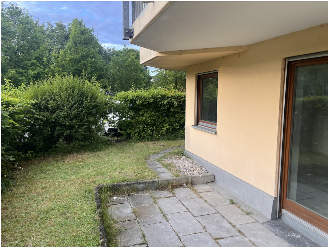
Die Terrasse (1/2)