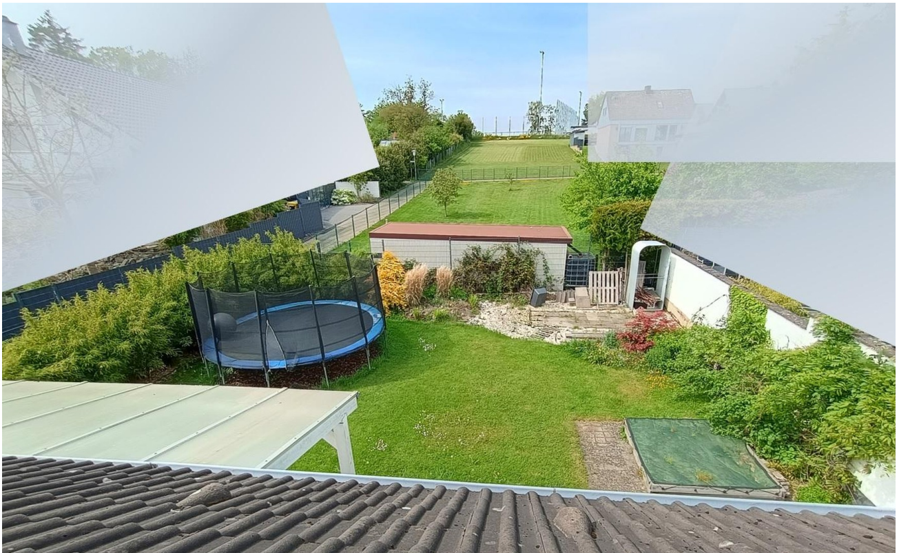
Blick Garten von oben