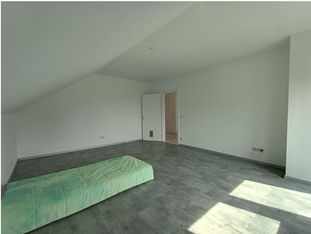
2. Schlafzimmer OG