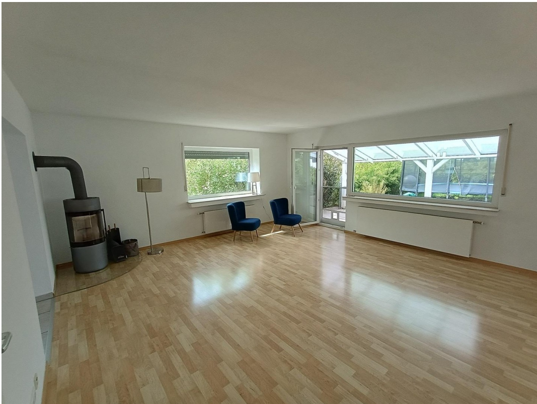
Wohnzimmer / Esszimmer