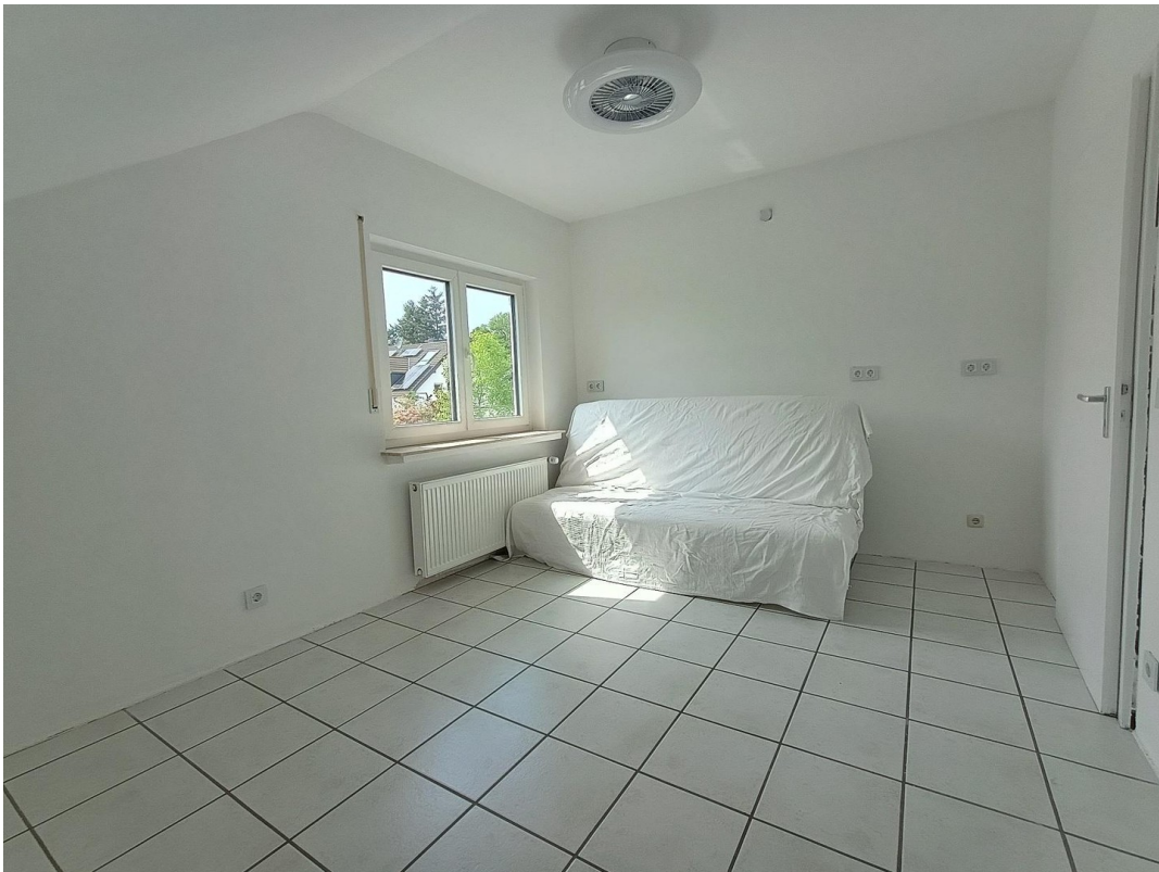
1. Büro / Schlafzimmer OG