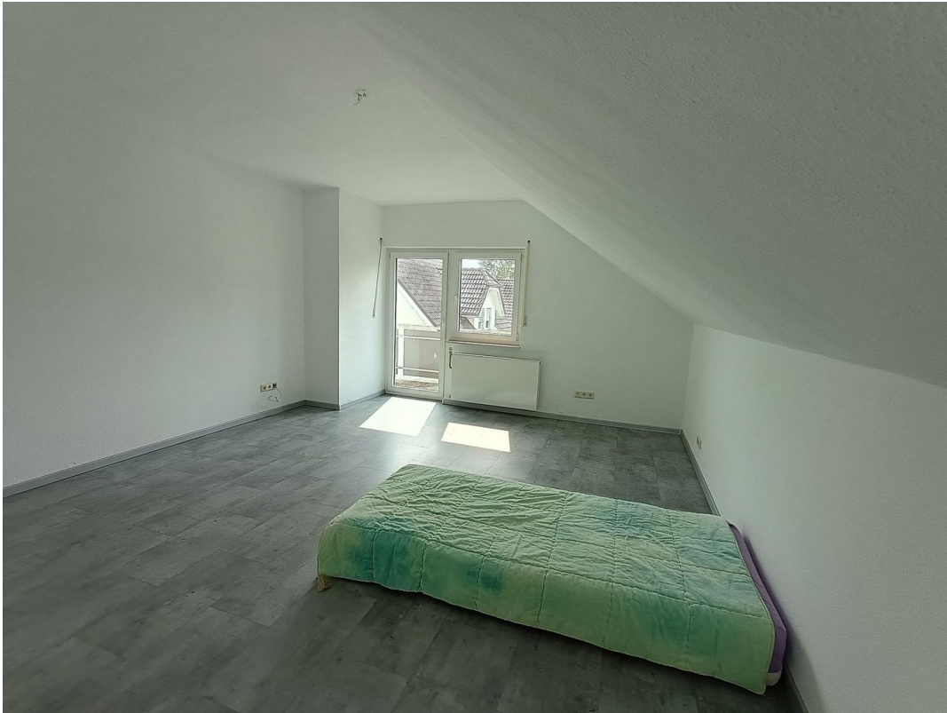
2. Schlafzimmer OG mit Balkon