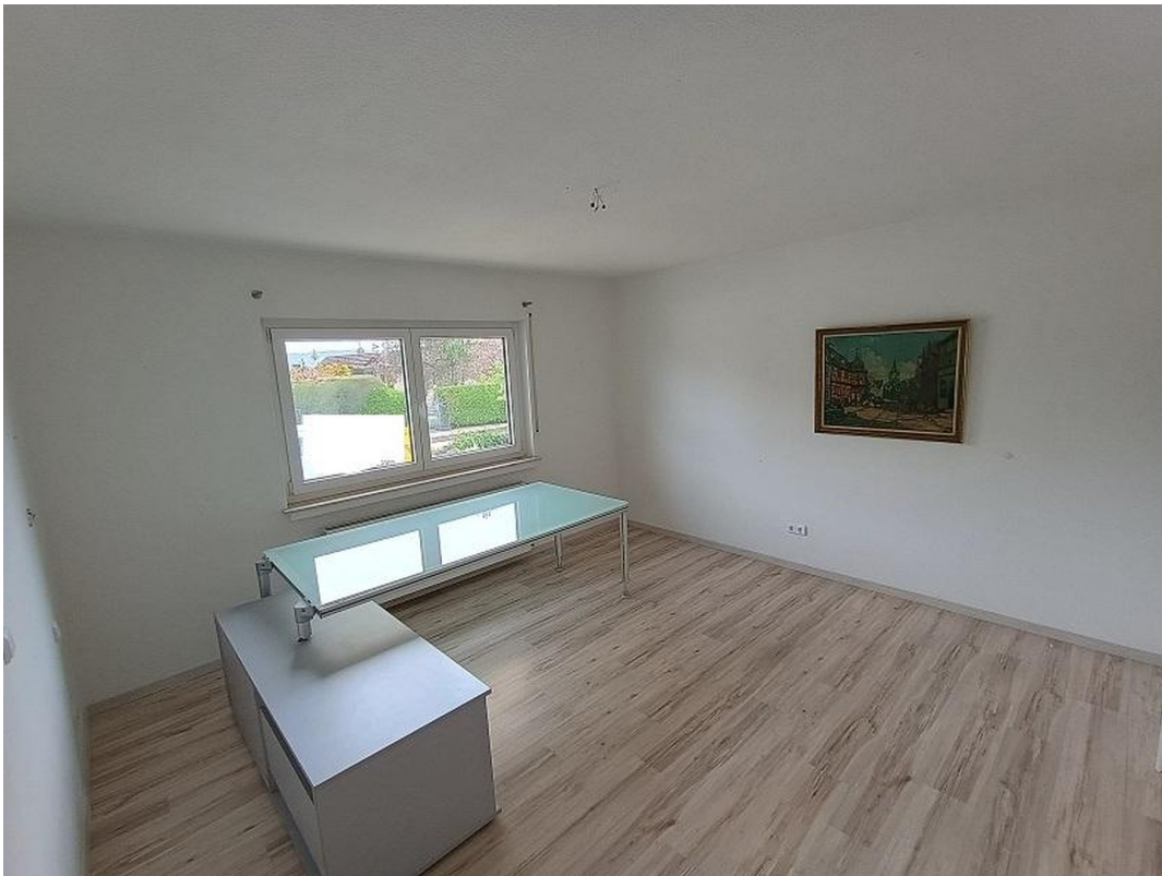
Büro / Schlafzimmer EG