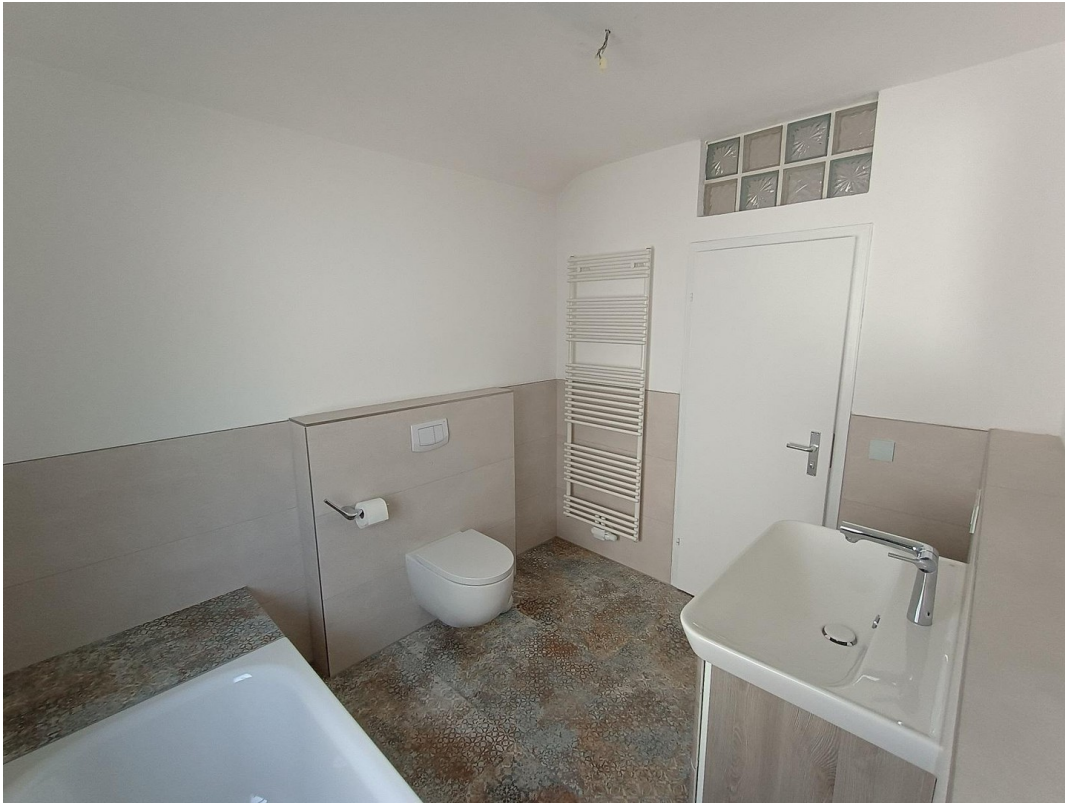
Wannenbad OG b