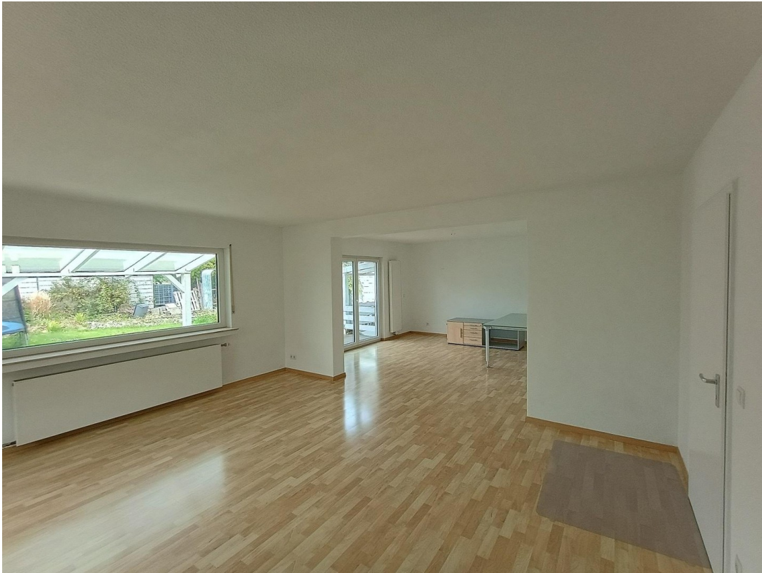
Esszimmer / Wohnzimmer