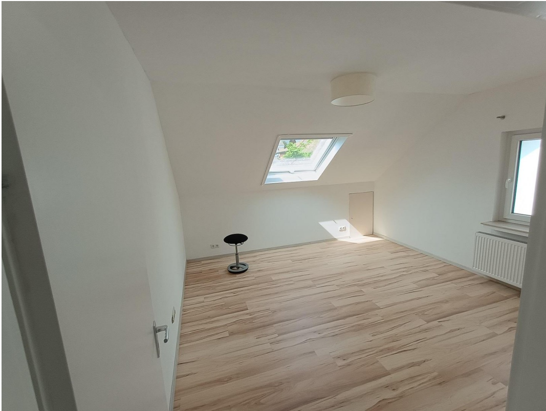
3. Büro / Schlafzimmer OG