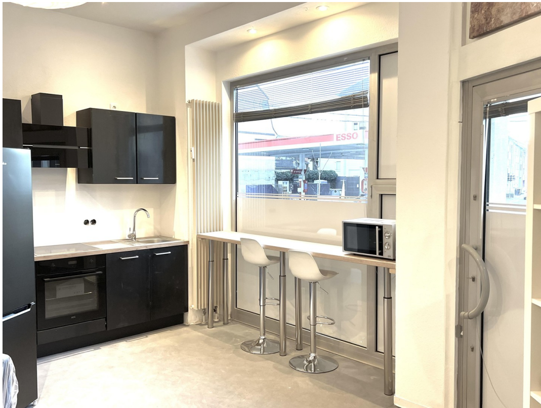
Küche mit Theke