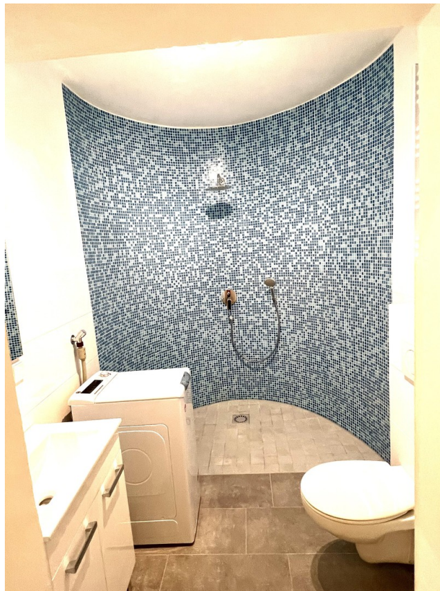
Bad, Dusche und Waschmaschine