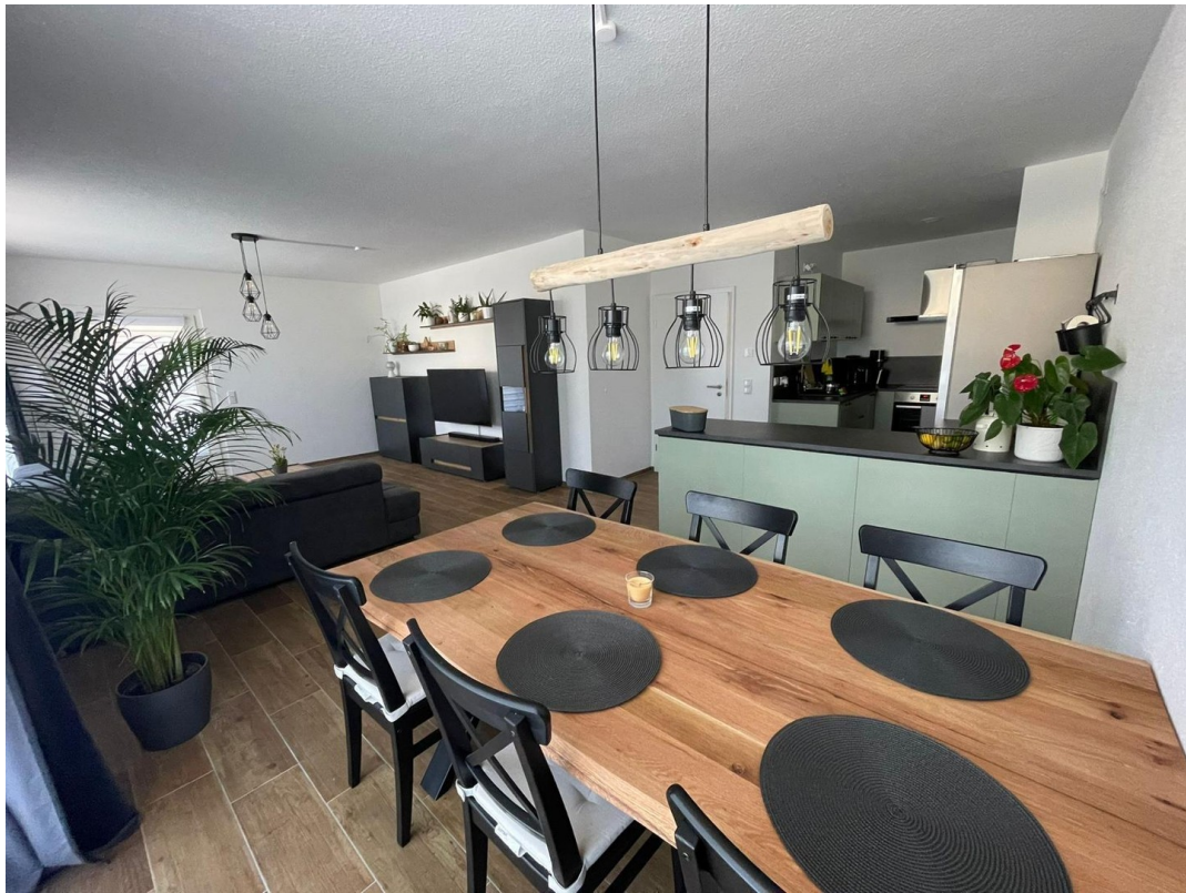
Esszimmer und Küche