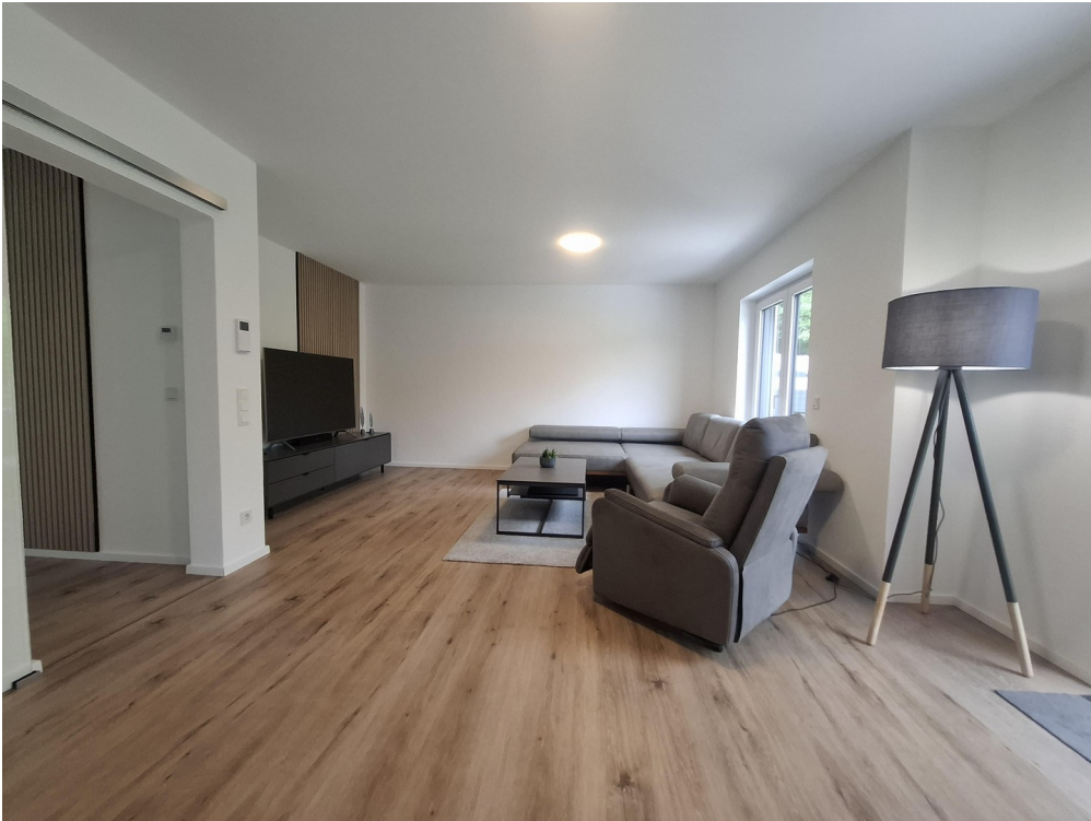
Wohnzimmer im Glasschiebetür