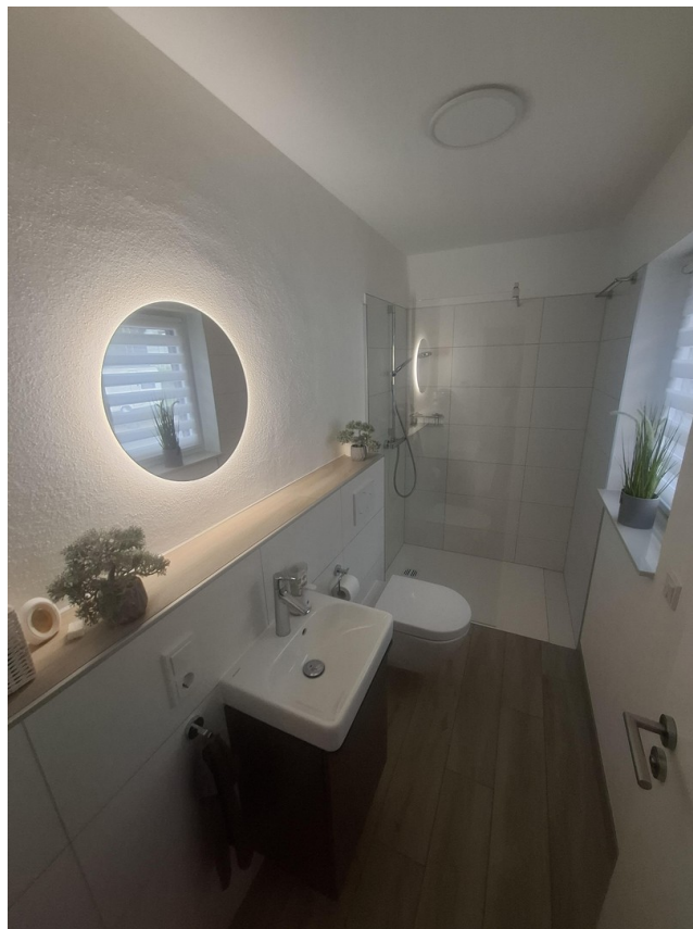
Gäste-WC mit Dusche