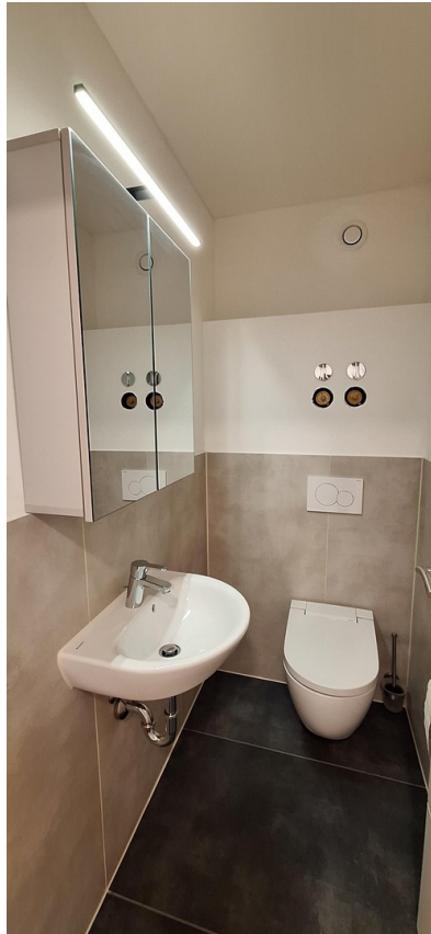
Separates Gäste WC