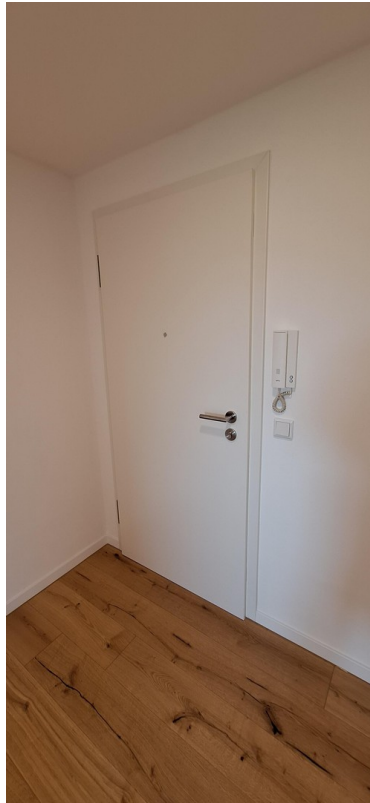
Eingang mit RC-Sicherheitstüre