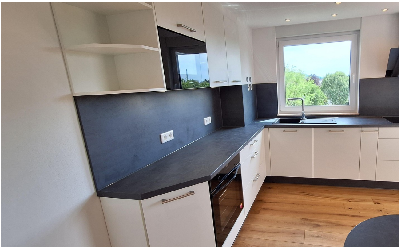
Küche mit BSH Geräten