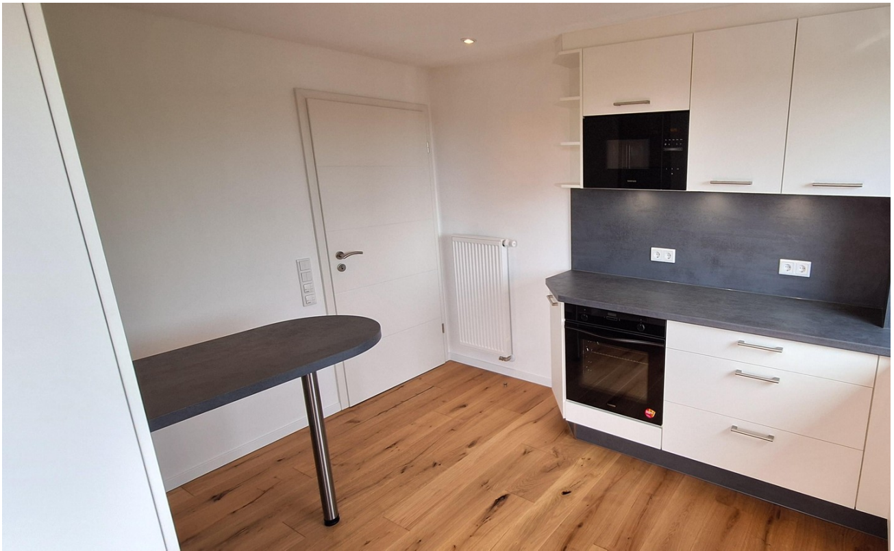
Küche Backofen und Mikrowelle