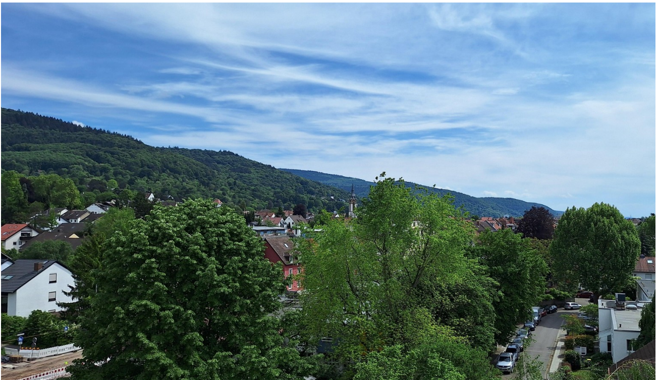
Blick ins grüne Handschuhshaus