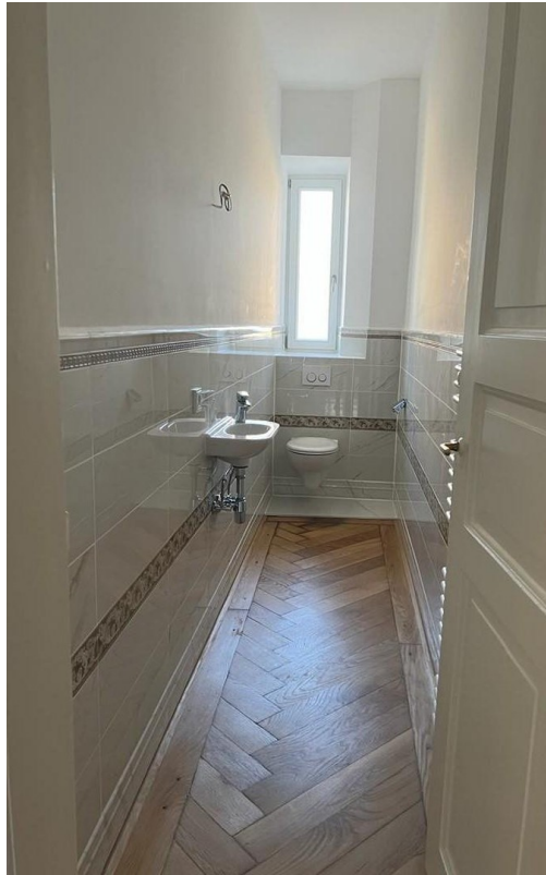
seperates WC Ansicht 1