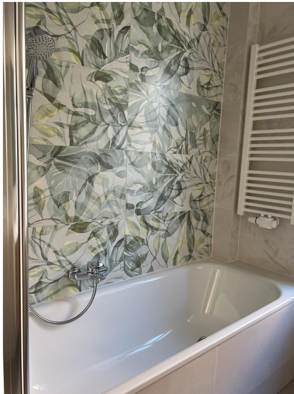
Bad Ansicht 2