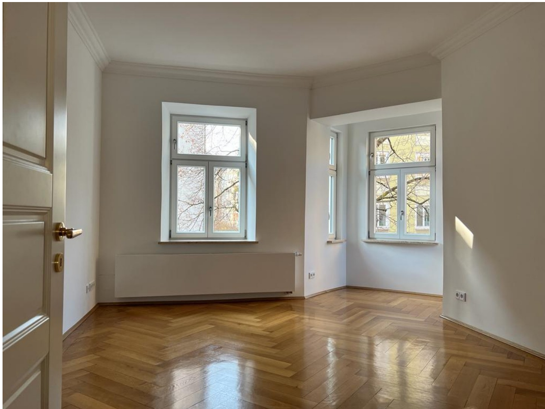
Wohnzimmer mit Erker