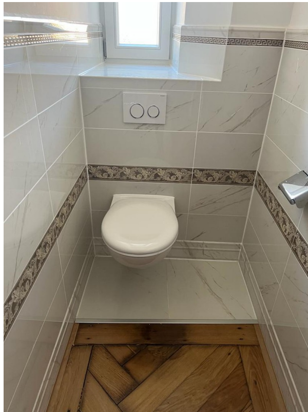
seperates WC Ansicht 2