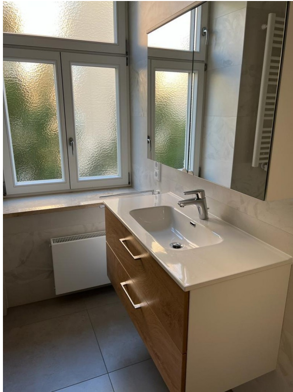
Bad Ansicht 1