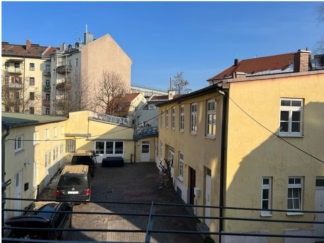
Aussicht Balkon zum Innenhof