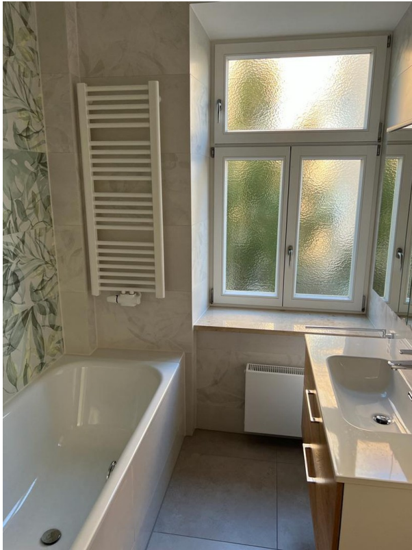
Bad Ansicht 3