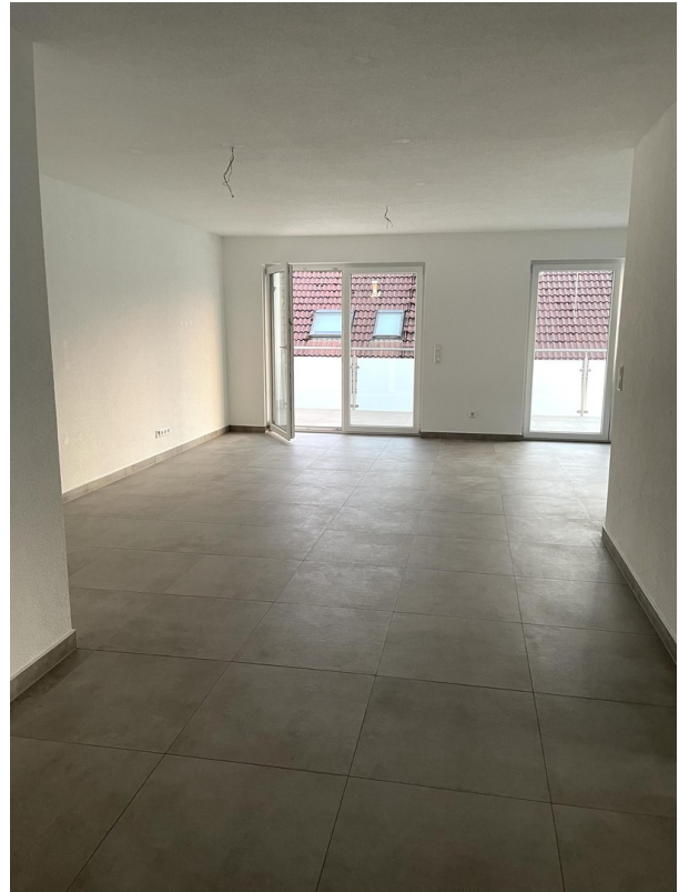
Blick Richtung Esszimmer