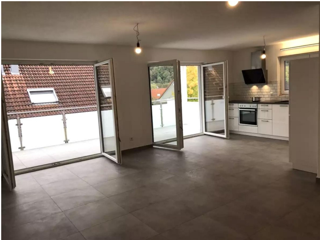
Blick Richtung Balkon/Küche