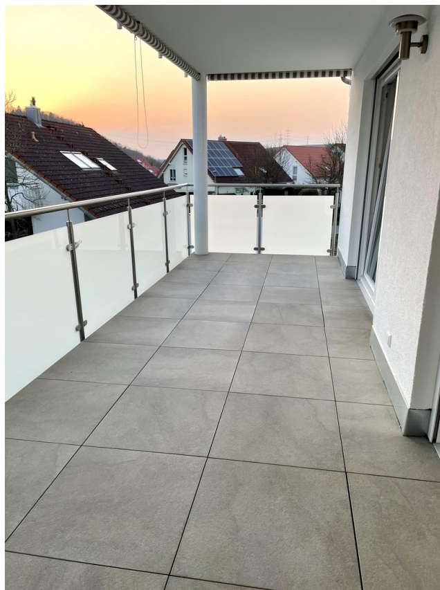
Balkon Foto 2