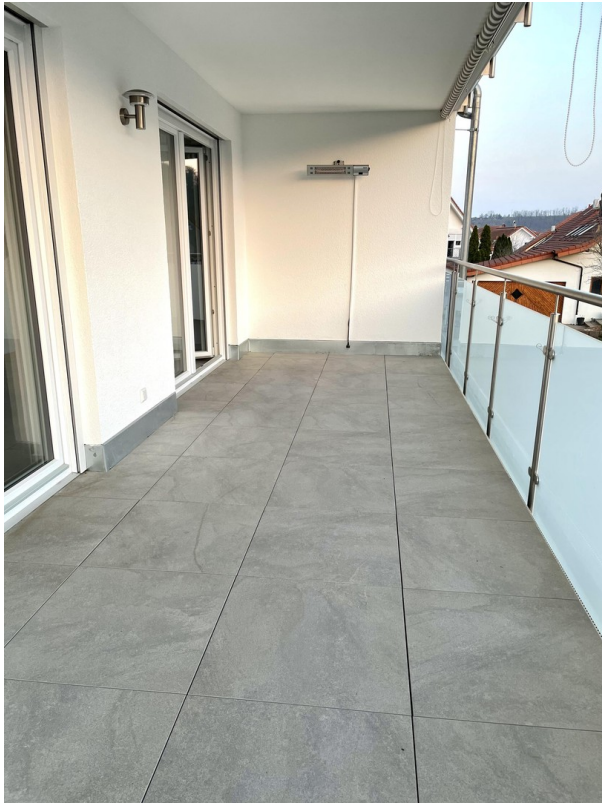
Balkon Foto 1