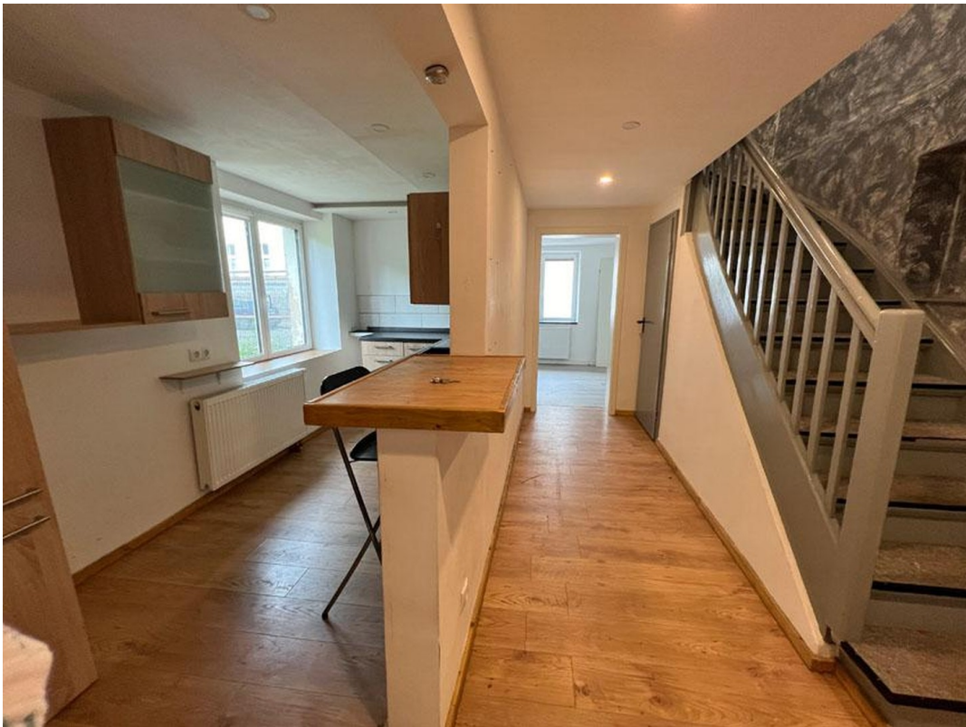
EG-Küche, Treppenaufgang ins OG