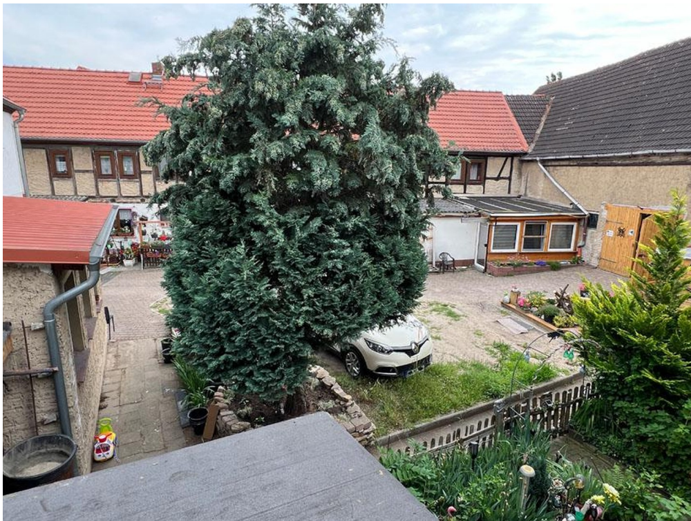
Blick Innenhof von Balkon