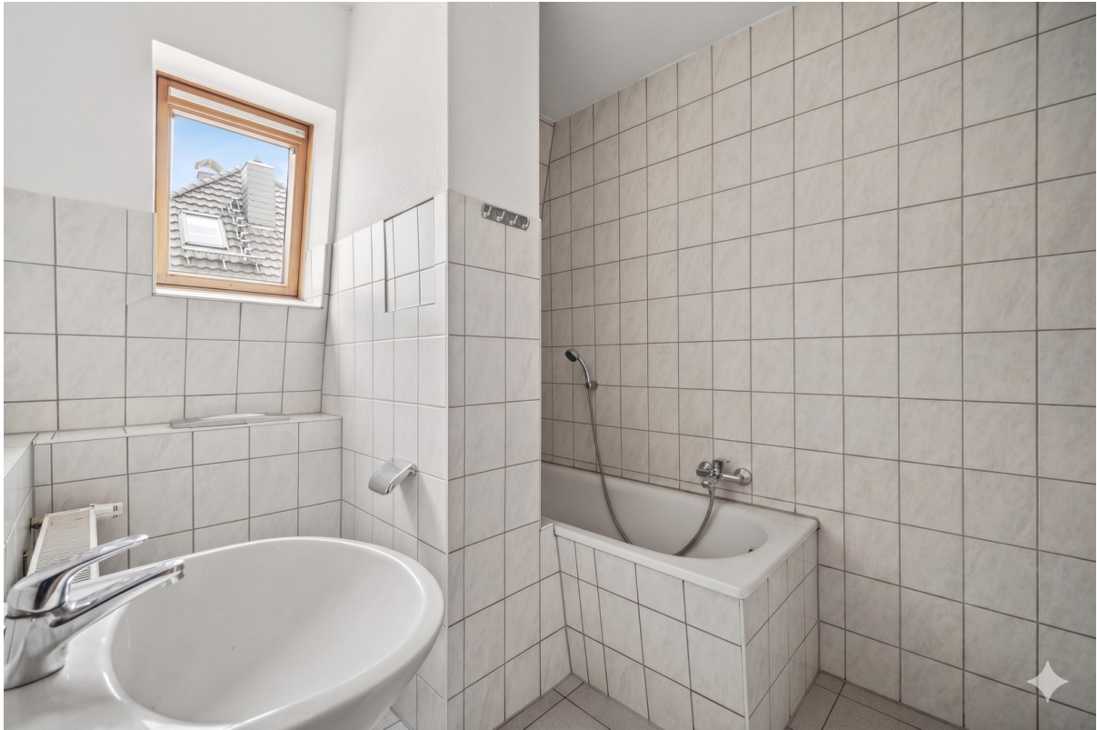
Bad und WC