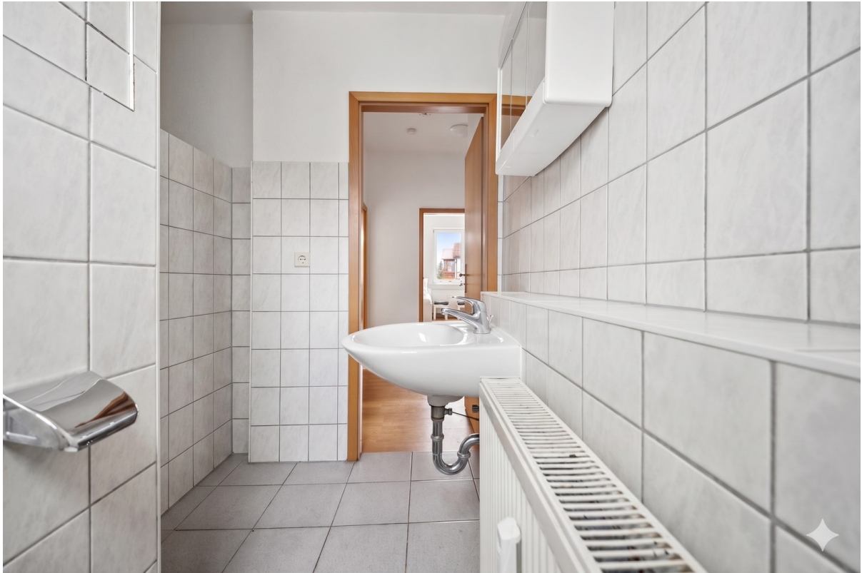
Bad und WC