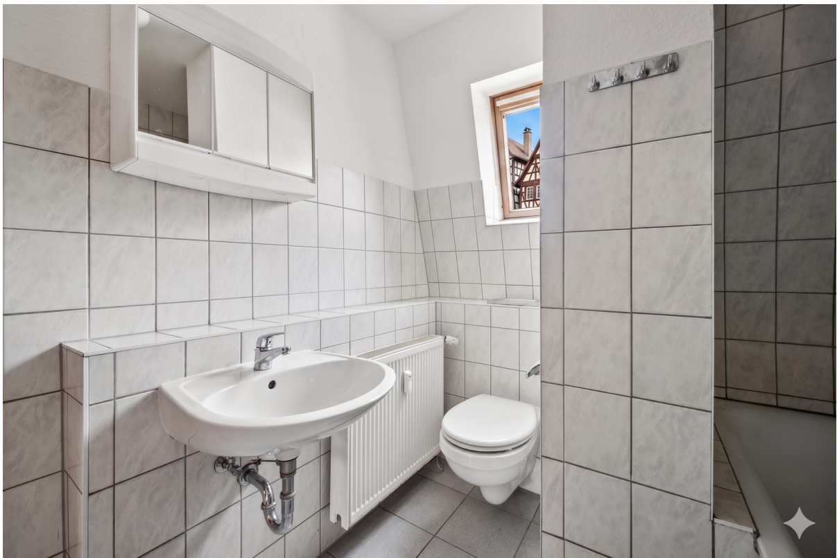
Bad und WC