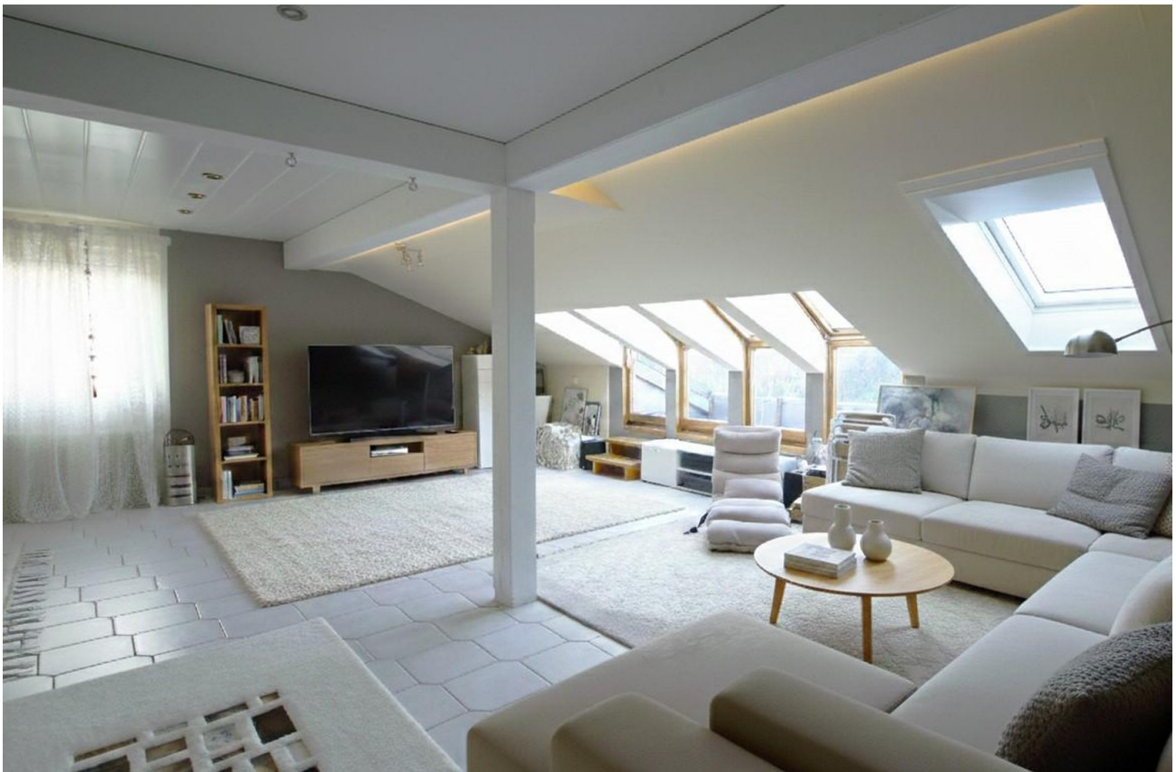
Wohnzimmer mit Dachbalkon