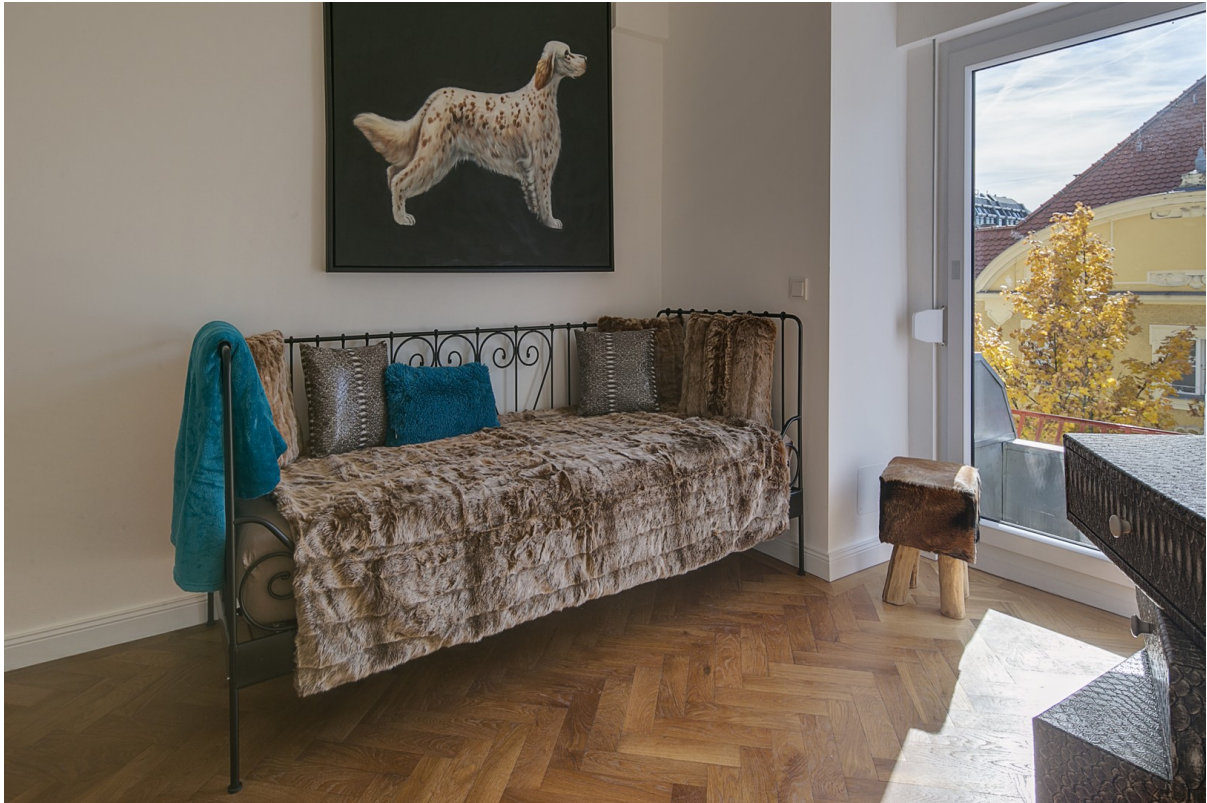
Homeoffice/Gast mit Dachbalkon