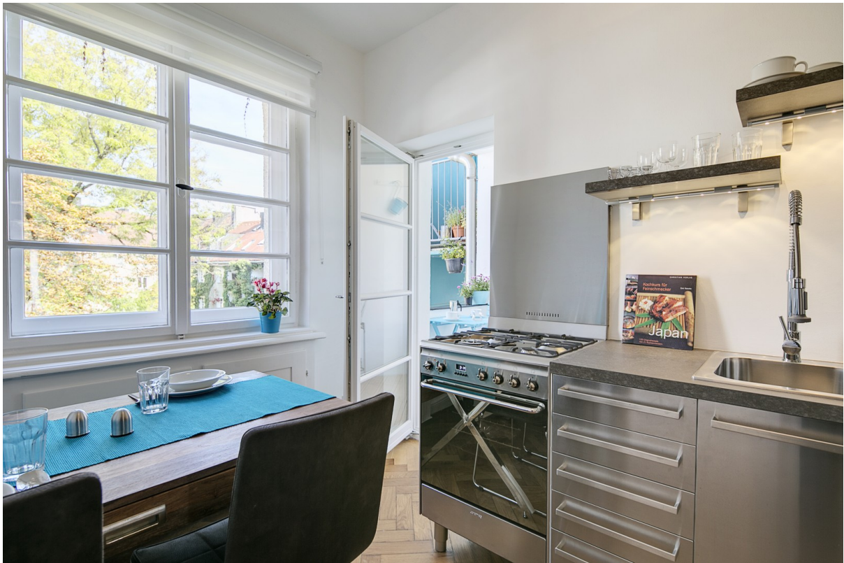
Küche mit Balkonzugang