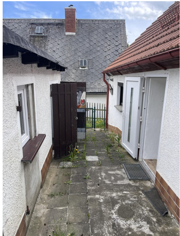
Hauseingang und Werkstatt