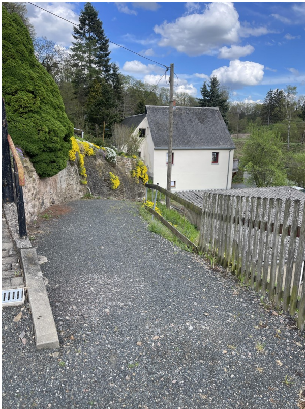
Privatweg zum Haus