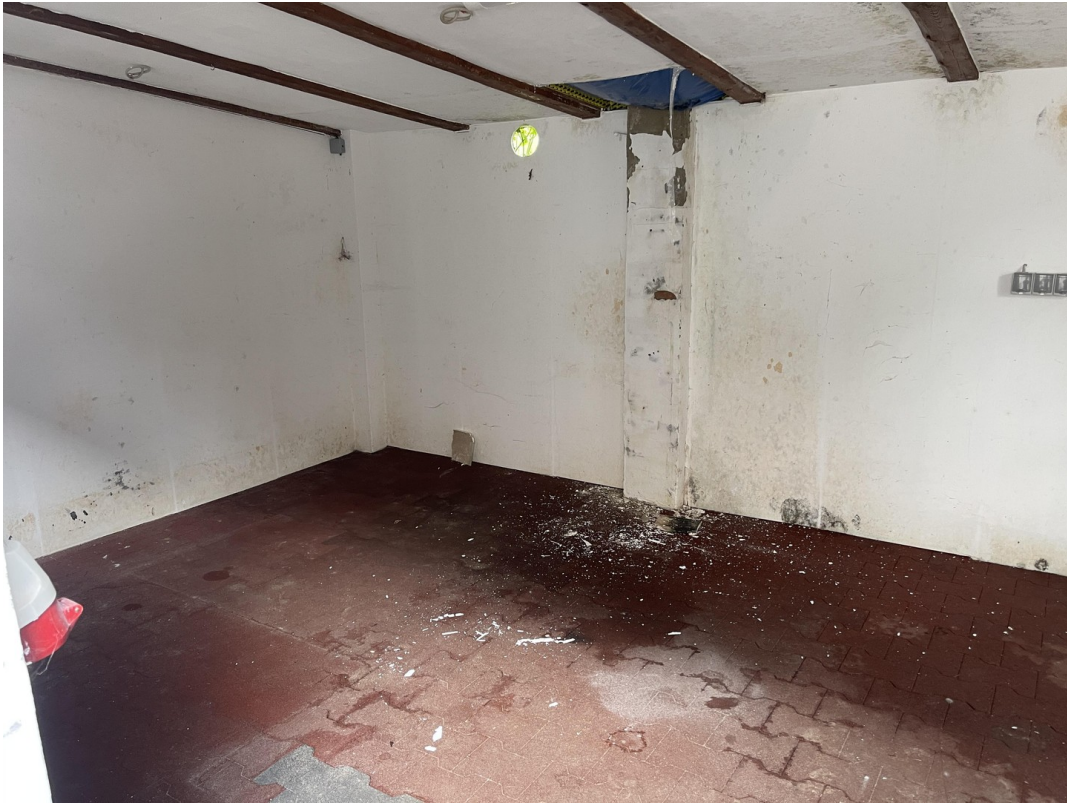
Werkstatt mit Stromanschluss