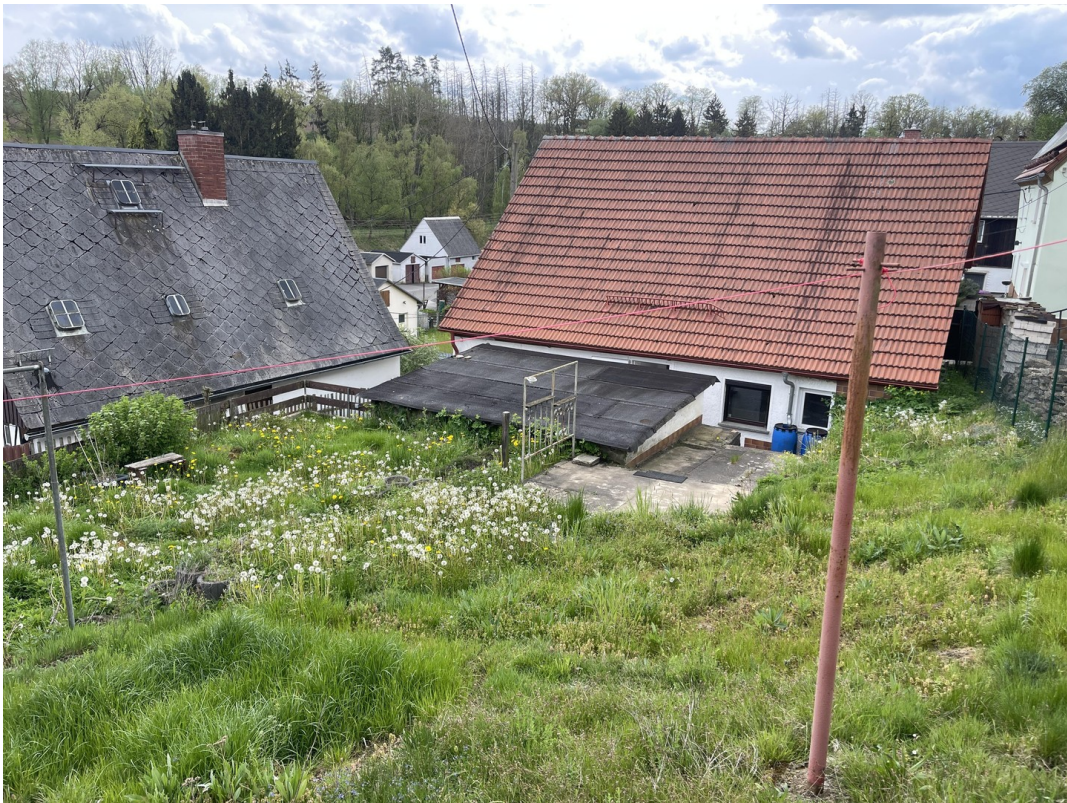
Garten Blick aufs Haus