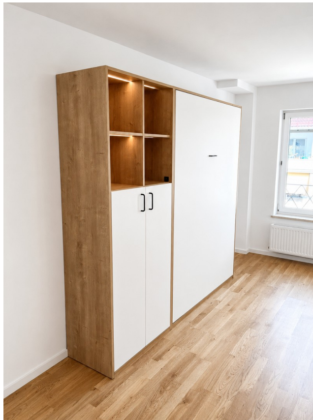
Einbauschranks mit Bett