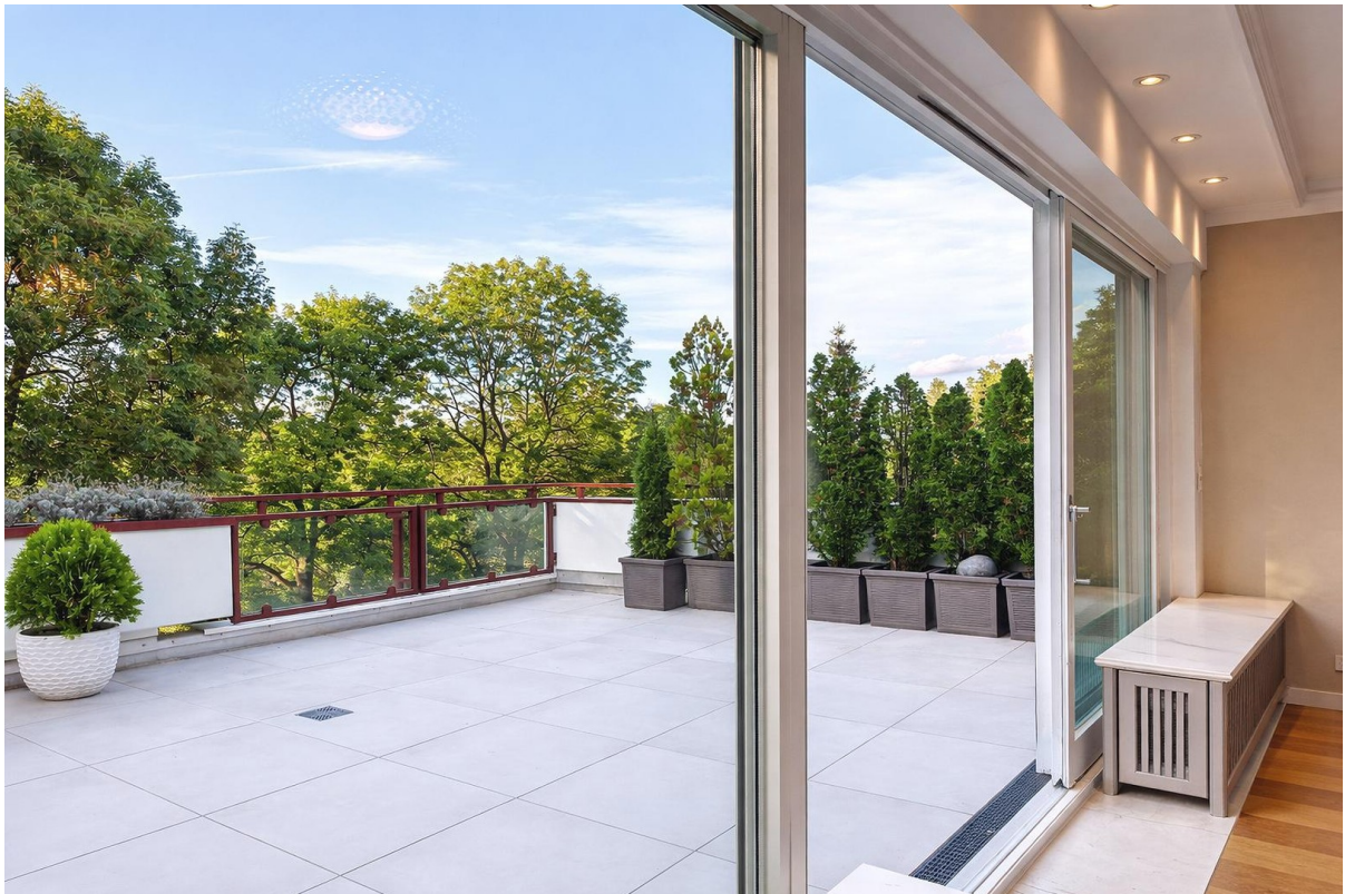
XXL-Fenster ins Grüne