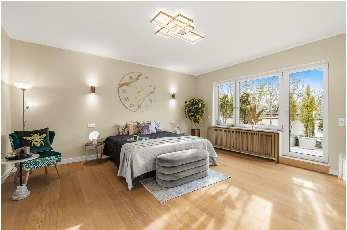
Master-SZ Idee möbliert