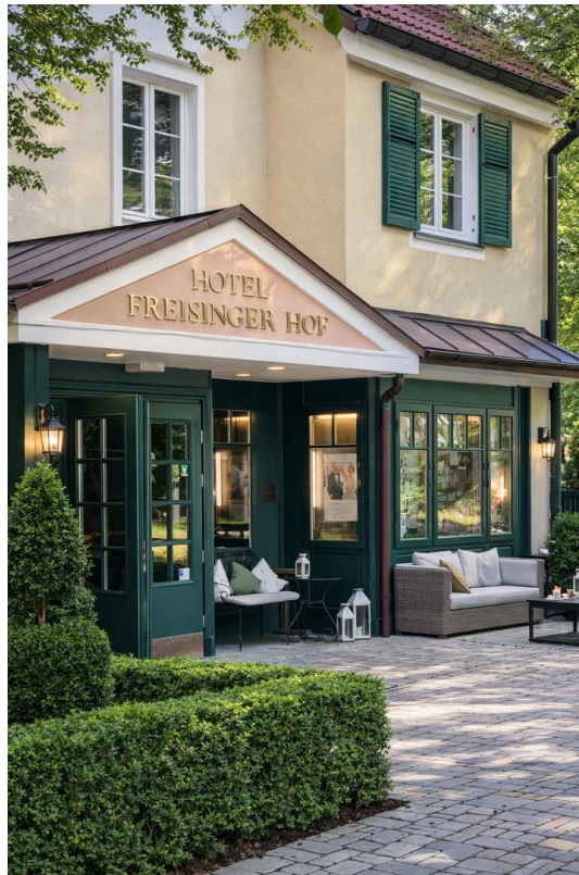
Freisinger Hof in 1min.