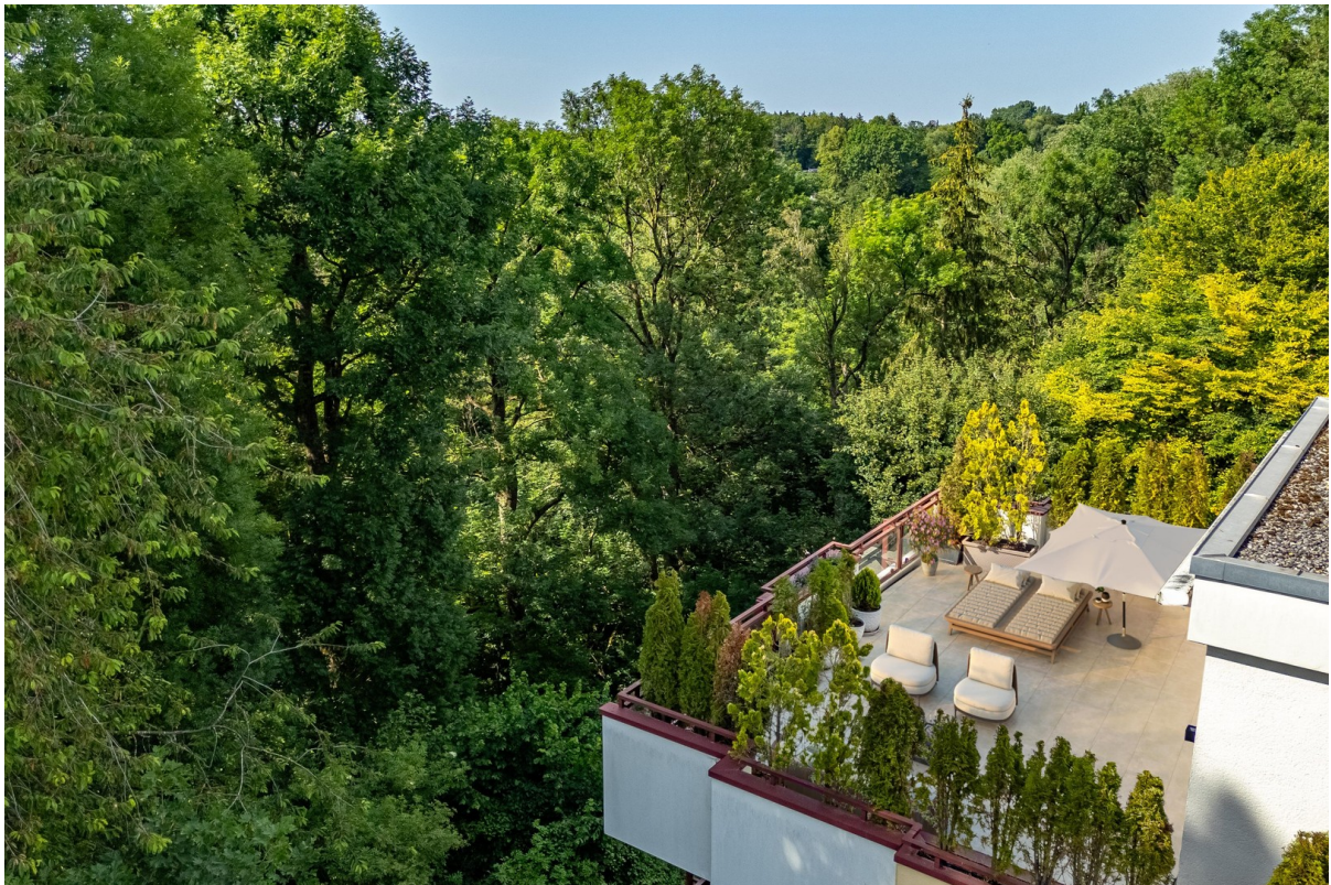
Traum-Parkblick von Terrasse