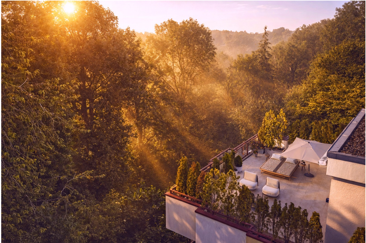
Drohne Terrasse Möblierung