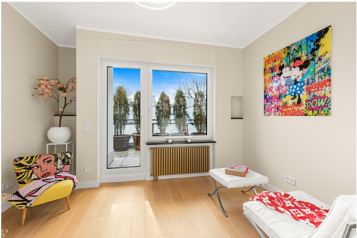
Kinderzimmer - möbliert 1