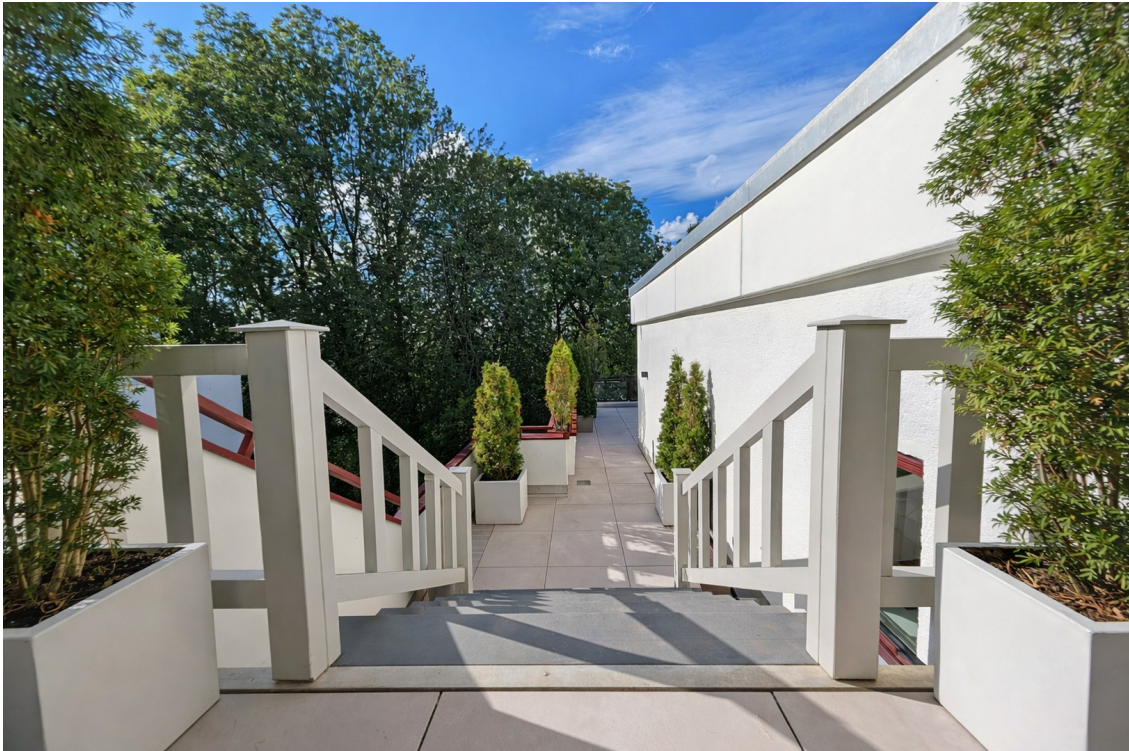
Treppe zur Master-Dachterrasse