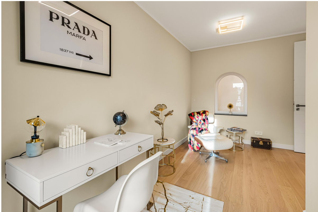
Kinderzimmer - möbliert 2