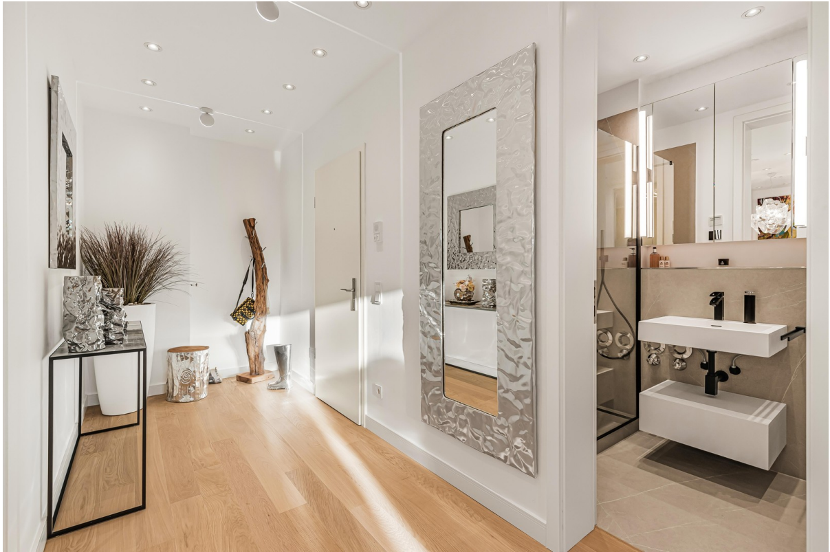
Flur mit Zugang zum Gästebad