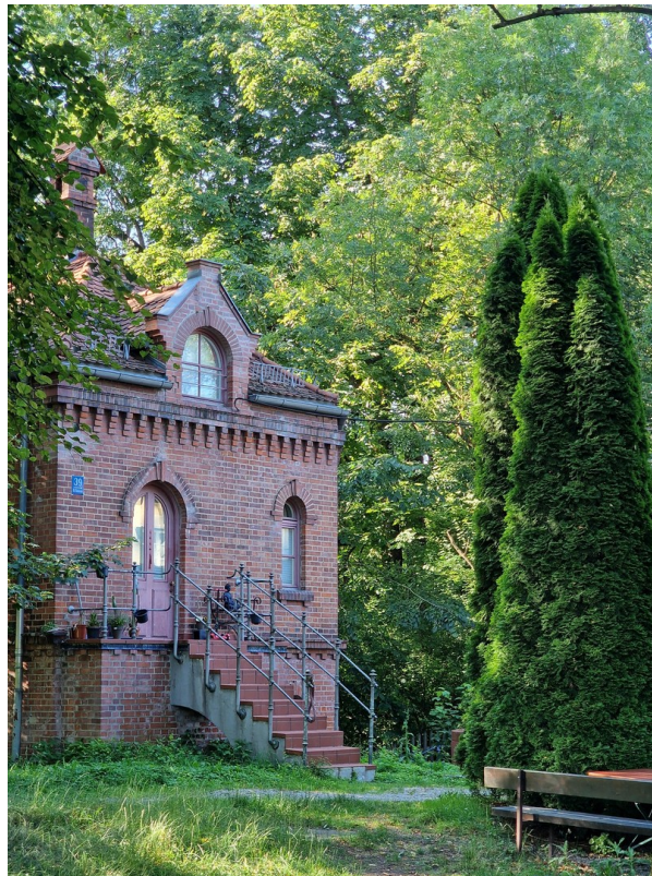
St-Emmeramsmühle in 5min