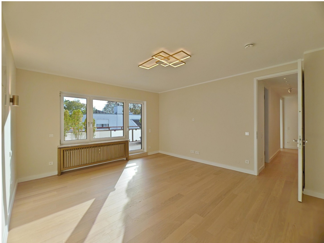
SZ mit Zugang zur DT