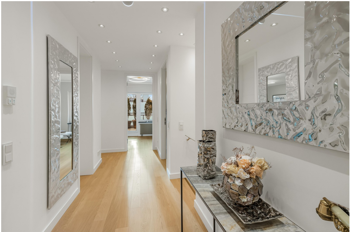
Flur- und Eingangsbereich