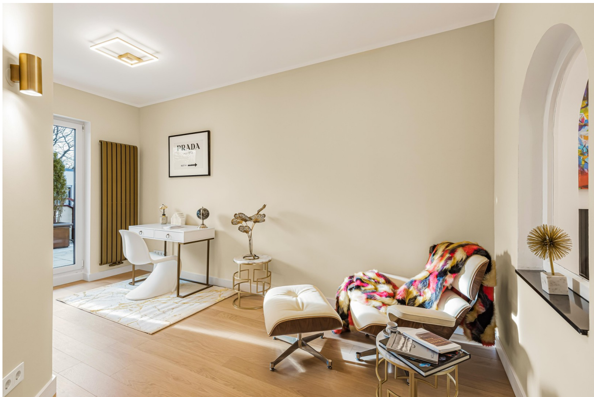
Kinderzimmer - möbliert 2