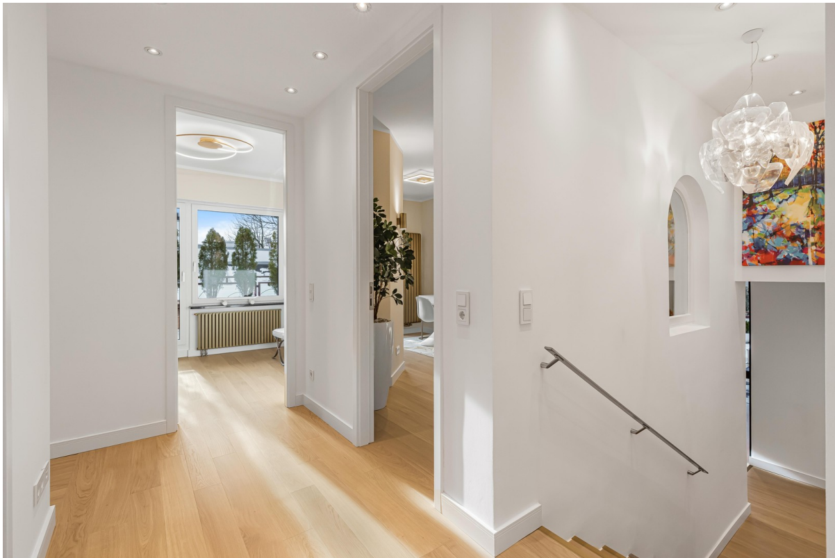
Flur- und Eingangsbereich