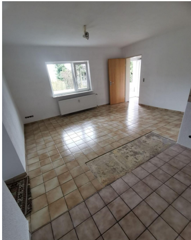
Wohnküche mit Blick zum Flur