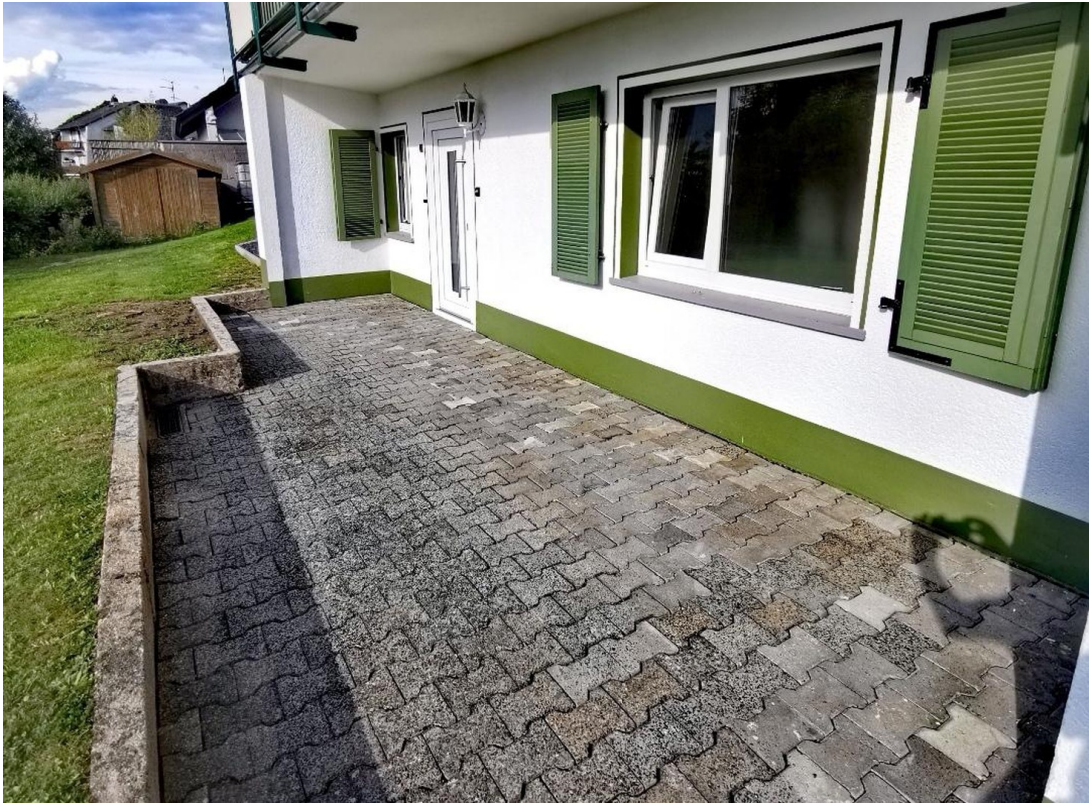
Wohnungszugang und Terrasse