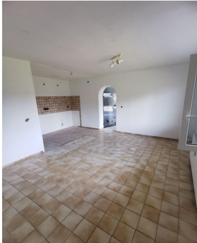
Wohnküche und Kochnische