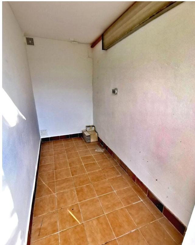
Außenkeller neben der Wohnung