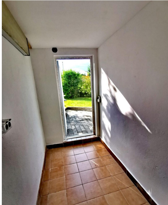
Außenkeller neben der Wohnung