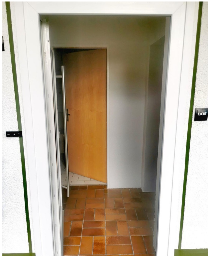
Wohnungszugang und Flur