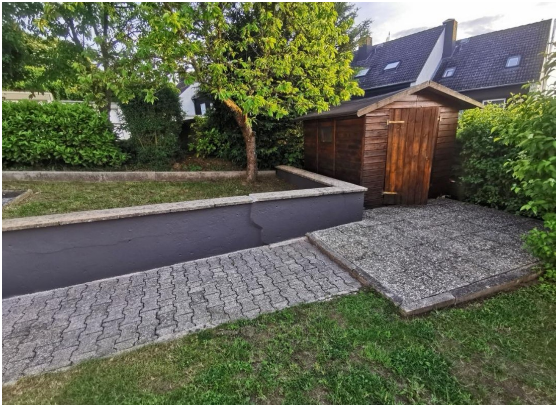
Garten mit Gerätehaus