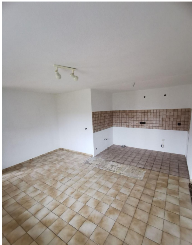
Wohnküche und Kochnische