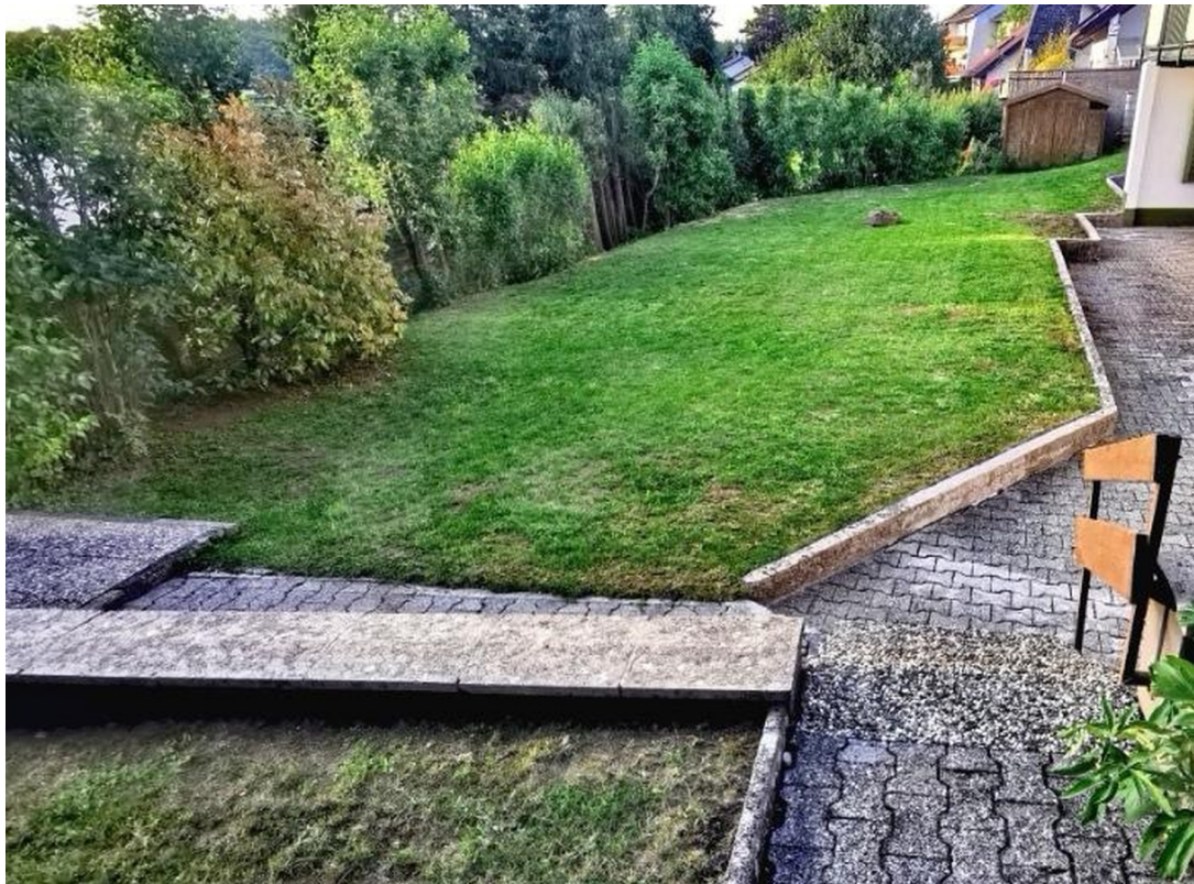
Wohnungs- & Gartenzugang