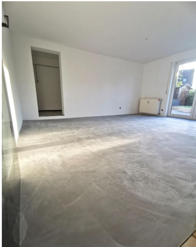
Wohnzimmer und Zugang HWR