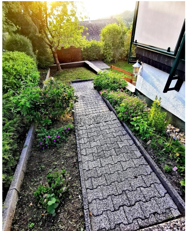
Wohnungs- & Gartenzugang