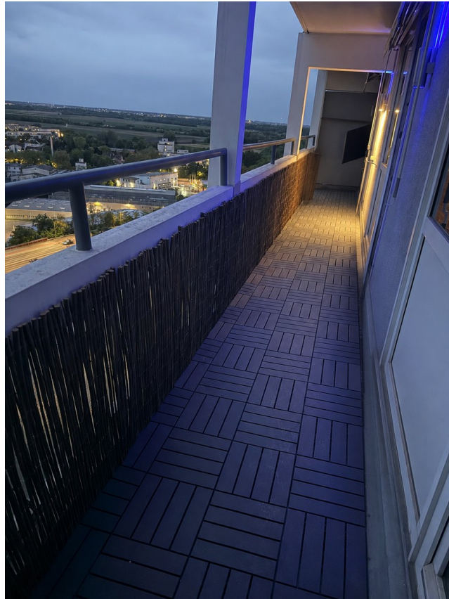
Balkon bei Dämmerung 2