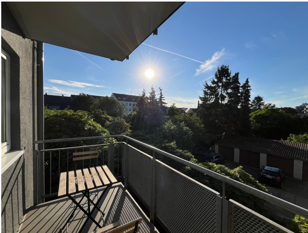
Schöner ruhiger Balkon