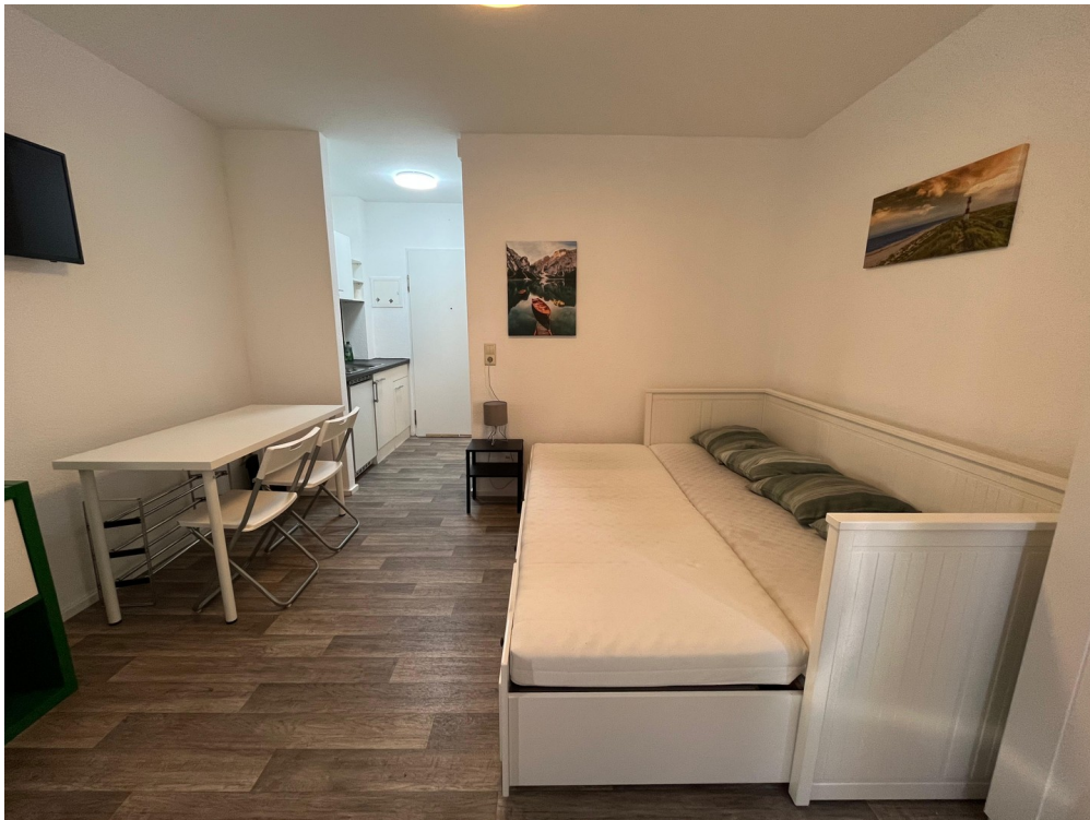
Wohnzimmer Richtung Küche