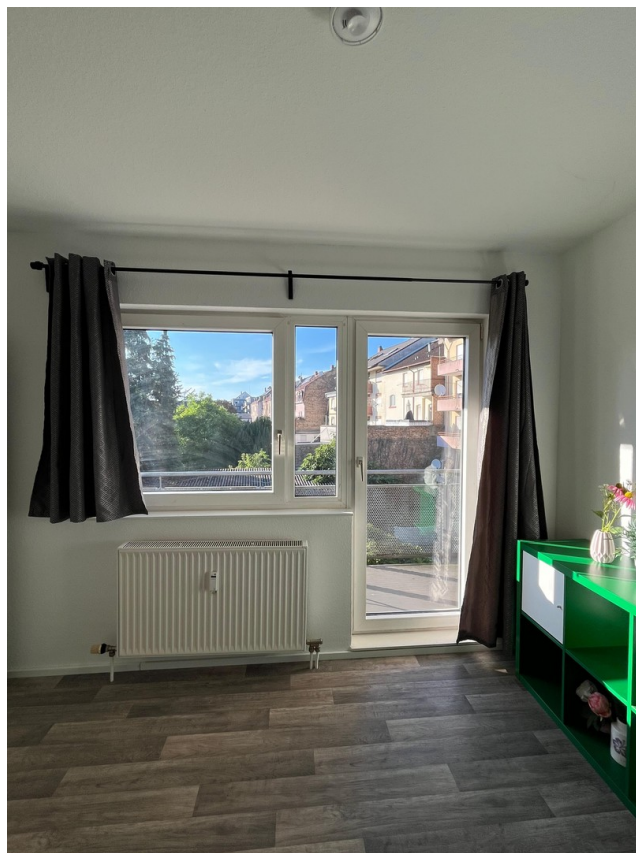
Wohnzimmer Richtung Balkon