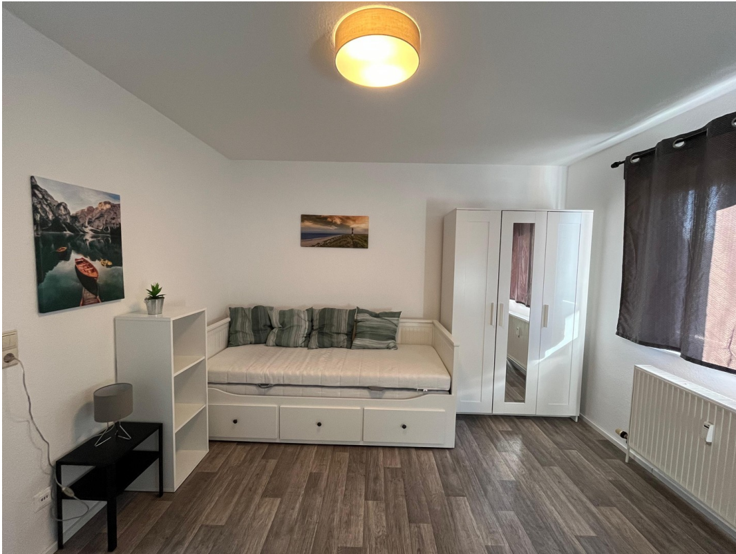
Bett & Schrankansicht