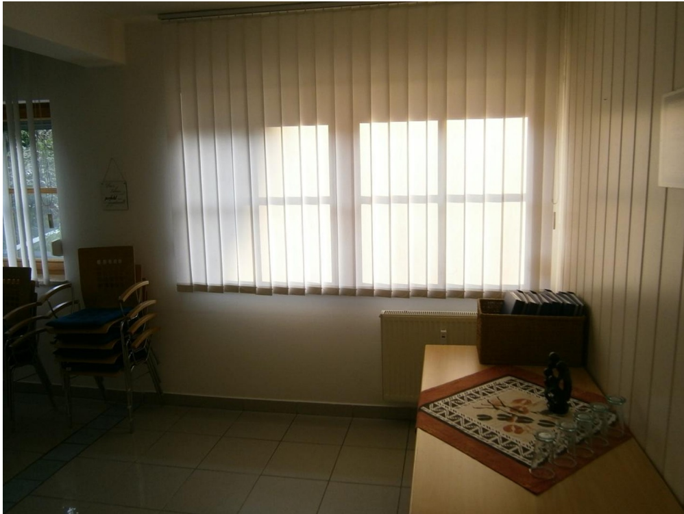
großer Raum, Blick Ost