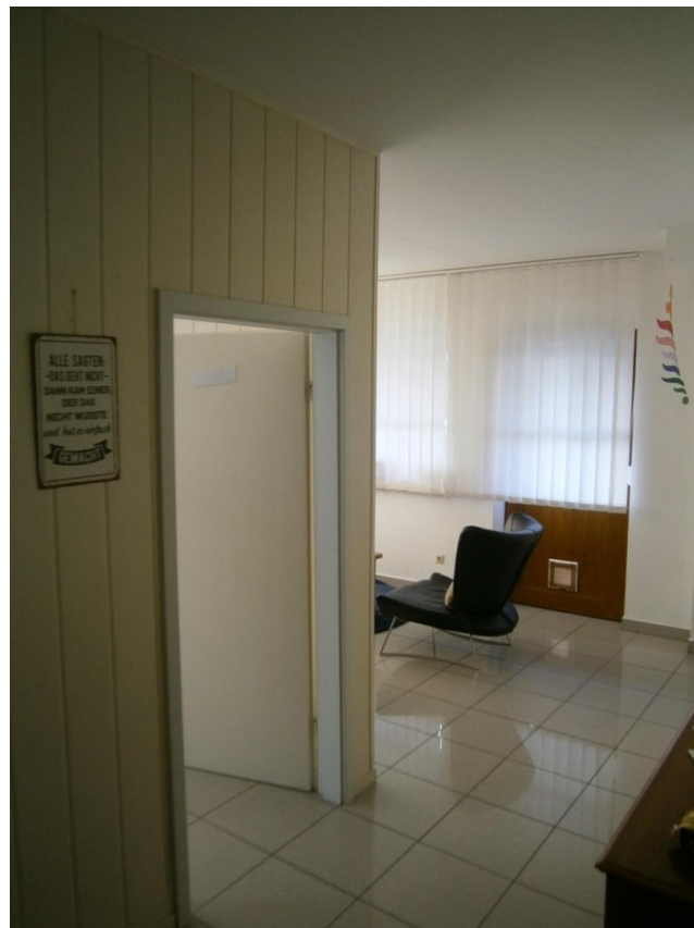
Raumteiler, Blick Süd