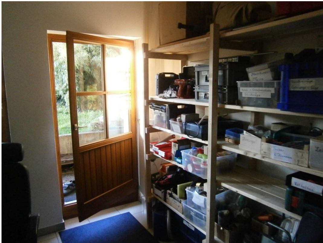
Tür Nord -> Terrasse Garten