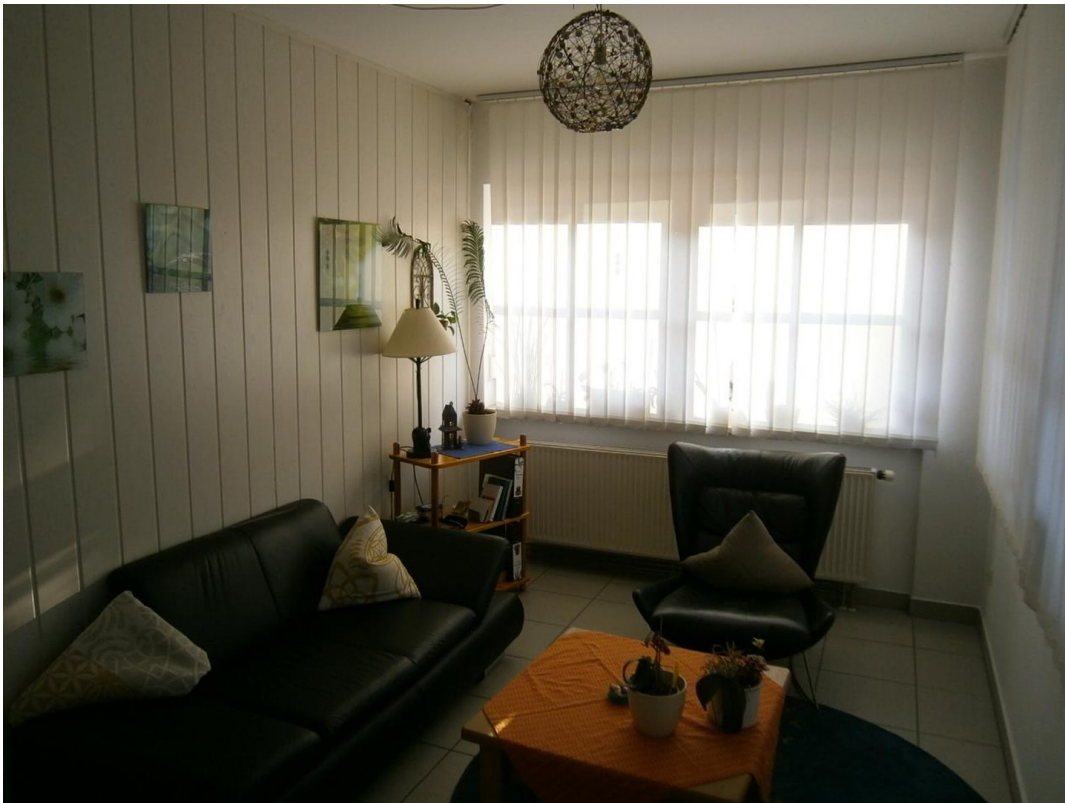
Morgenlicht im kl. Raum