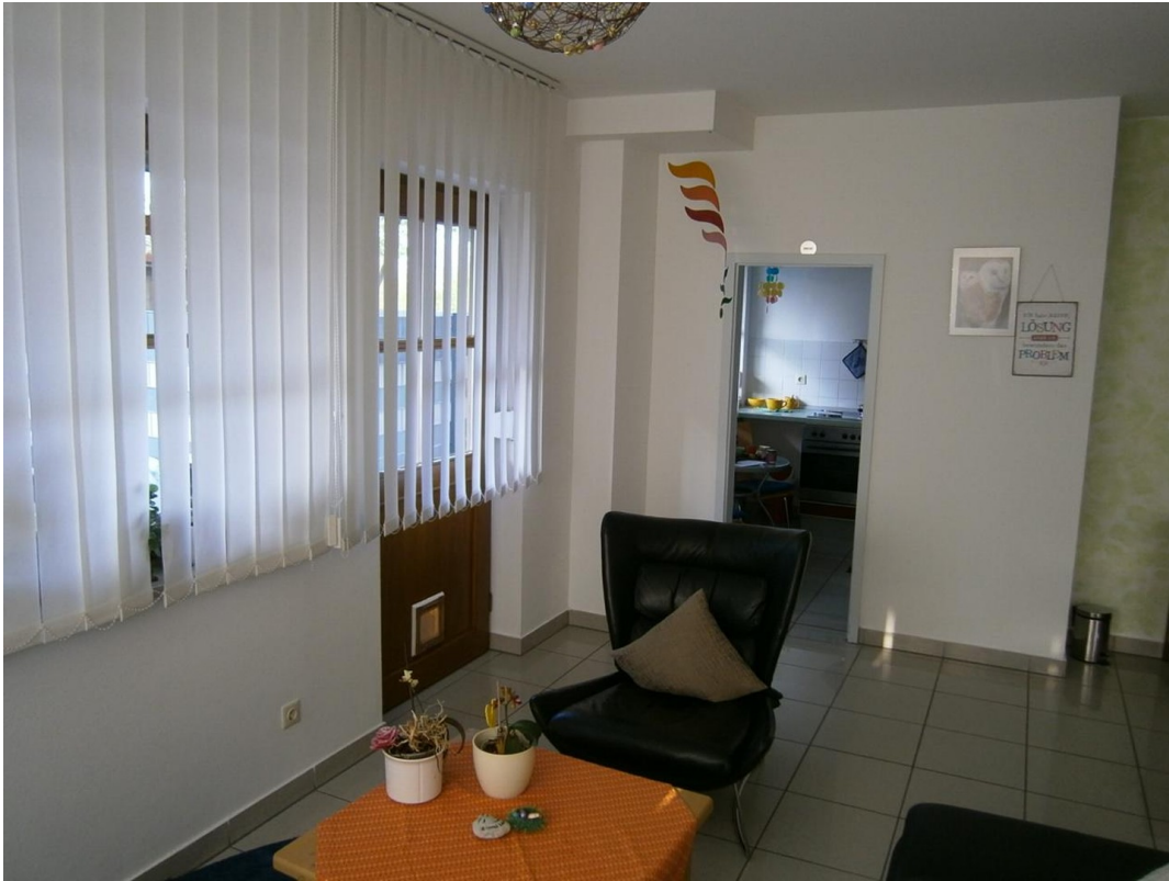
kl. Raum, Eingang Süd