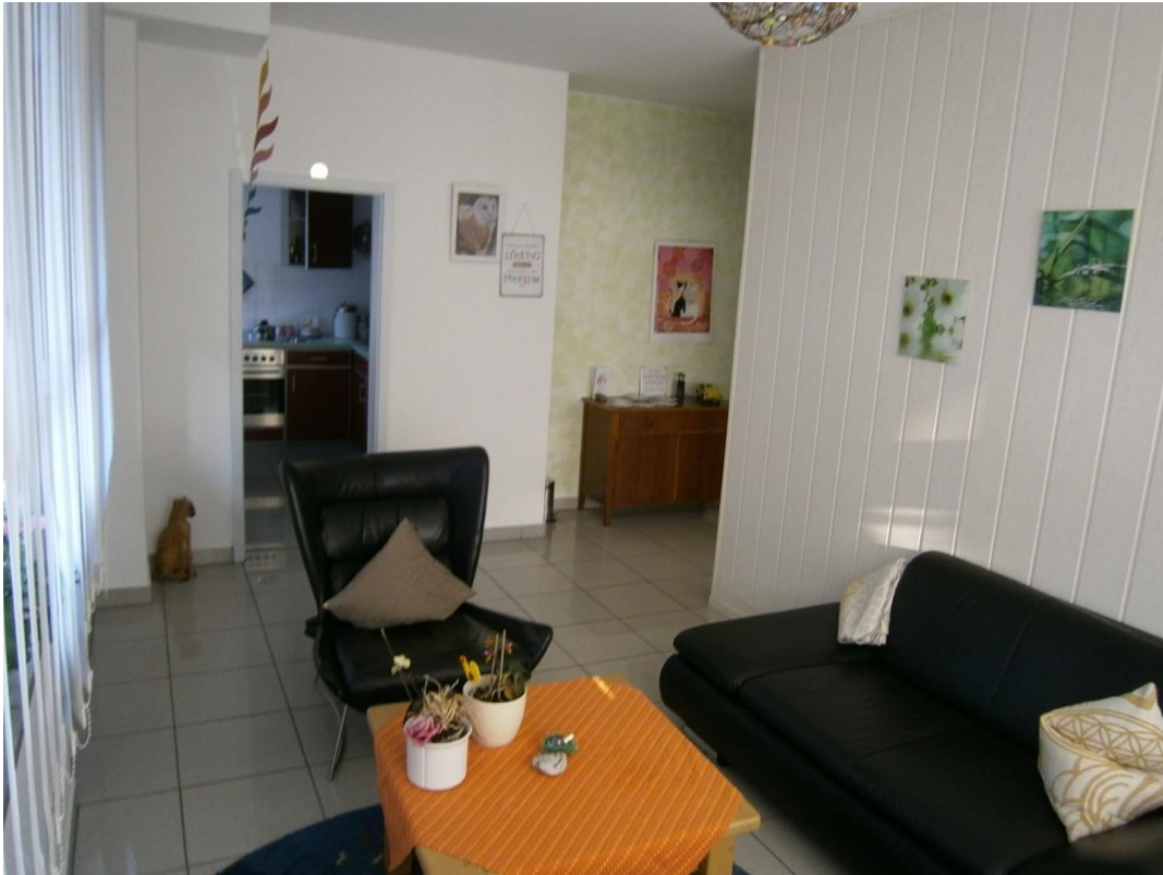
kleiner Raum + Blick in Küche