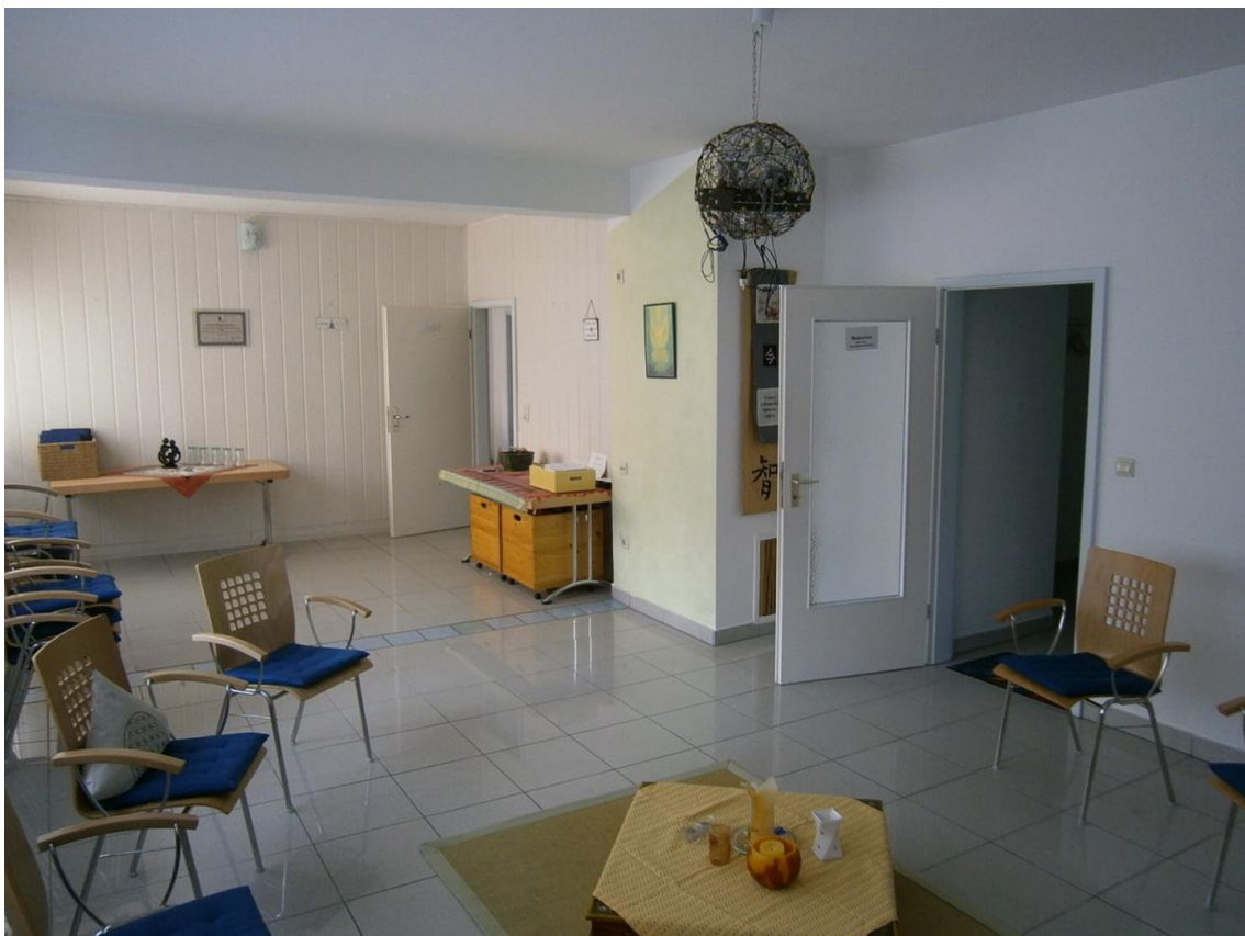
Sturz: da war Wand