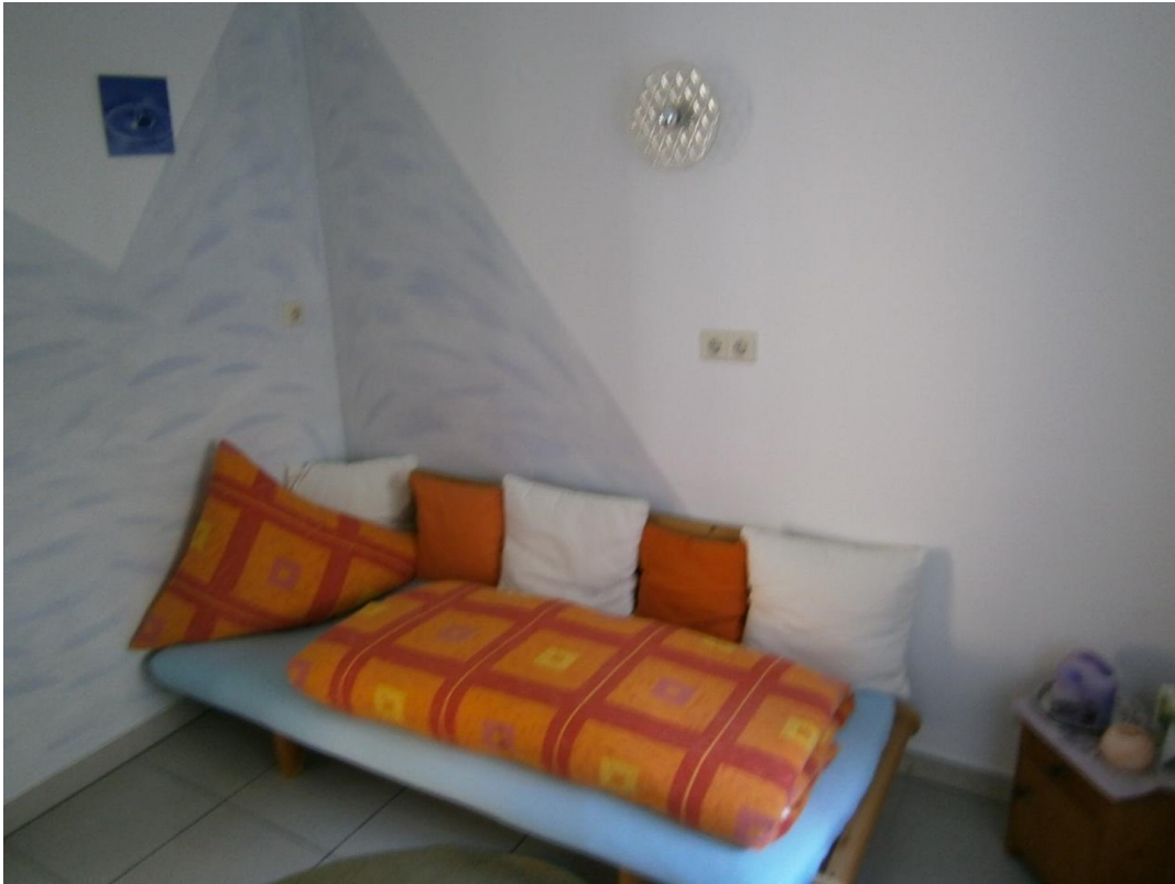
Minizimmer Nord (war Küche)