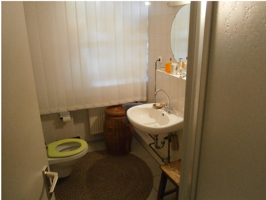
Bad / WC Nord