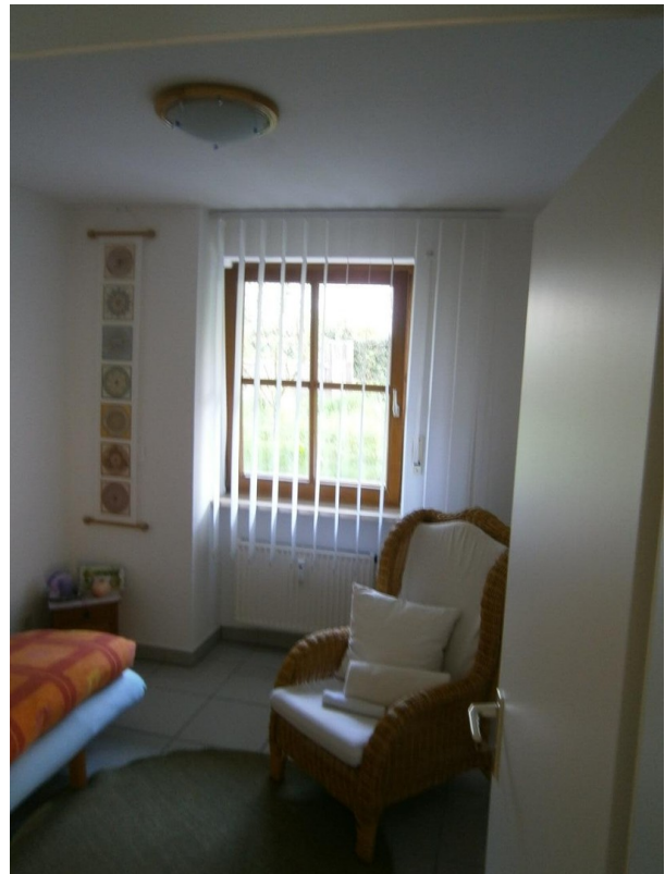
Mini-Zimmer, Blick Nord