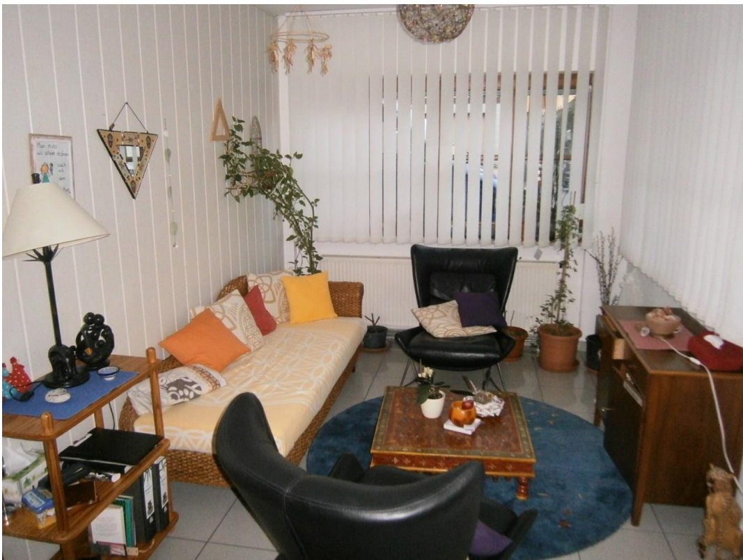
kl. Raum Blick Ost