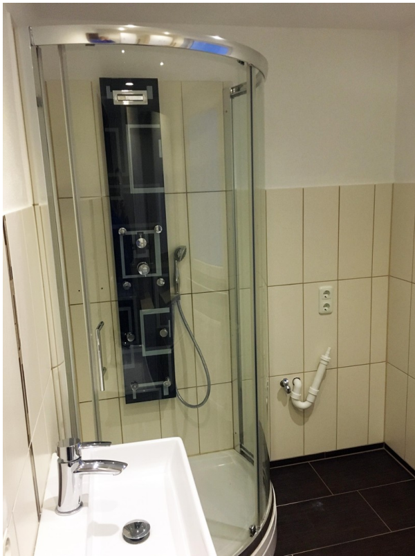
Dusche+Platz für Waschm.