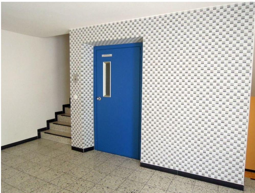
Eingangsbereich mit Aufzug