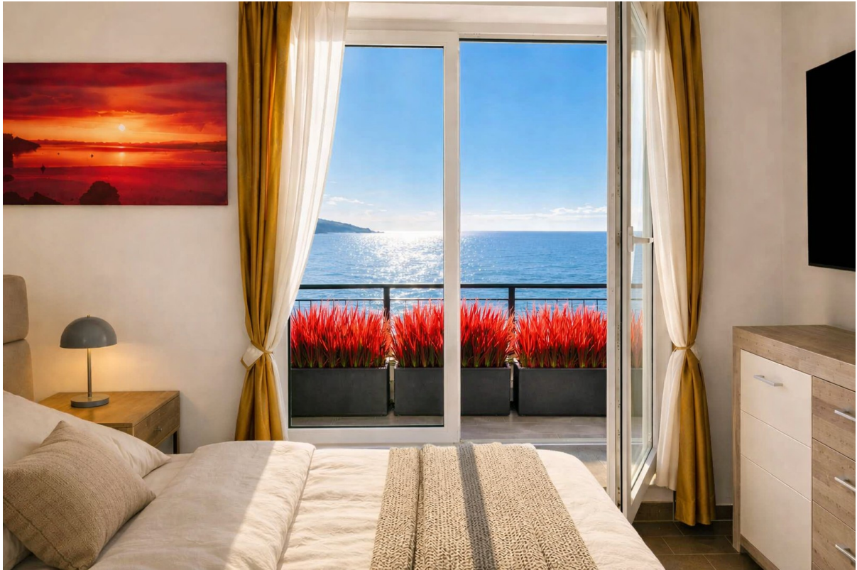
Schlafzimmer 2, Ostseeblick