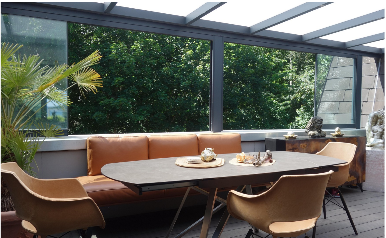
Moderne Dachterrasse, Sommer