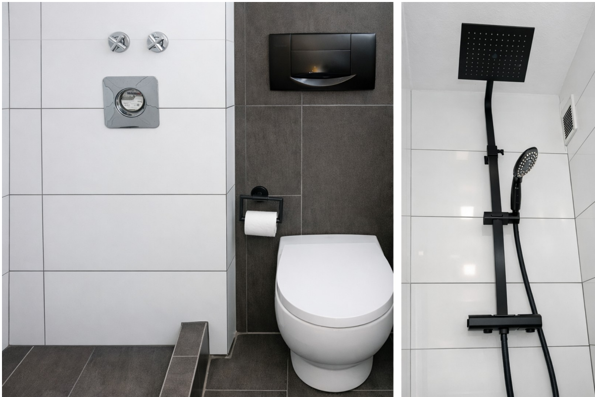
Gästebad, Walk in Dusche