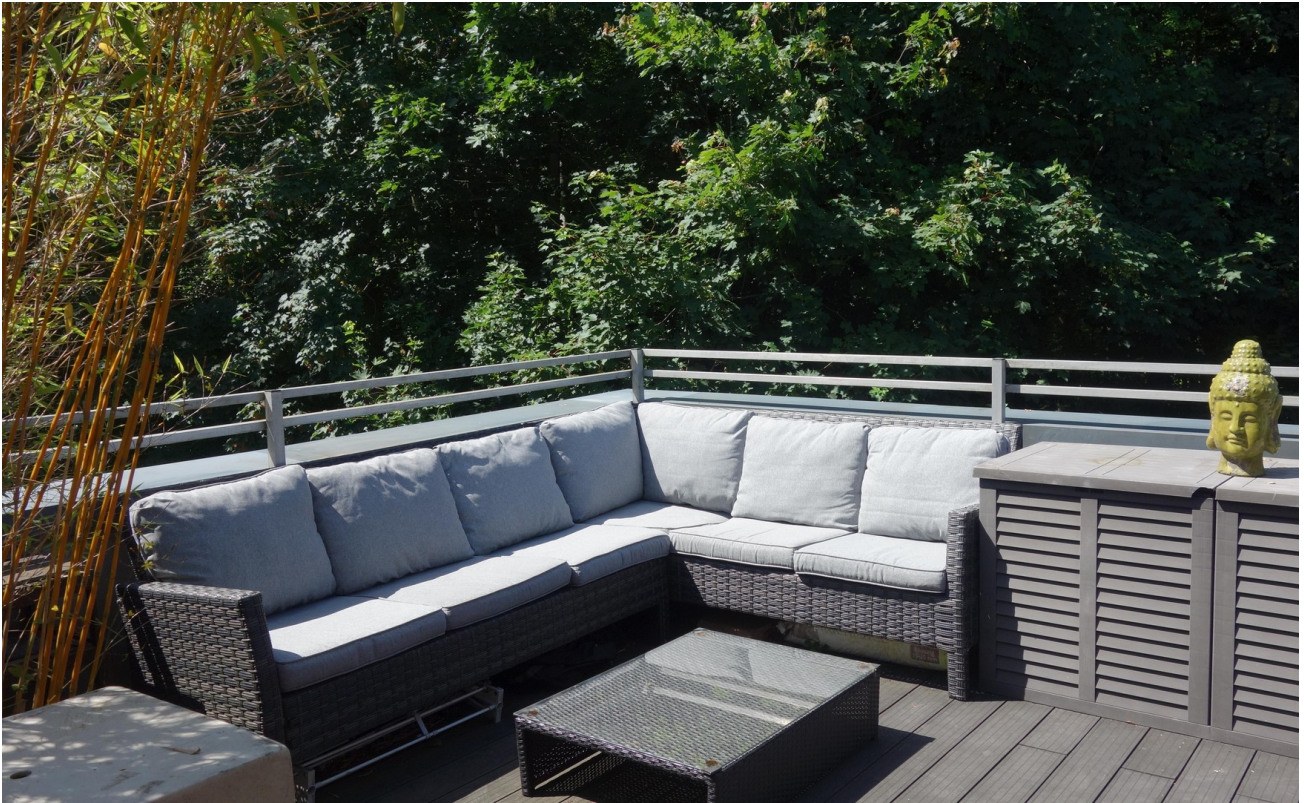
Grünblick & Sichtachse-Förde