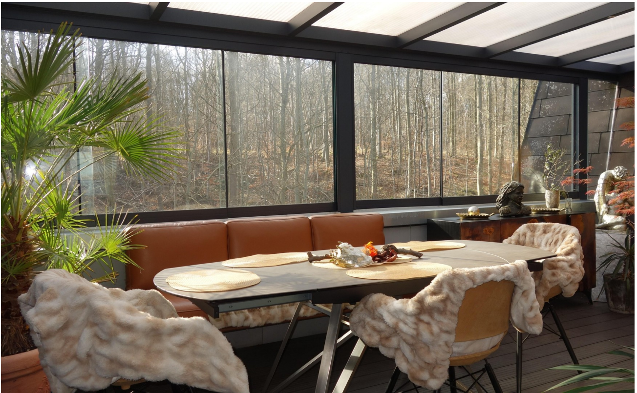
Moderne Dachterrasse, Winter