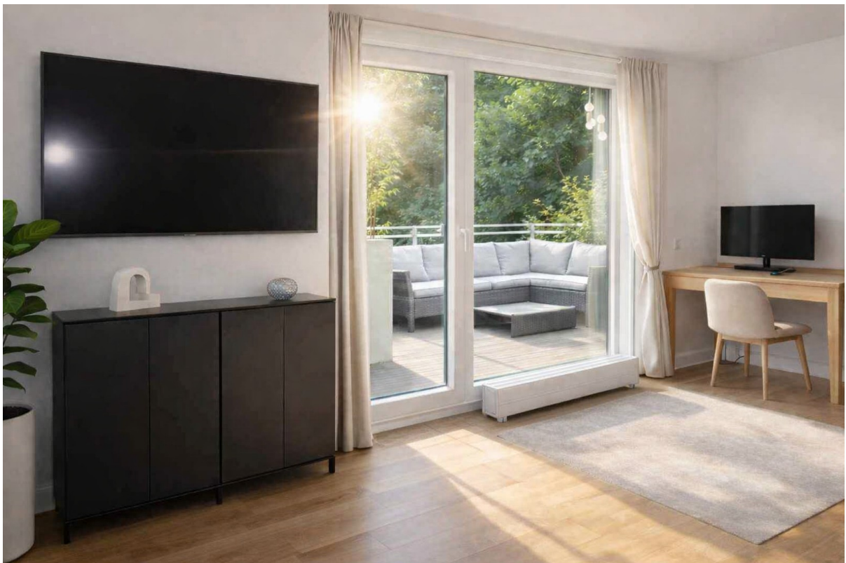
Schlaf-, Kinderzimmer-1 / Büro