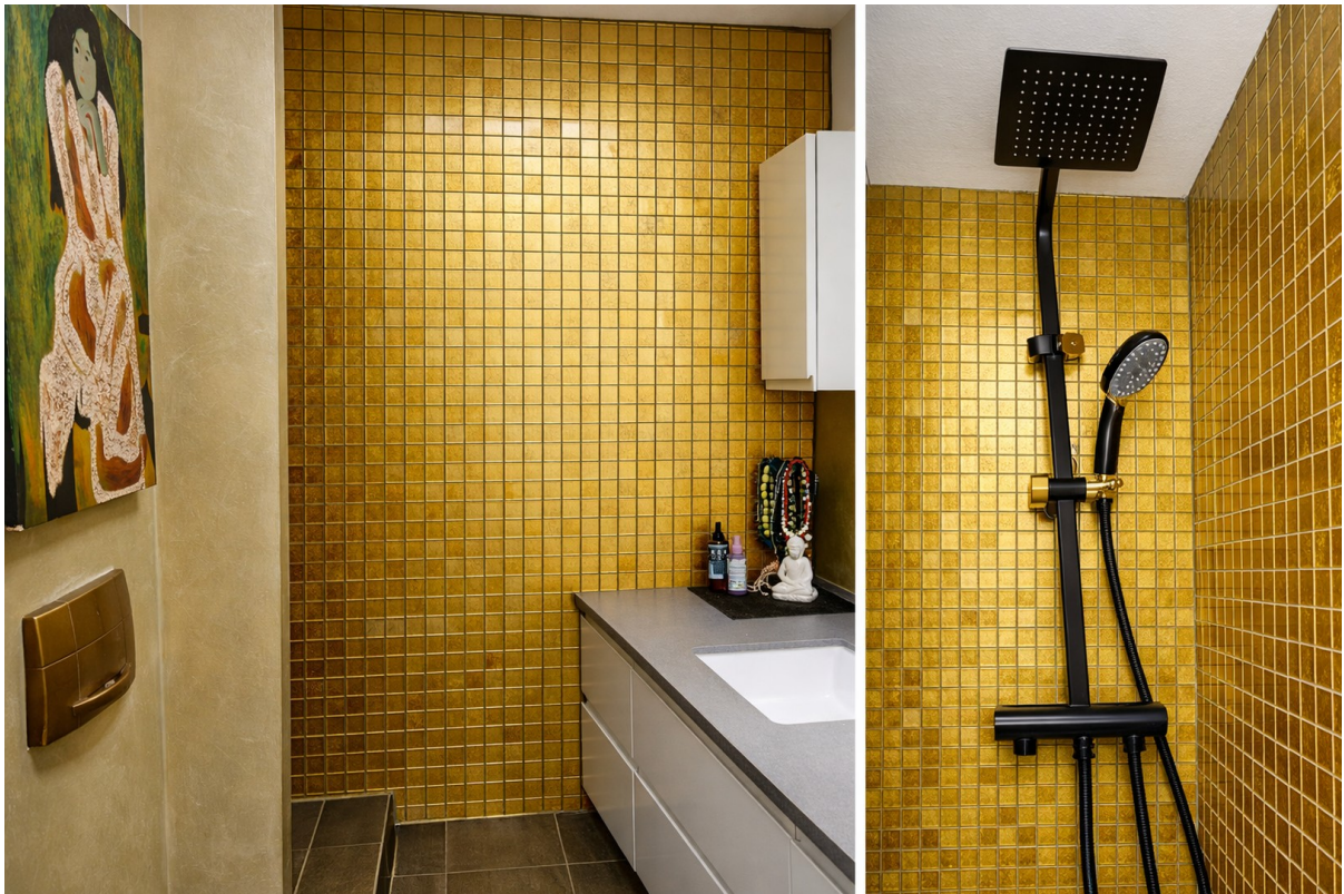
Bad en Suite, Rainshower