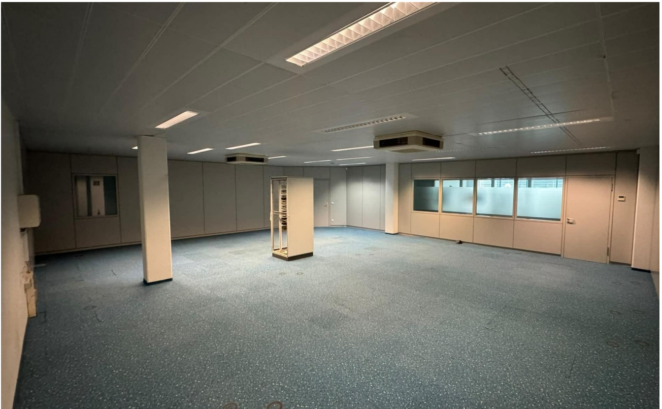
Lager 105 m 2