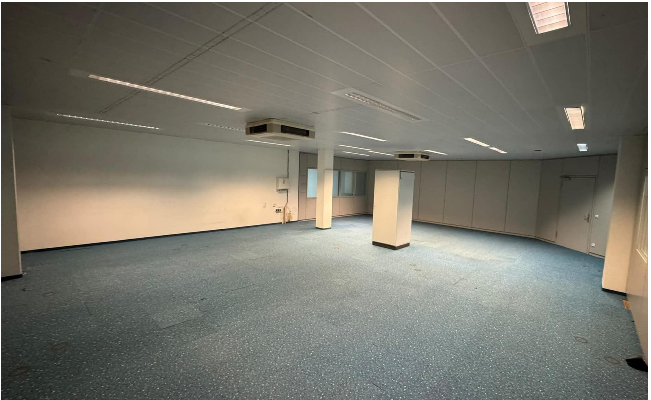
Lager 105 m 2