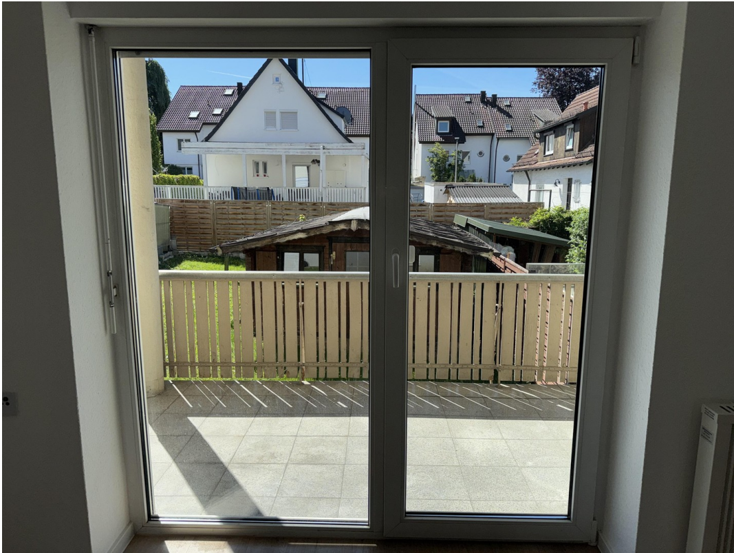
Blick in den eigenen Garten