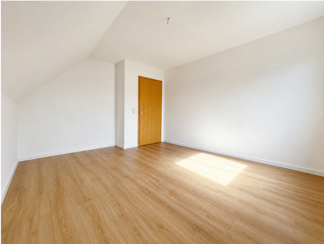
Schlafzimmer Blick Tür