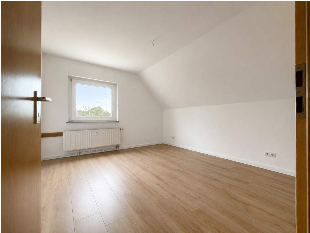
Schlafzimmer Blick Fenster