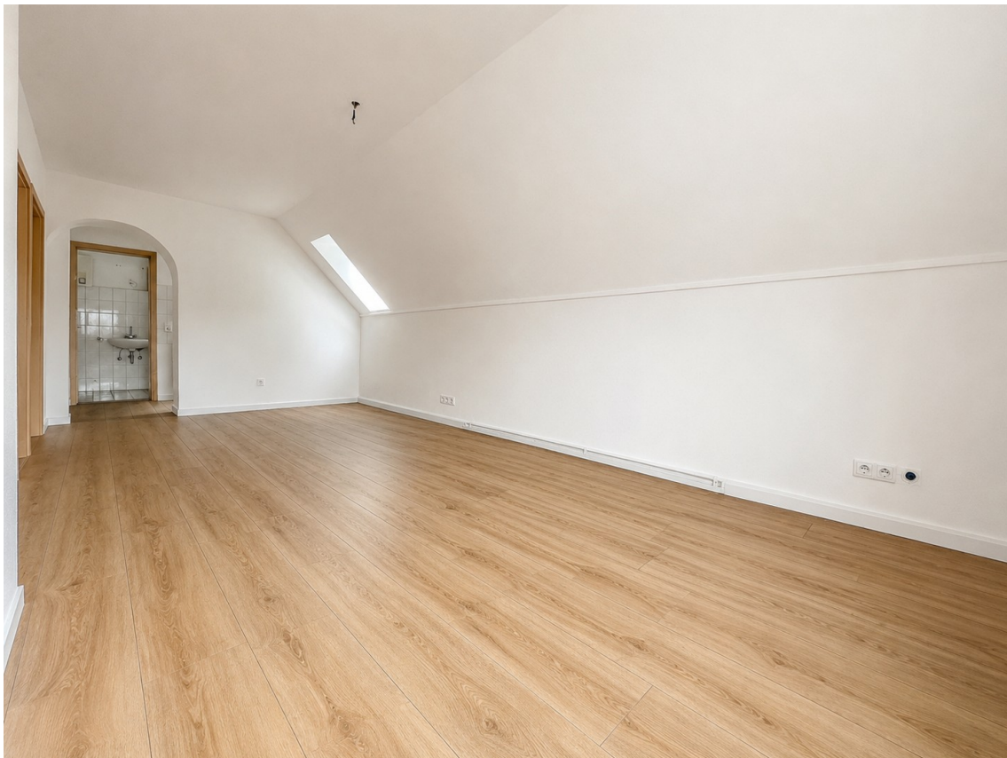
Wohnküche Blick in Raum