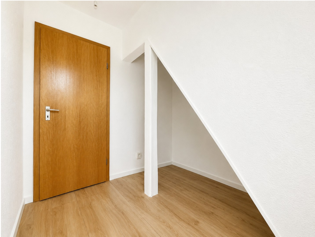
kleiner Raum / Abstell