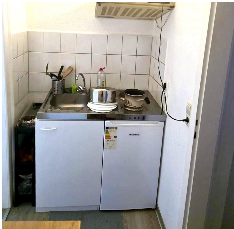
Küche Teil 2