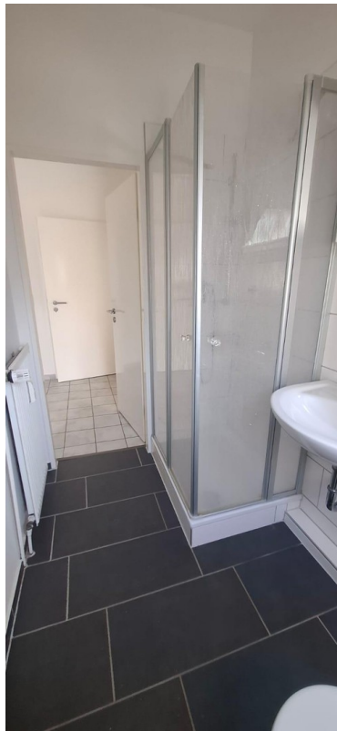
Bad Richtung Küche