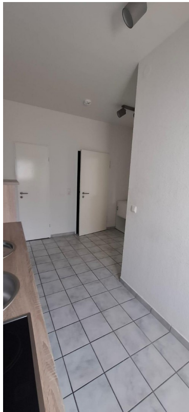
Küche zur Eingangstür+Abstellk