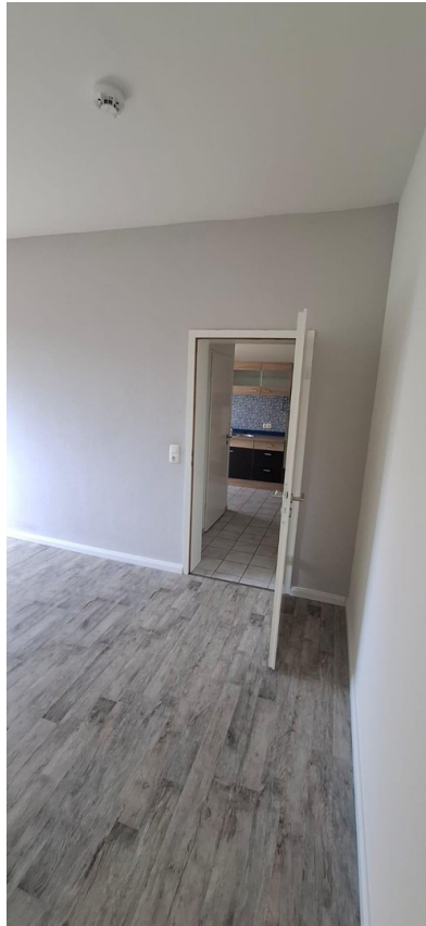
Schlaf-/Wohnzimmer zur Küche