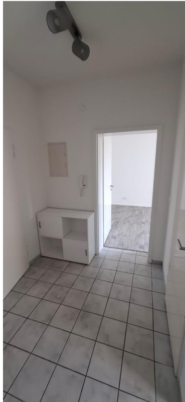
Küche zum Schlaf-/Wohnzimmer