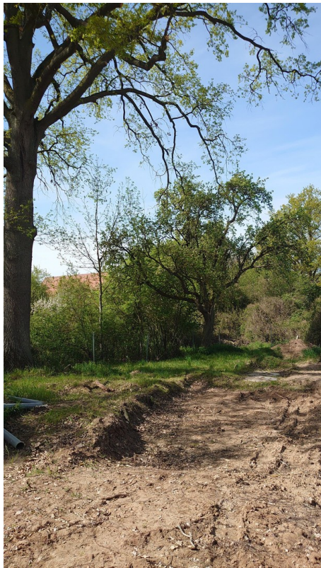
Blick Richtung Nordosten