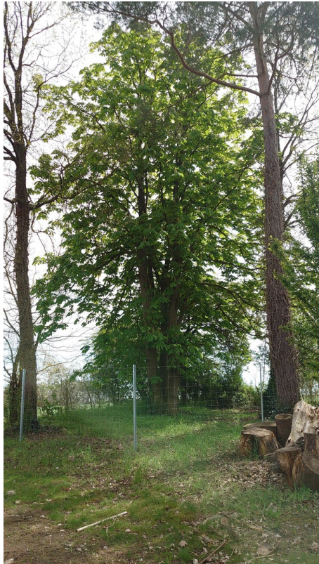
Blick Richtung Süden