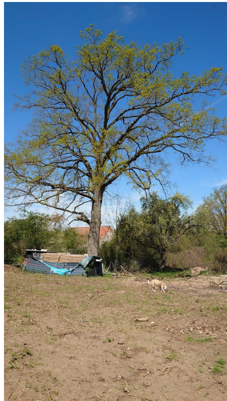
Blick Richtung Osten