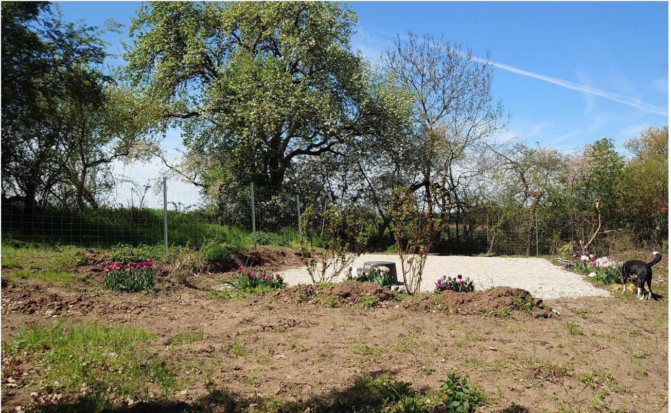
Bereich f. Gewächshaus o.ä.