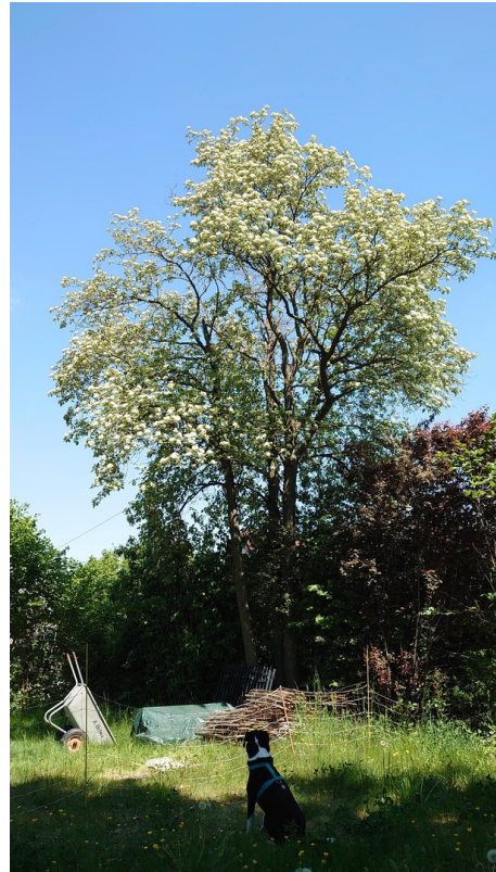
Blick Richtung Westen