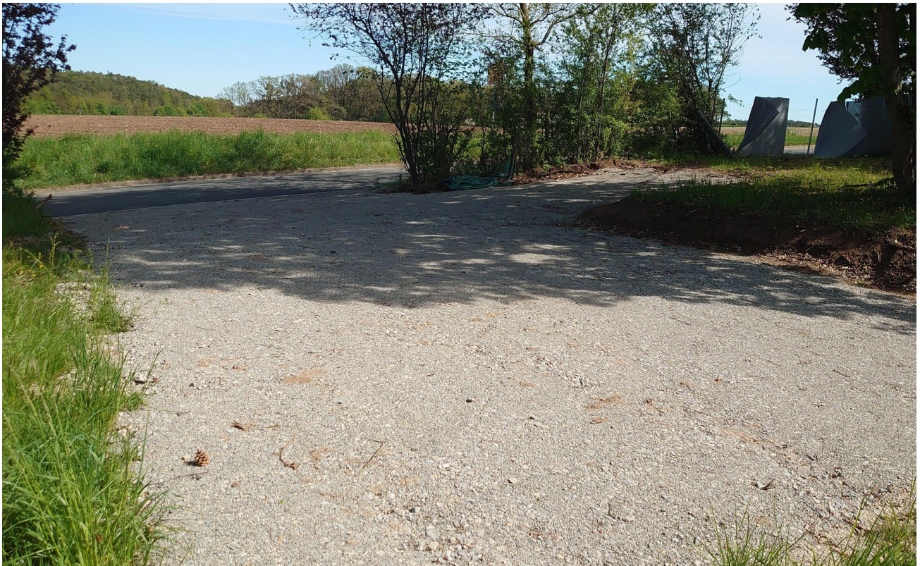
Einfahrt - Westen