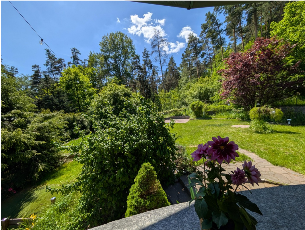
Gartenansicht v. Terasse