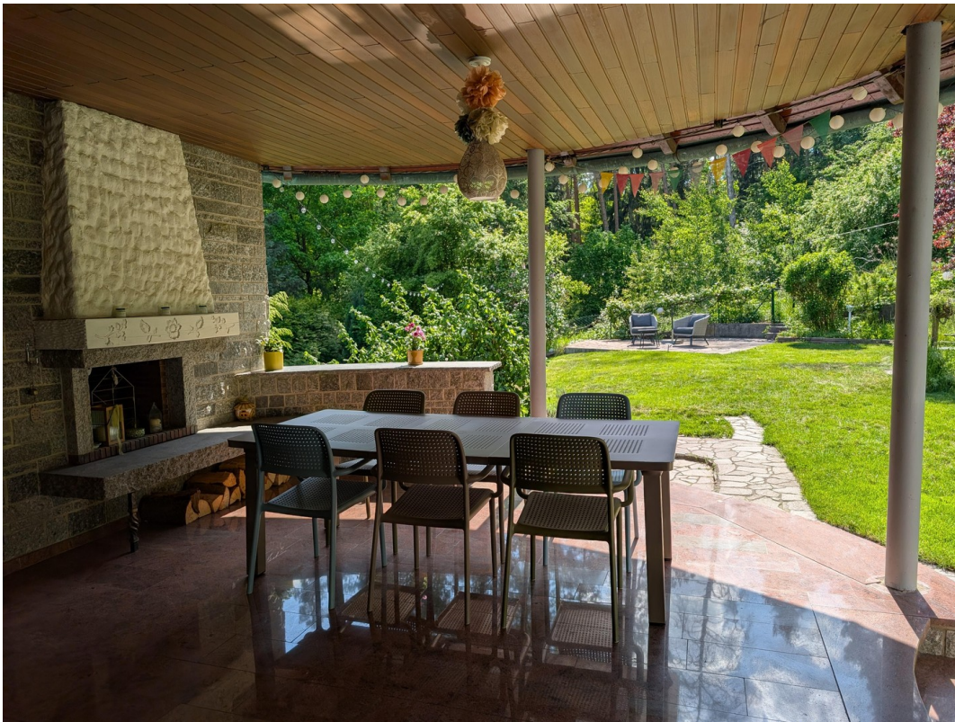
Terrasse mit Kamin