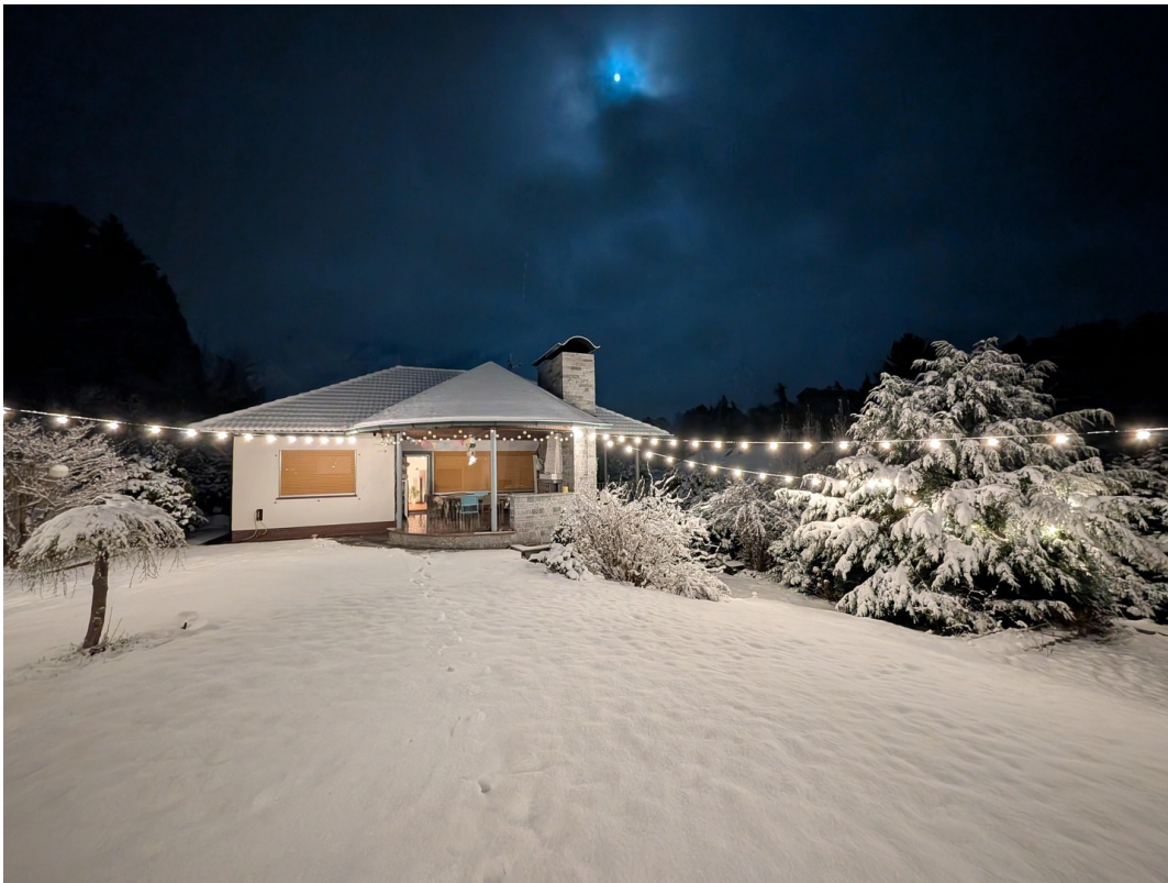
Hausansicht Garten Winter