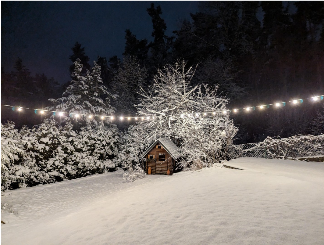
Garten im Schnee