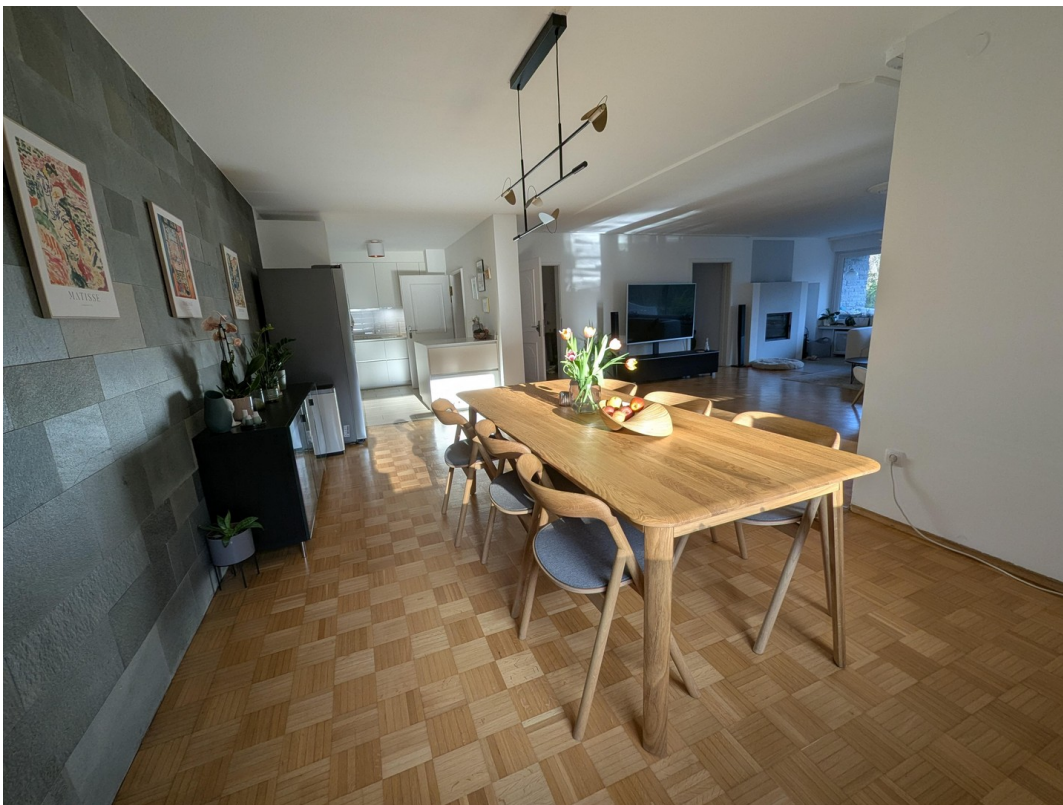
Essbereich und Wohnzimmer