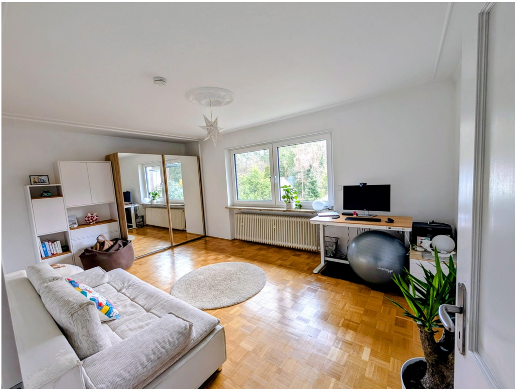
Arbeitszimmer o. Gästezimmer