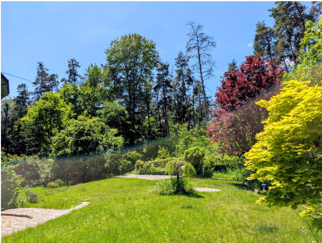
Garten mit Waldblick