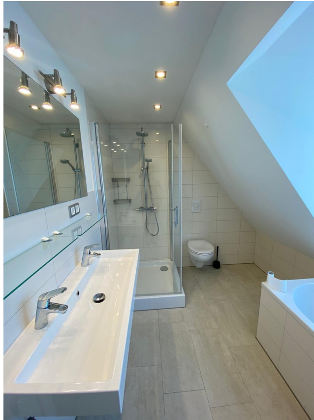
Bad OG 1/2