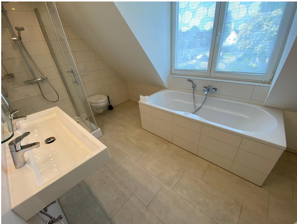
Bad OG 2/2