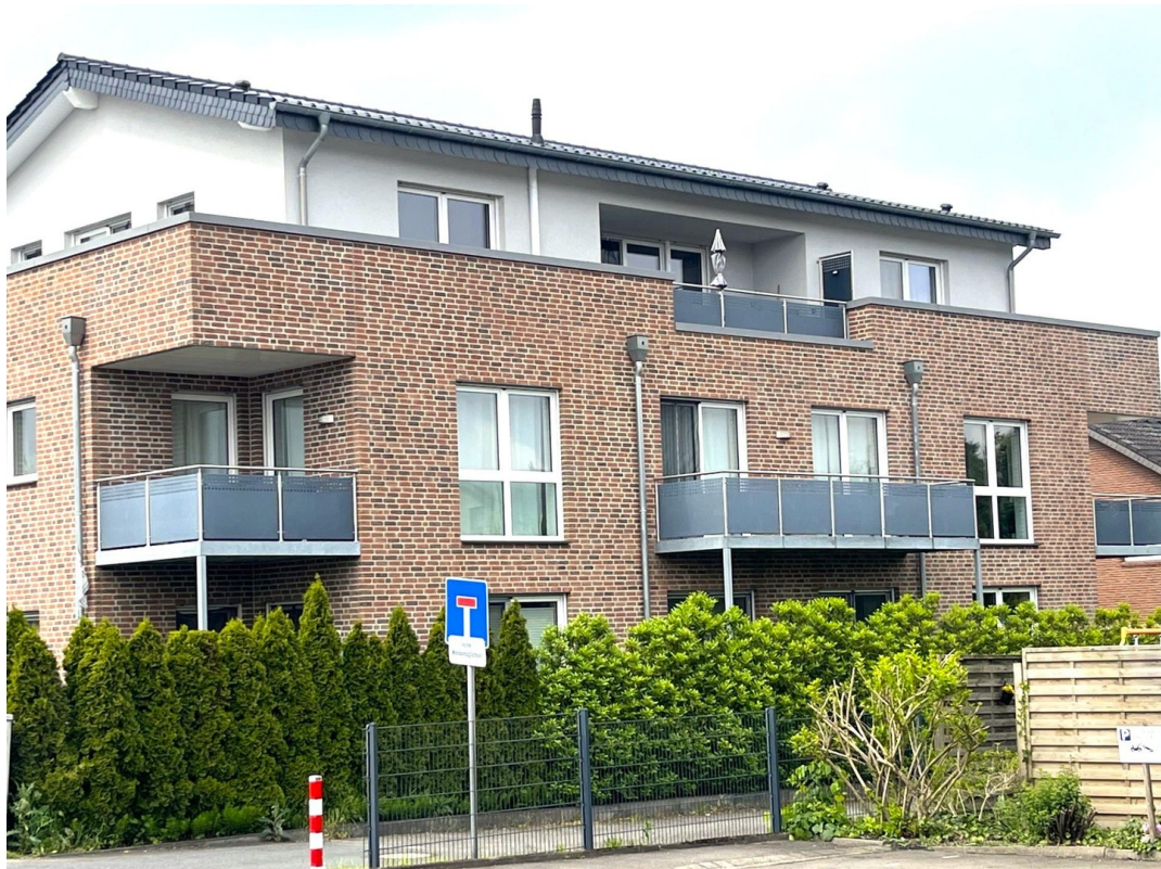
Seitenansicht mit Balkon