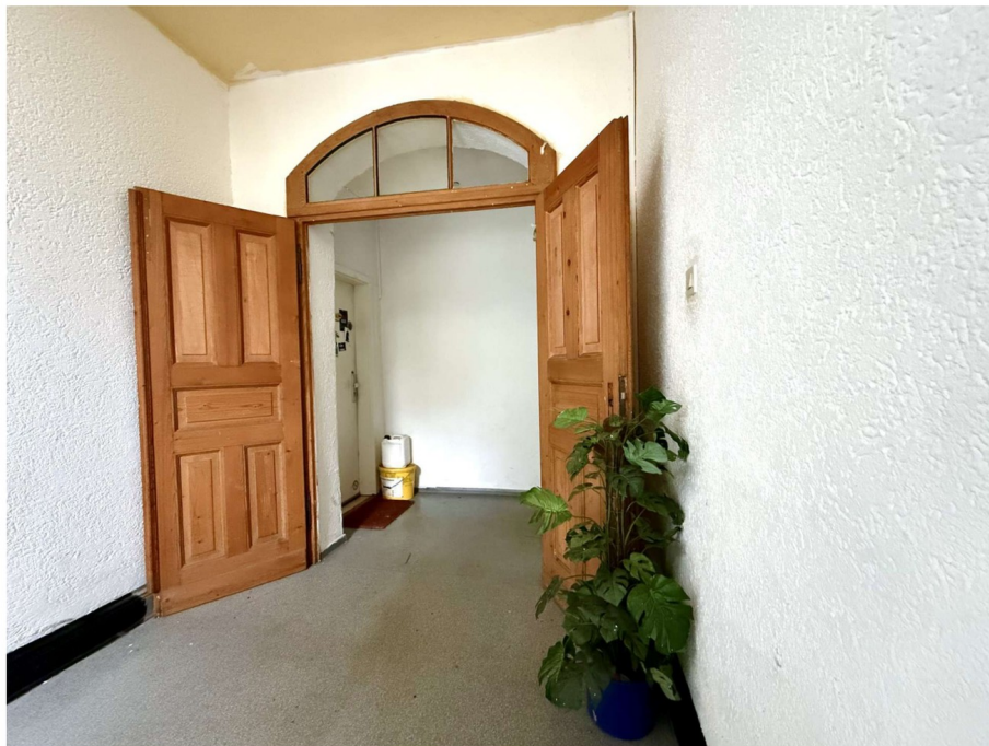
Treppenhaus Treppenhaus 1. OG