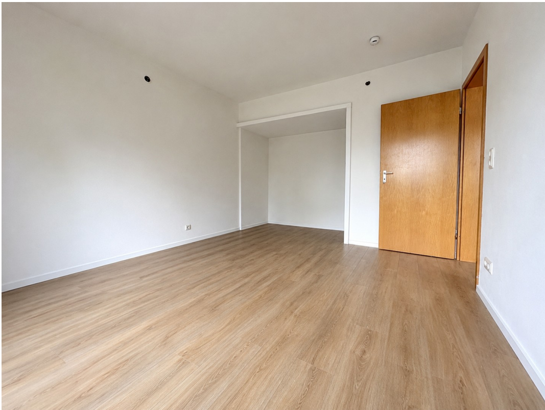
Schlafräum Blick Nische