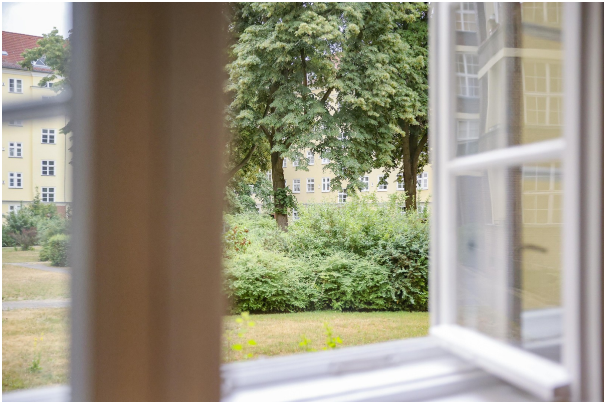
Schlafzimmer - Innenhof