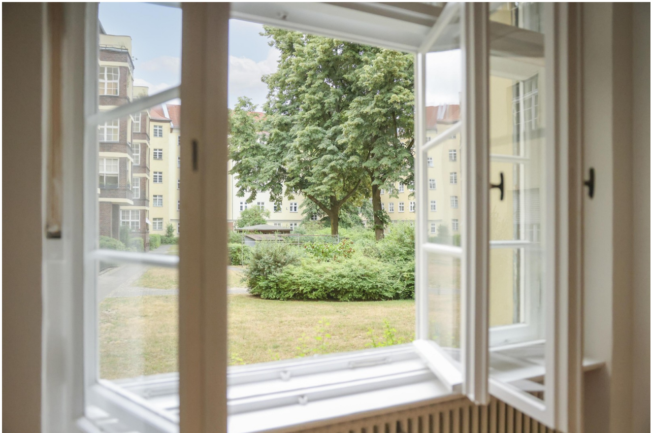
Schlafzimmer - Innenhof