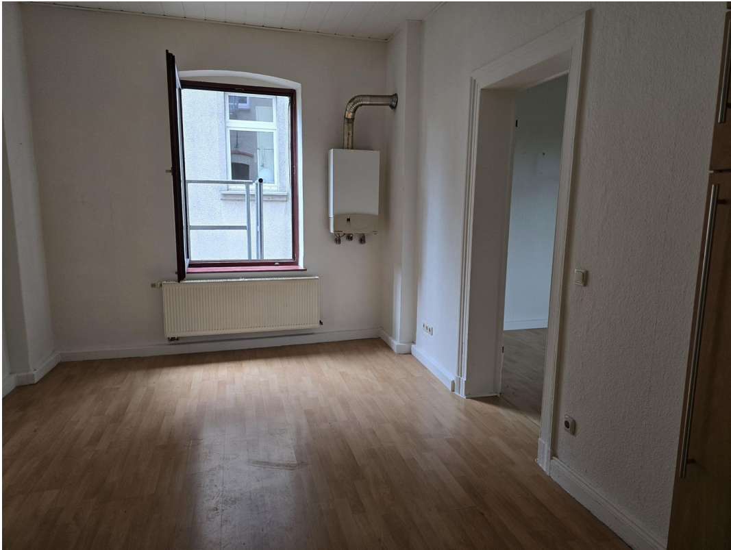
Küche & Esszimmer