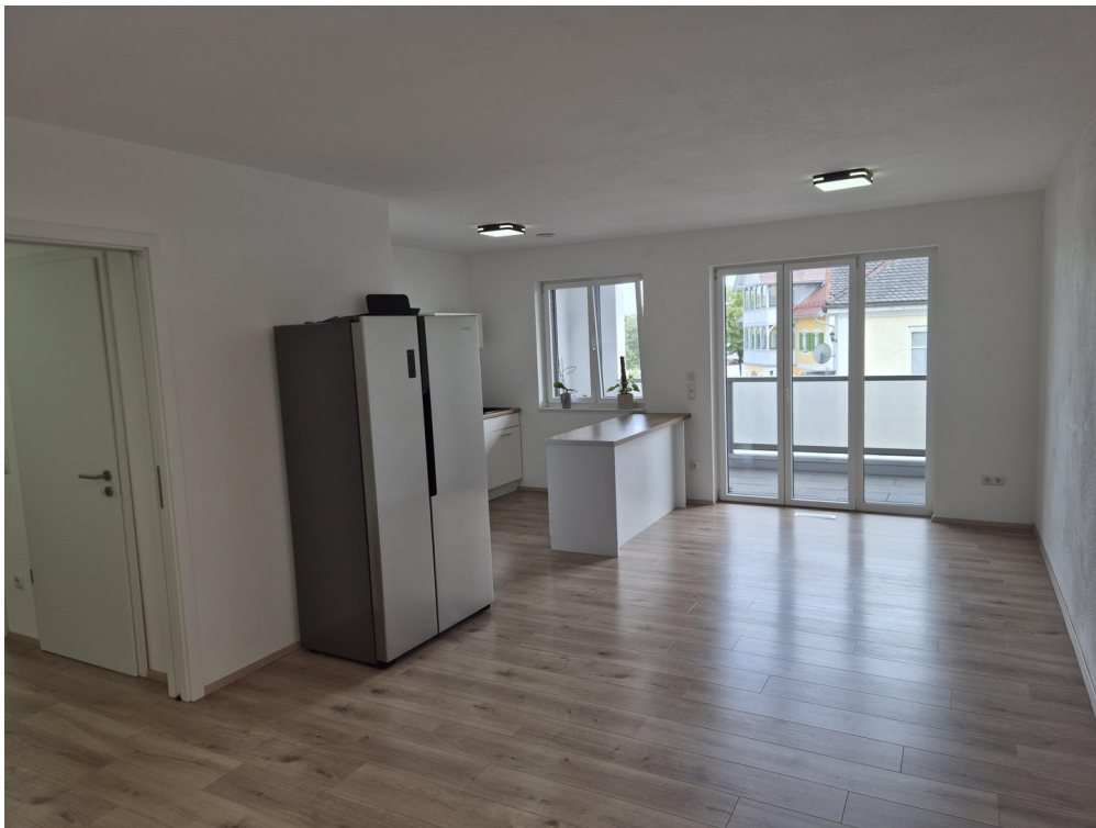
Küche - Essen