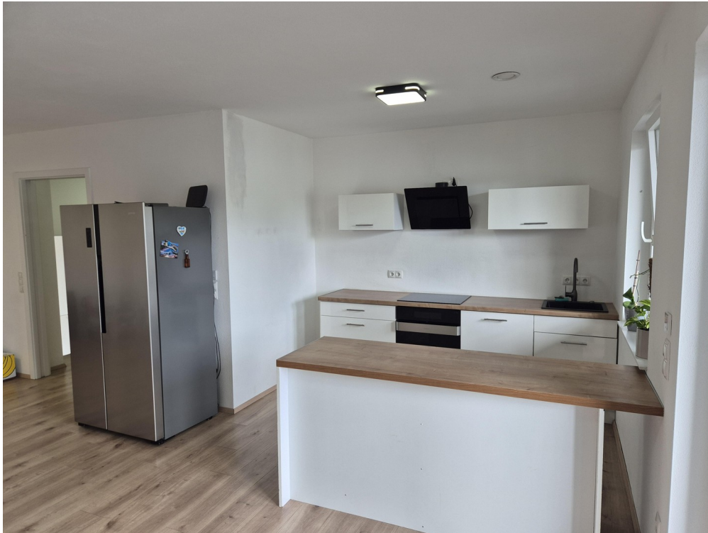
Küche - Essen