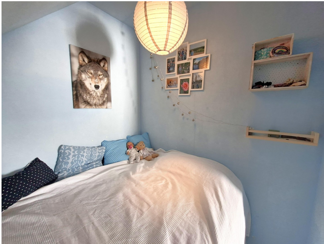
Schlafzimmer 4, DG