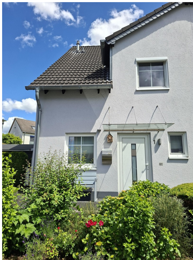
Hausansicht mit Vorgarten