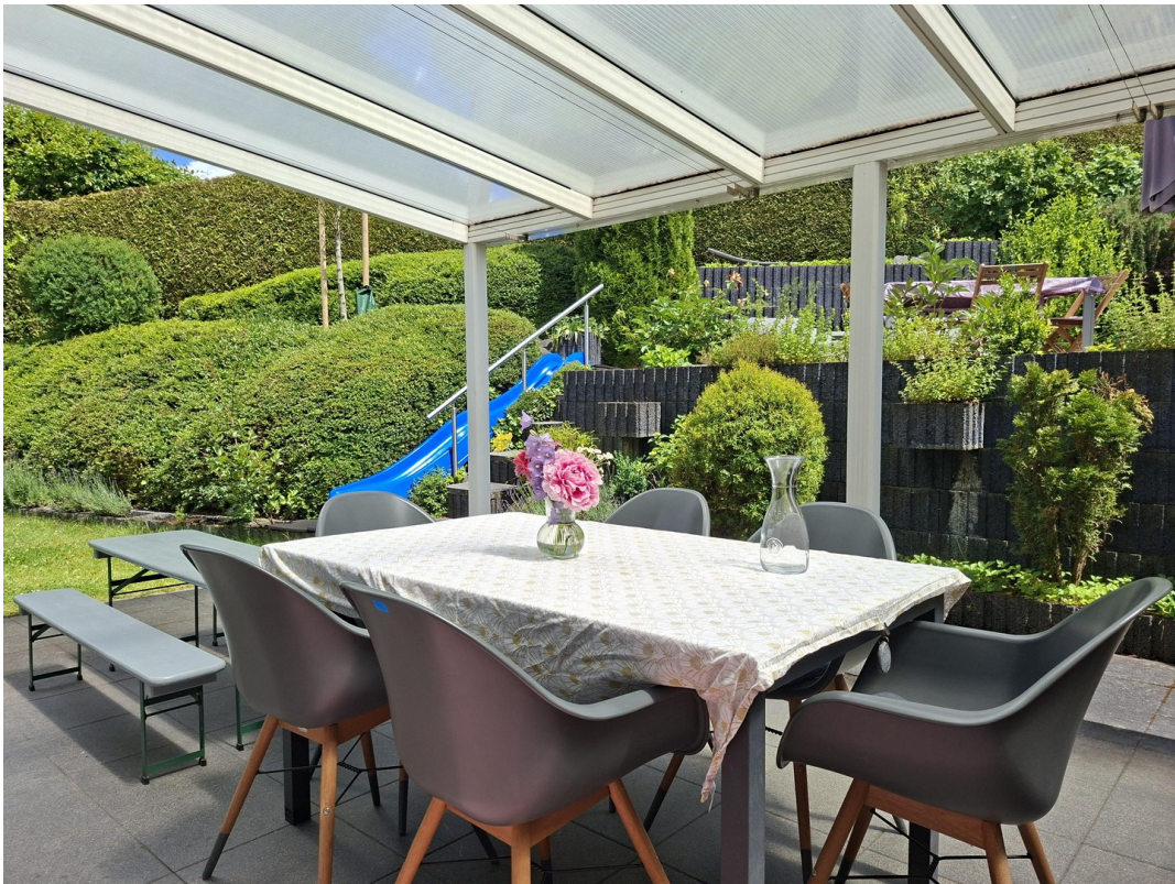
für jedes Wetter