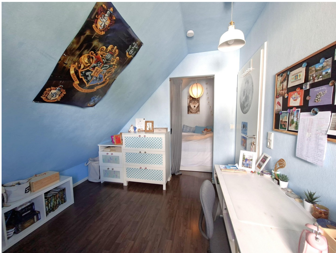
Schlafzimmer 4, DG