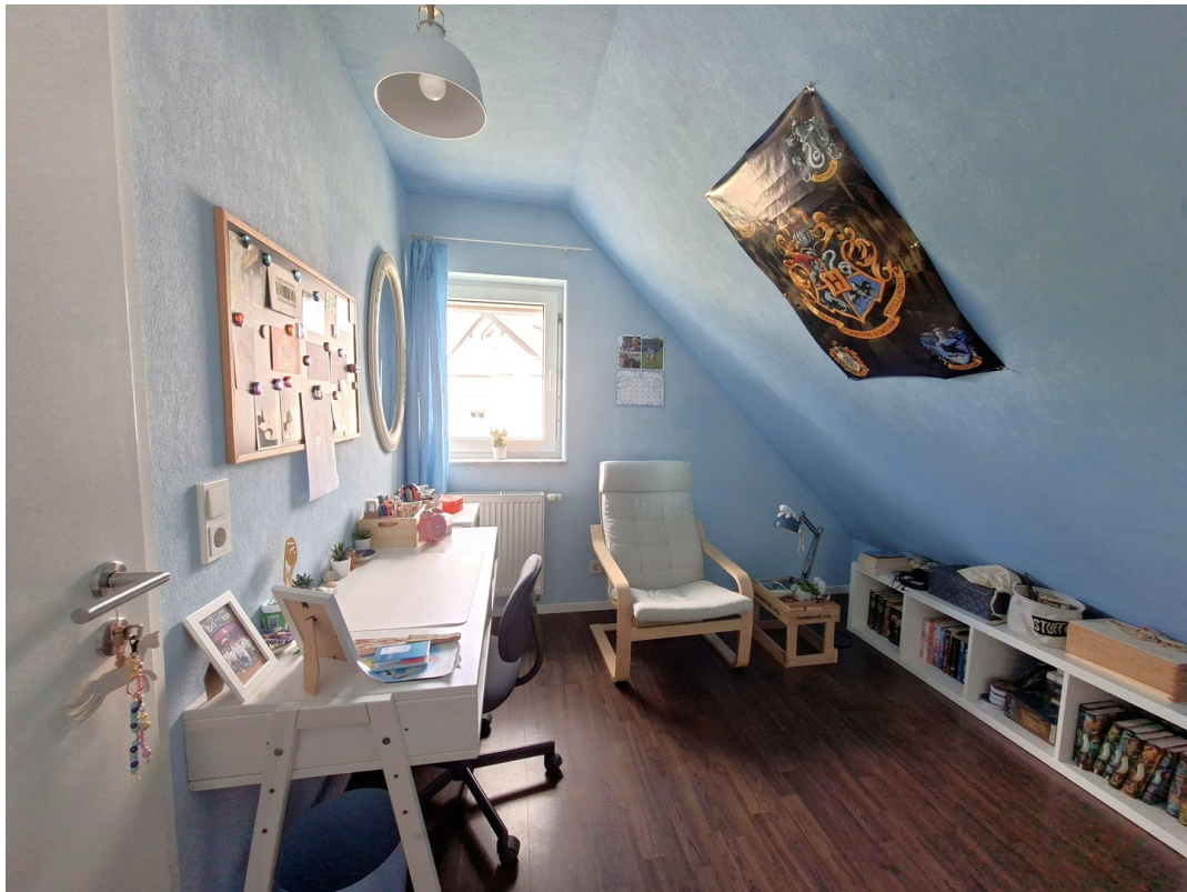
Schlafzimmer 4, DG