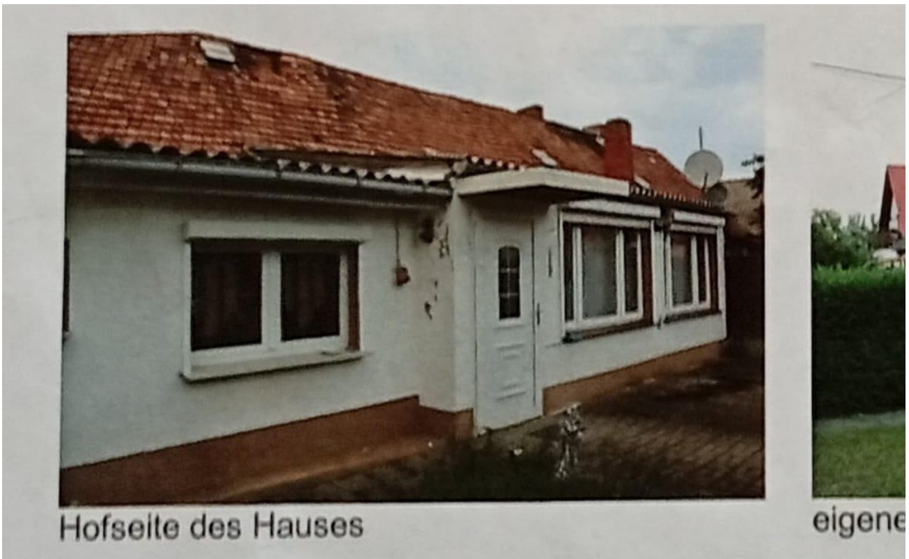
Hofseite des Hauses