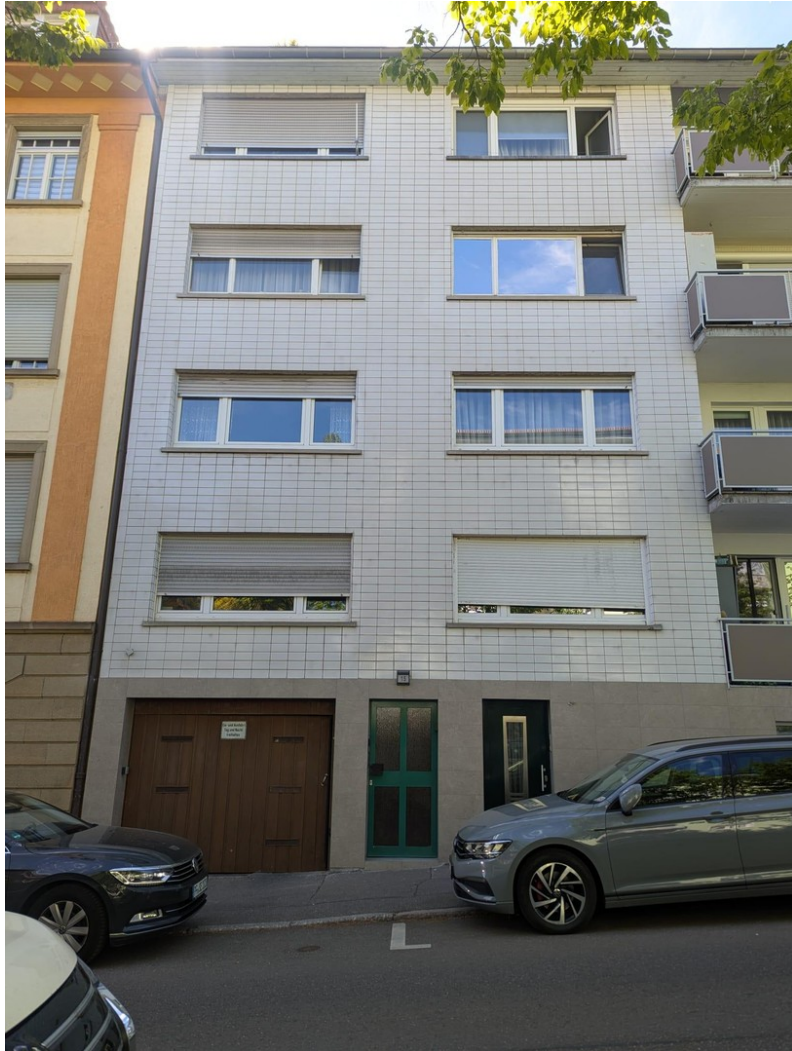
Ansicht von Außen